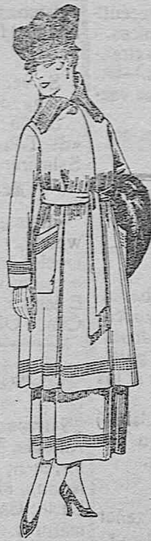
Trajes de sarga inglesa, en negro y azul, bordados De ptas. 85 a 100