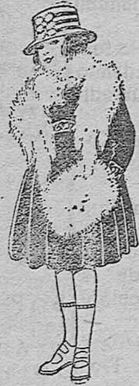
Juegos imitación Renard, blanco. A ptas. 79.