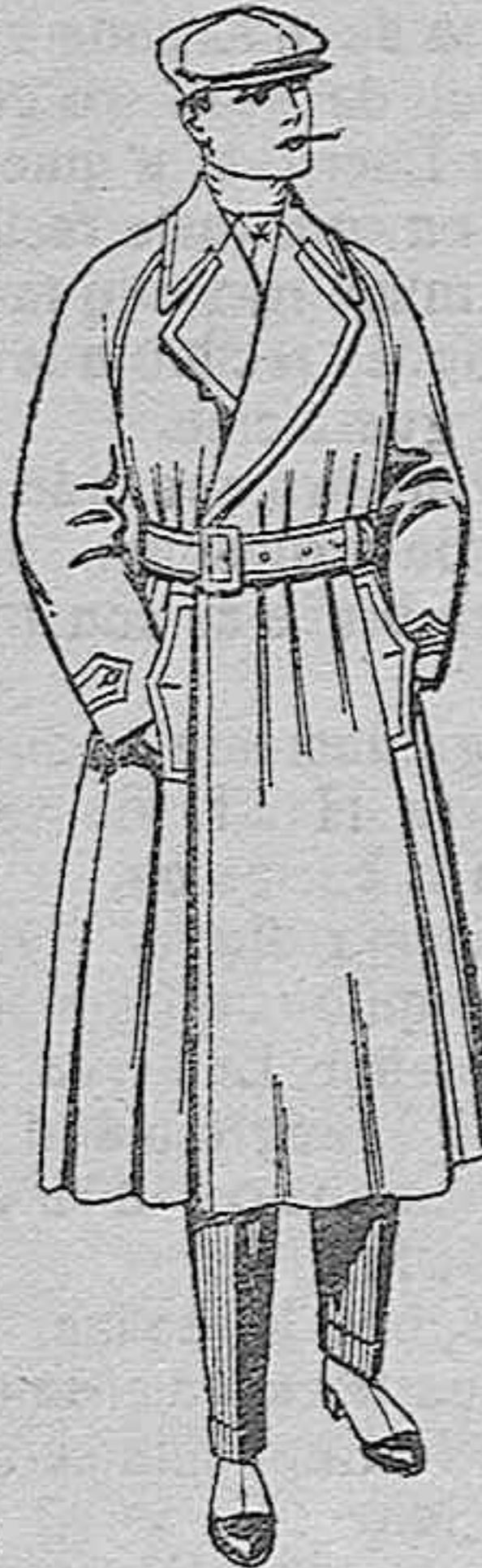
Gabanes impermeabilizados con cinturón, color beige. De ptas. 43 a 111

Ultima novedad en echarros, manguitos, pelerinas, corbatas, abrigos, etc., en pieles de loutre, taupa, vison, renard, zibelino, armiño, etc., auténticas e imitación perfecta.