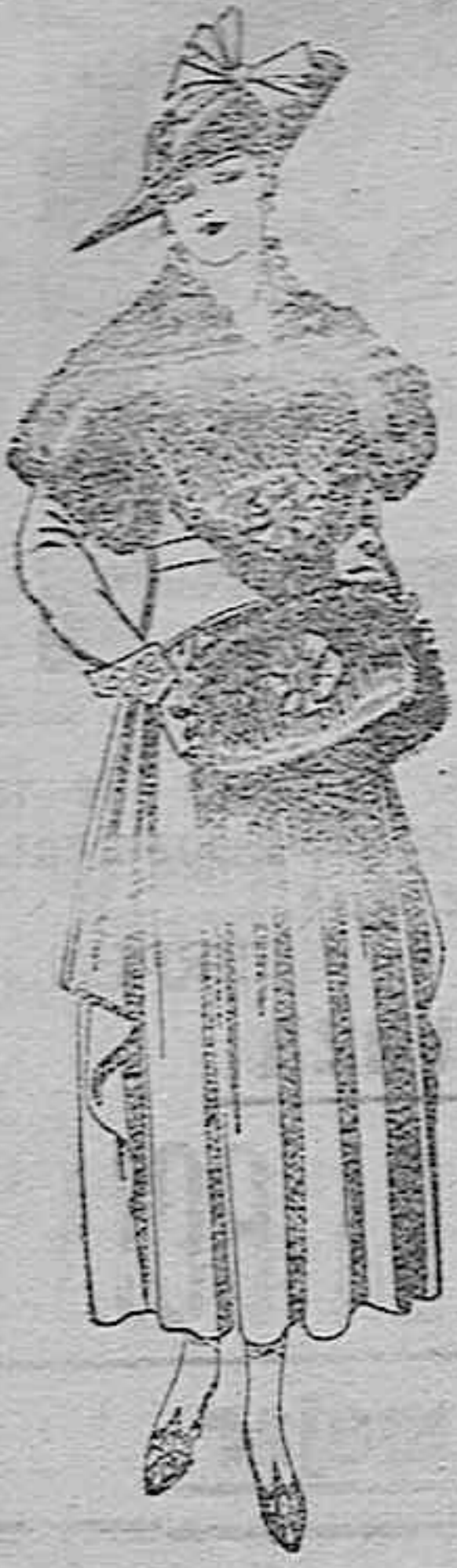
Juegos de pieles, negro, imitación Renard. Gran chf. A ptas. 58.