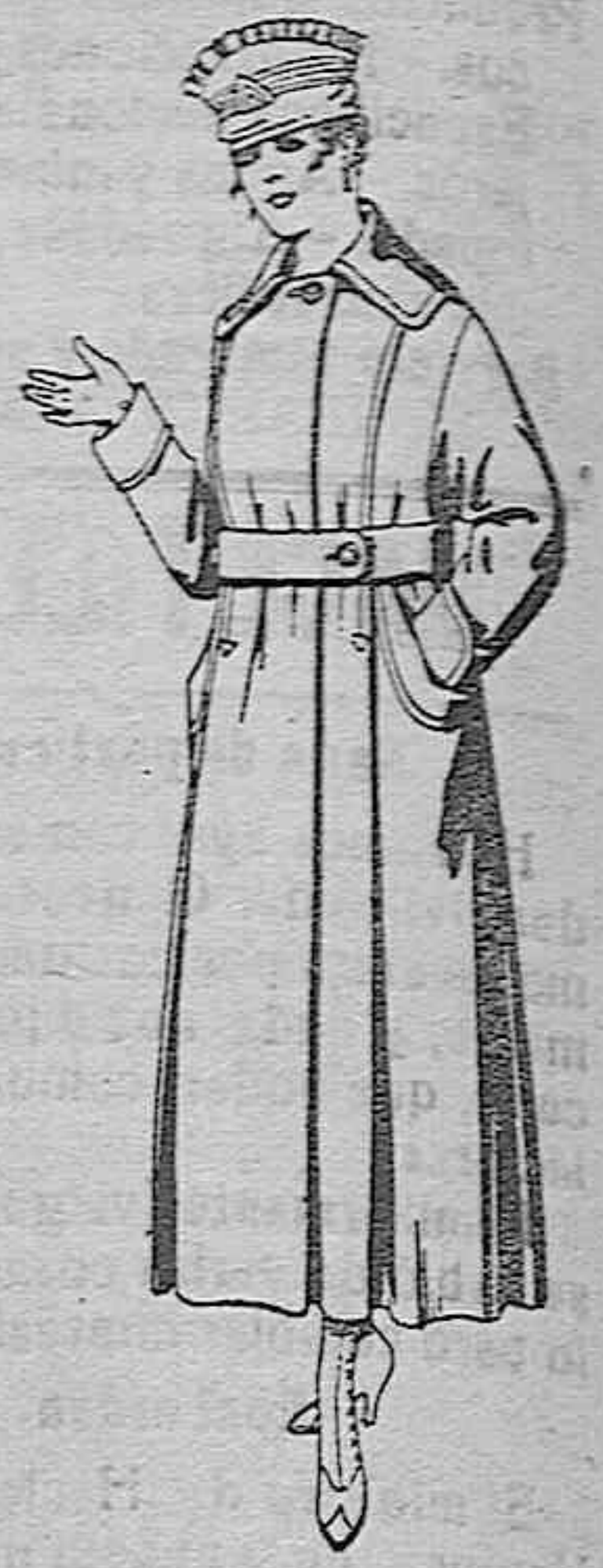
Abrigos de cheviot o gamuza en azul, negro y colores De ptas. 45 a 55.