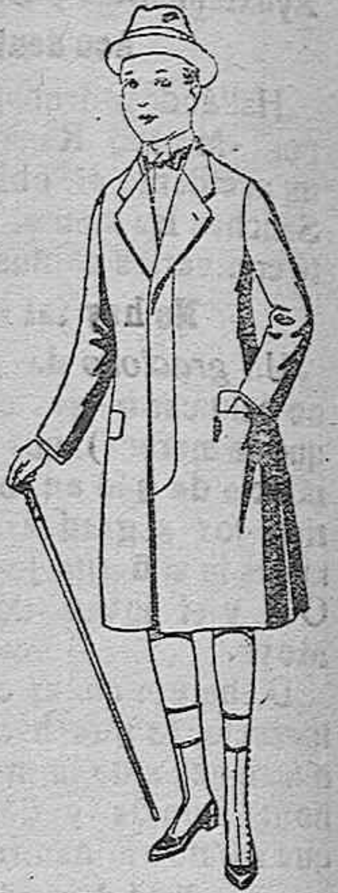
Gabanes de patén, para niños de 10 a 12 años. De ptas. 18 a 55. Los mismos, para juveniles de 13 a 16 años. De ptas. 21 a 58