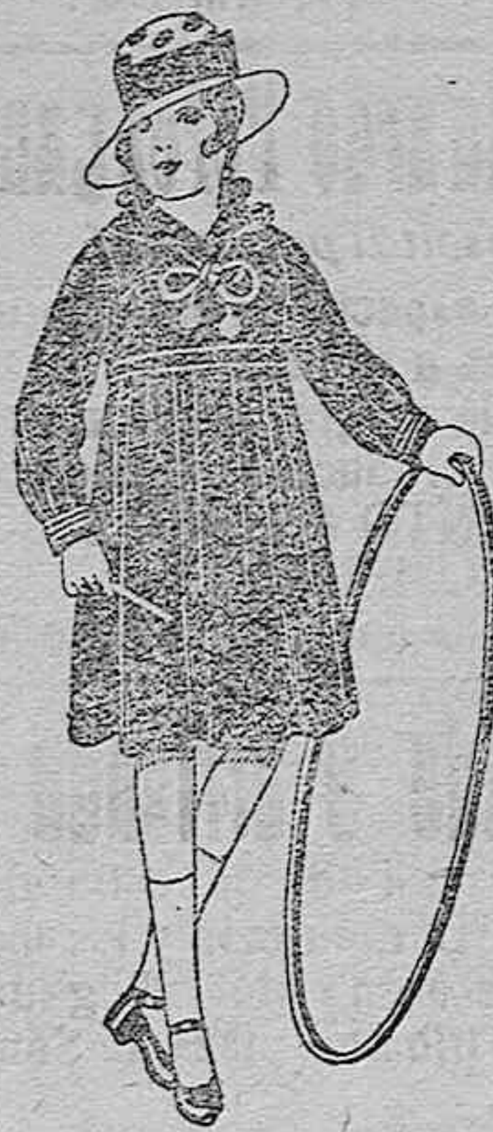
Vestidos marinera, de sarga o estambre azul, adornos seda blancos. De ptas. 25 a 30