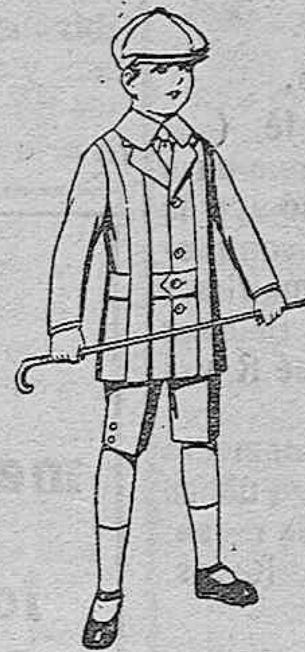
Trajes de patén, modelo «Norfolk» para niños de 4 a 9 años. De ptas. 14 a 35