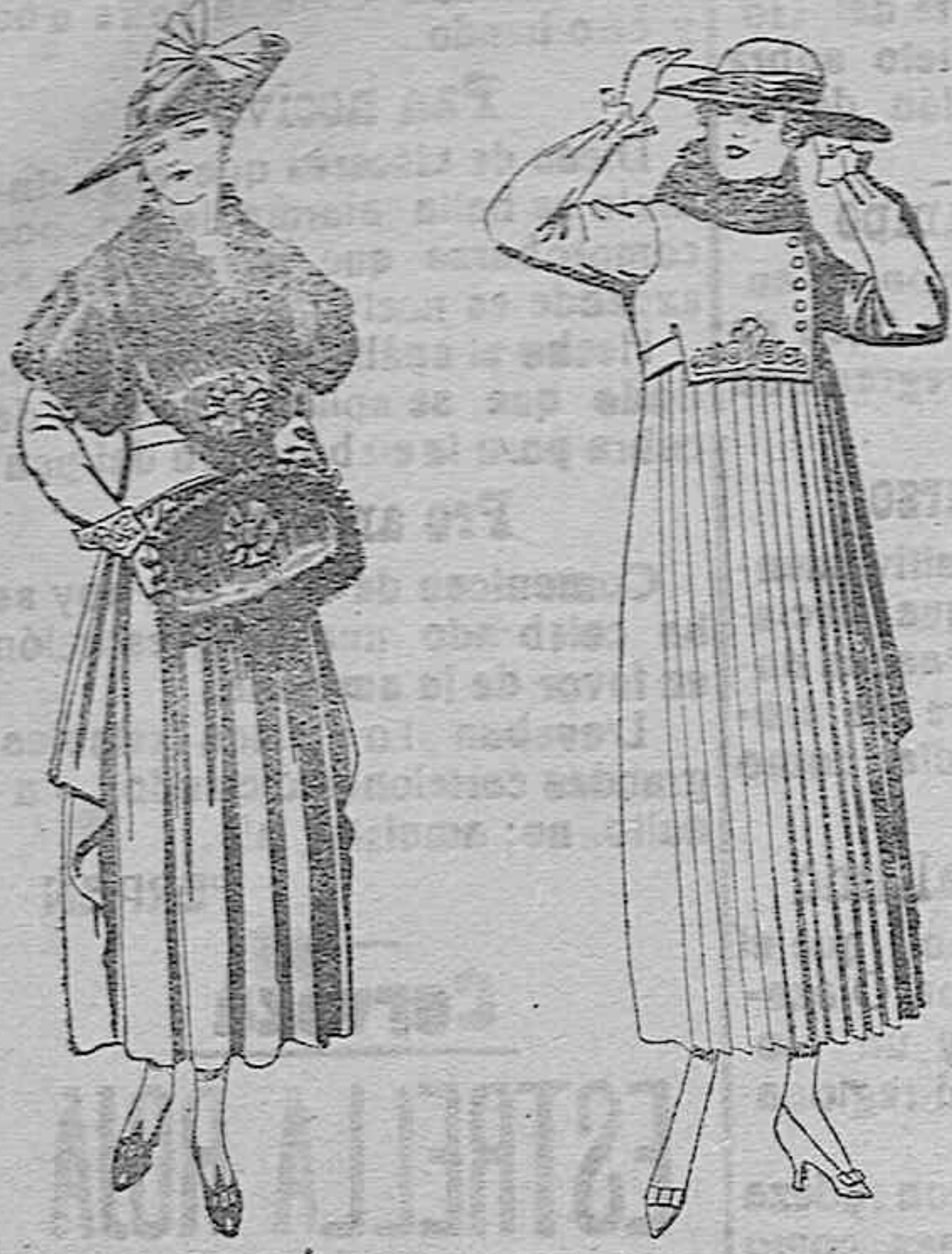
Juegos de pieles, negro, imitación Renard. Gran chic. A ptas. 68.

Ropas confeccionadas para caballero, señora, NIÑO Y NIÑA