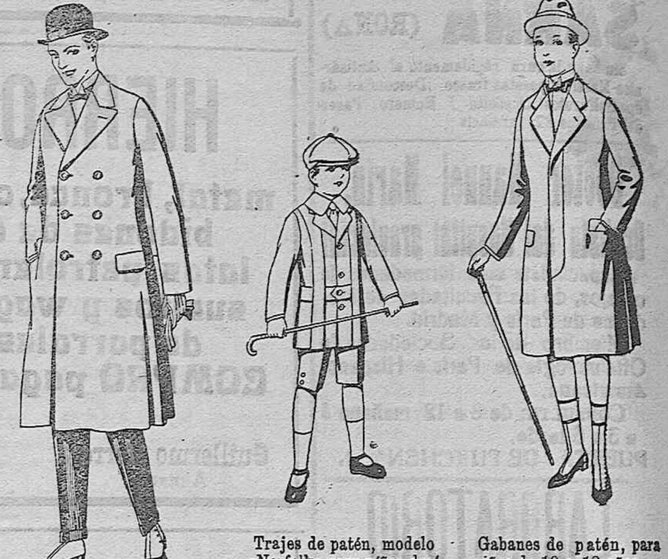
Gabanes de patén, gamuza o Cover. De ptas. 50 a 110

PRECIO FIJO VENTA AL CONTADO Pídanse el catálogo general