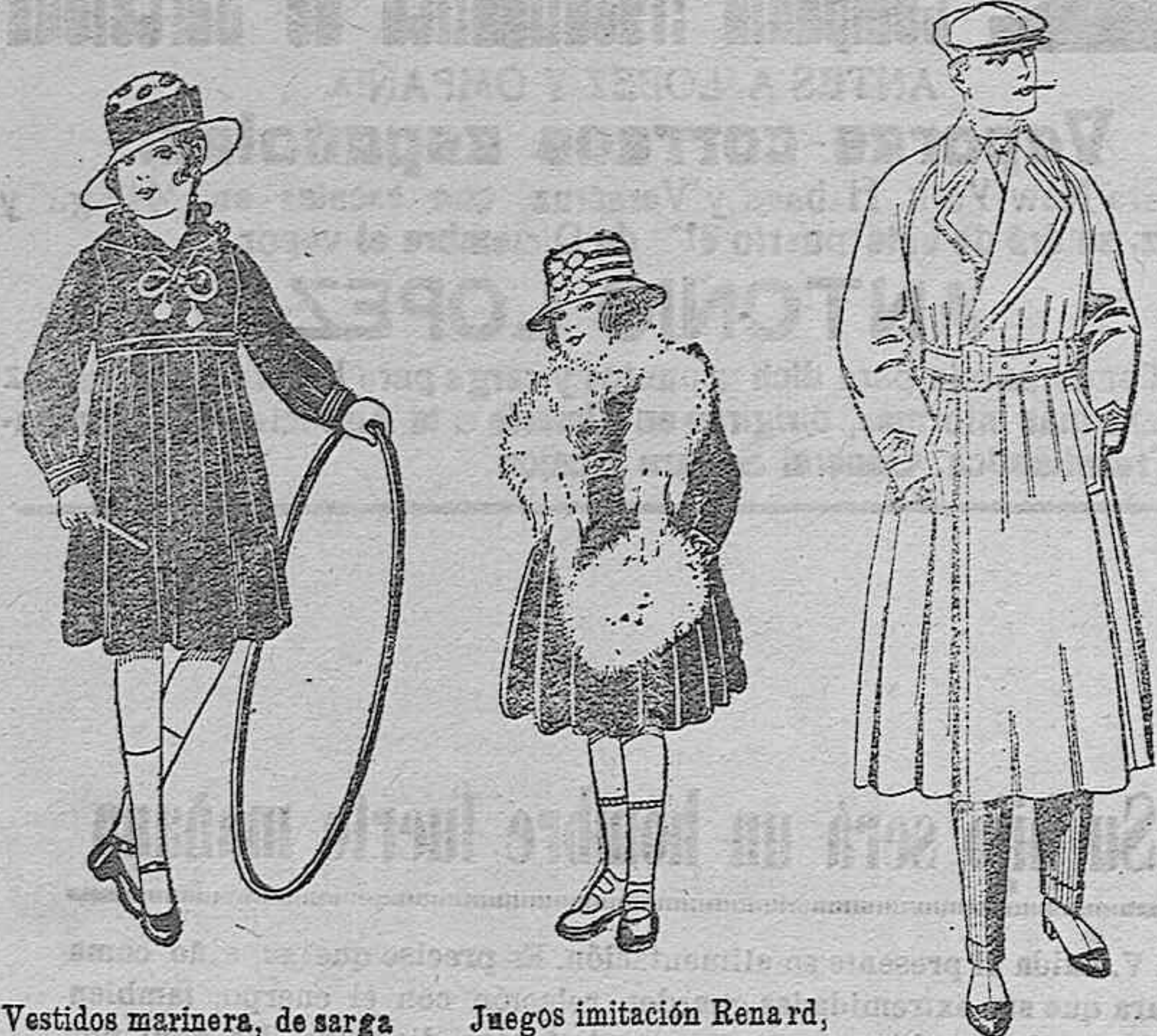
Vestidos marinera, de sarga o estambre azul, adornos seda blancos. De ptas. 25 a 30