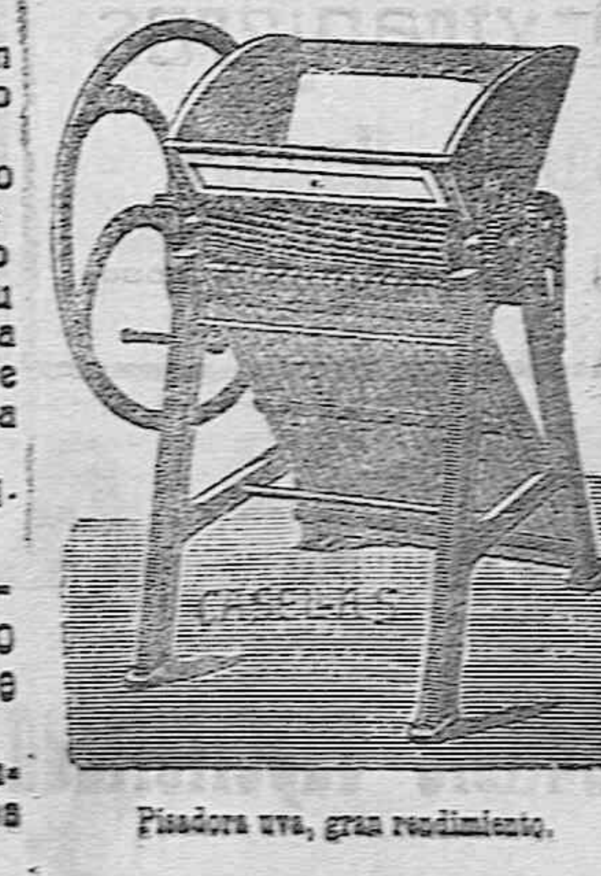
Pisadora uva, gran rendimiento.