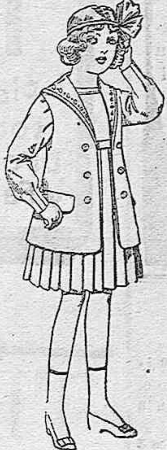
Trajes de gabardina blanco, cuello de ergandín bordado, para niñas de 4 a 9 años, de pts. 22 a 24