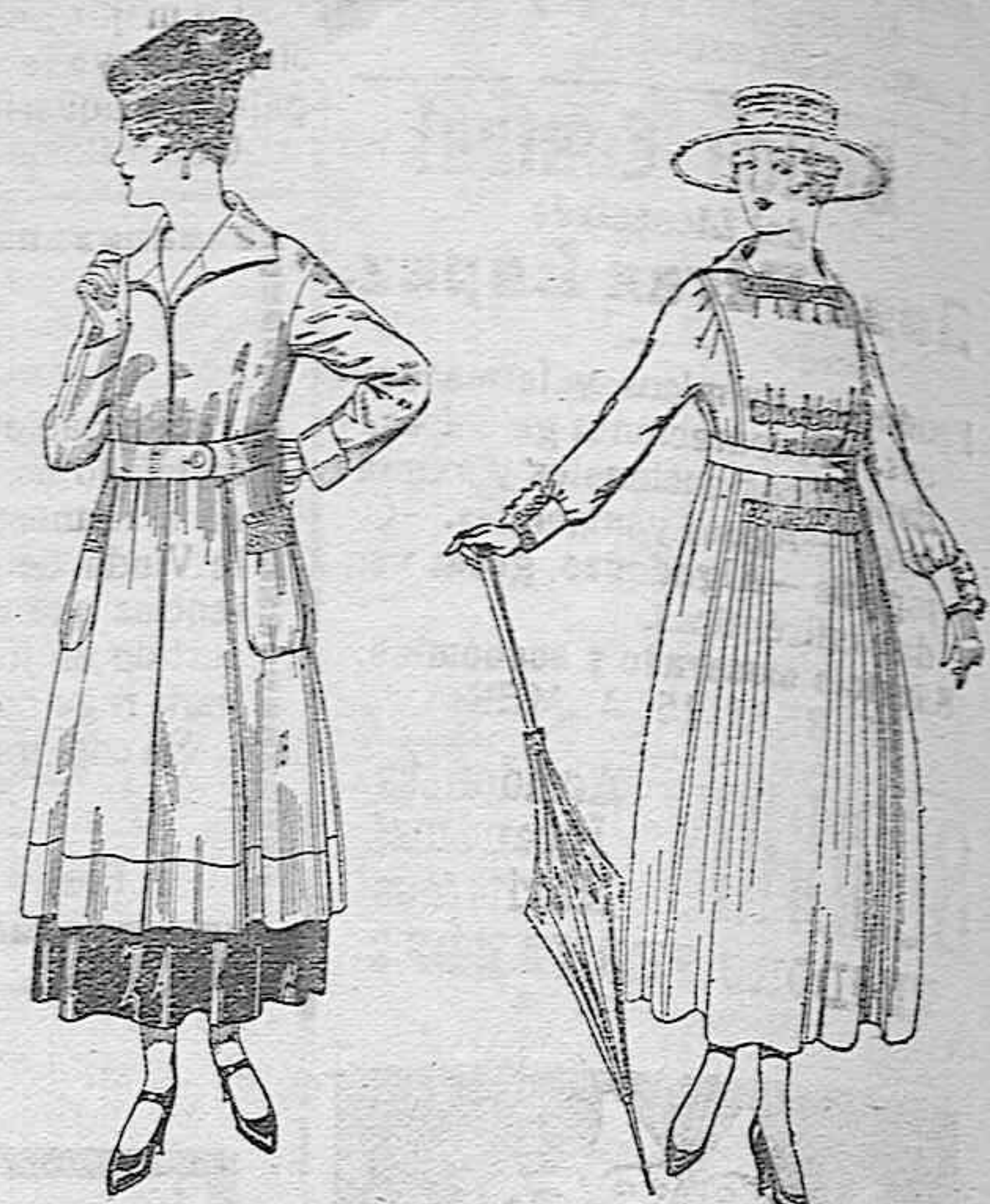
Abrigos de tricot de lana, en colores lisos, de pesetas 65 a 75.