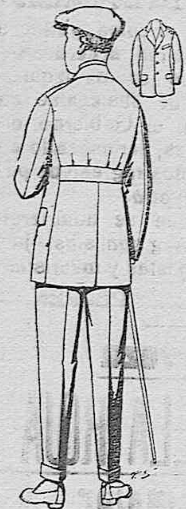
Trajes modelo sport, de lanilla, mellón, etc., para jovencitos de 10 a 15 años, de pts: 27 a 62. Los mismos en dril de pts. 11 a 21.