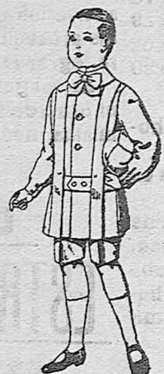
Trajes de lanilla para niños de 4 a 9 años de pts. 12 a 31.