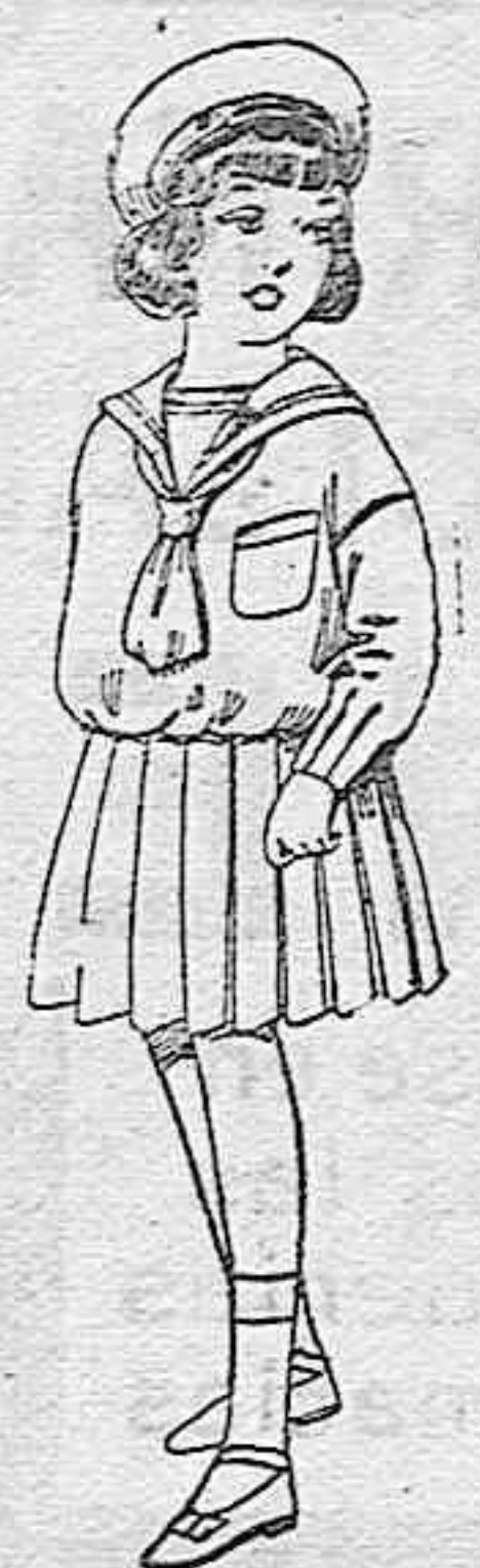
Trajes de marinera de lanilla azul para niñas de 4 a 9 años de pts. 32 a 38. Los mismos de dril blanco de 13 a 24 pts.