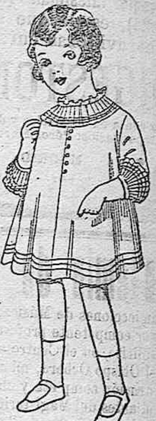
Vestidos de seda blanca bordados de pesetas 6'75 a 8.