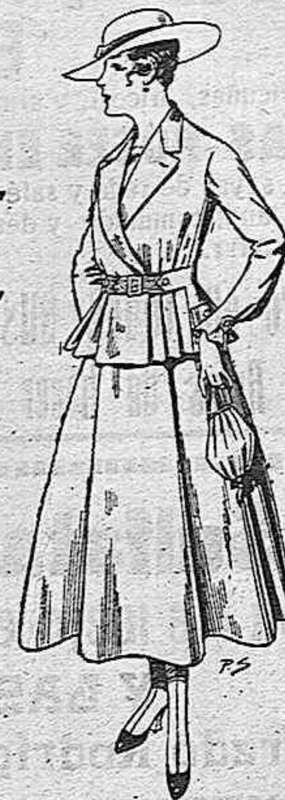
Trajes de lanilla para señora A pesetas 70