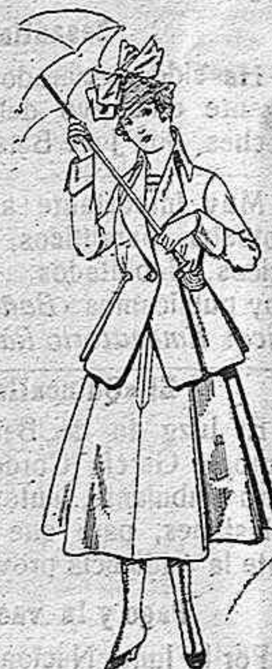
Trajes de lanilla para jovencitas de 13 a 16 años De pesetas 55 a 55