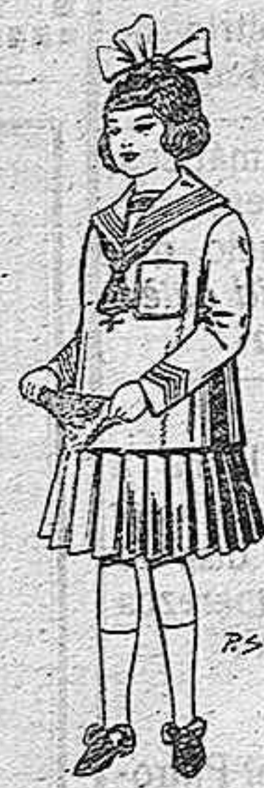
Trajes de lanilla para niñas de 4 a 12 años De pesetas 32 a 40