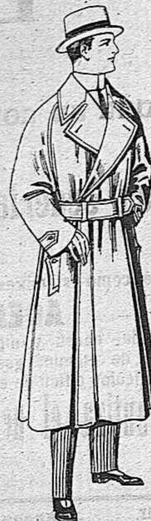
Gabanes Impermeabilizados en color blige De pesetas 65 a 100.