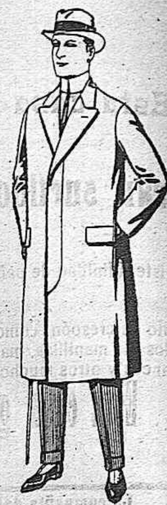
Pardeus de melton o vicuña De pesetas 25 a 100