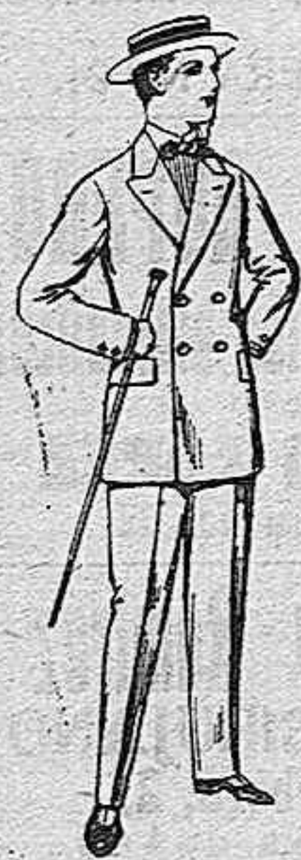
Trajes de lanilla para jovencitos de 10 a 16 años De pesetas 17 a 48.