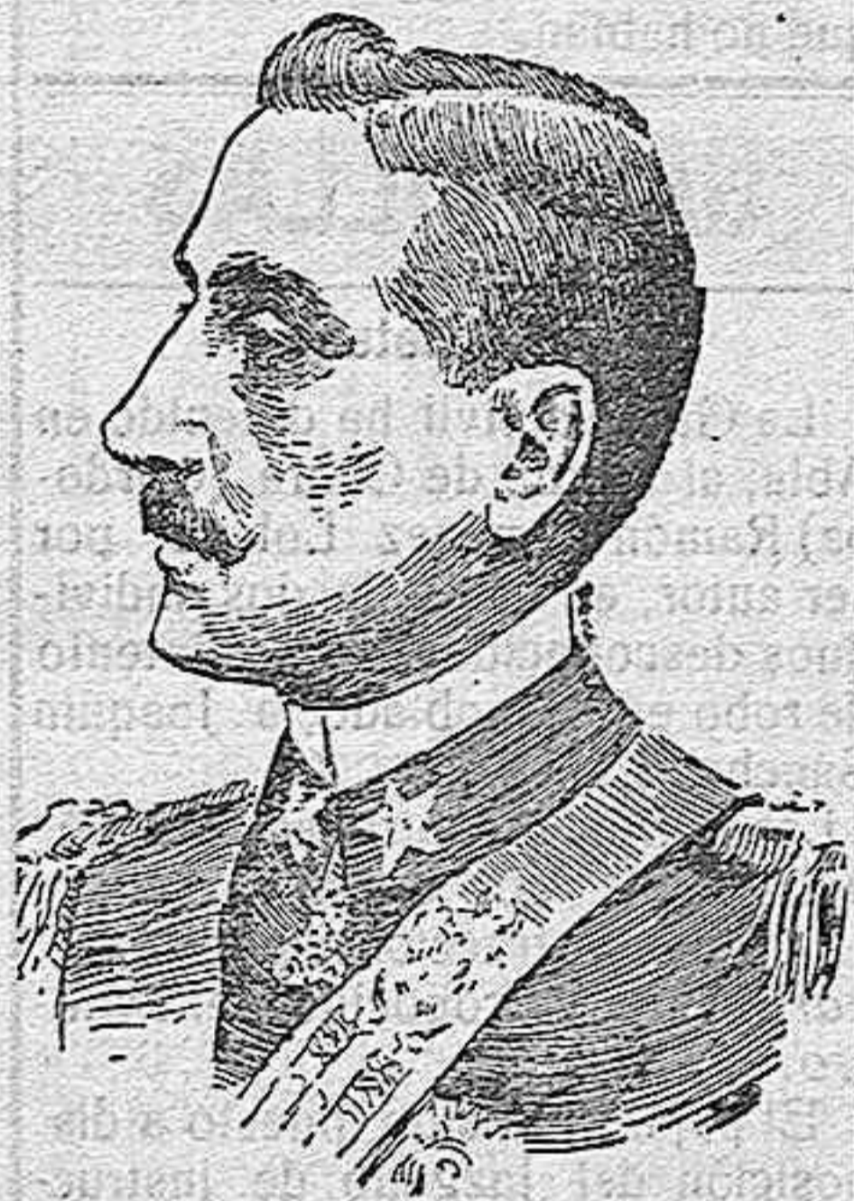
El Duque de las Abruzzo, de Italia