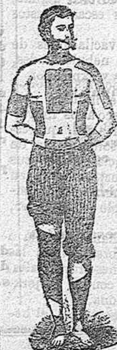
Franco Mark Registered