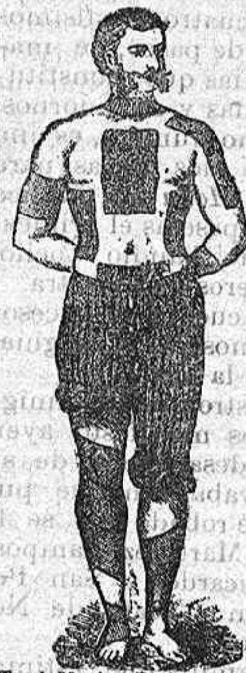
TradeMark & Registered.

PERFORADOS AMERICANOS DE FILTRO ROJO DEL doctor Winter.