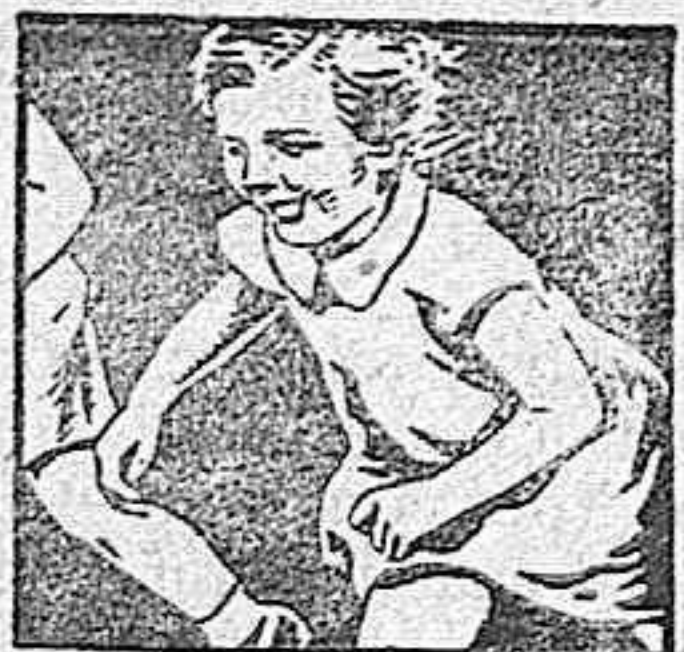
LO MEJOR PARA LAS CONTUSIONES