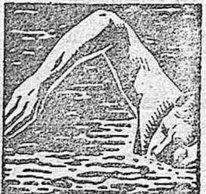
DESPUES DEL EJERCICIO REANIMA