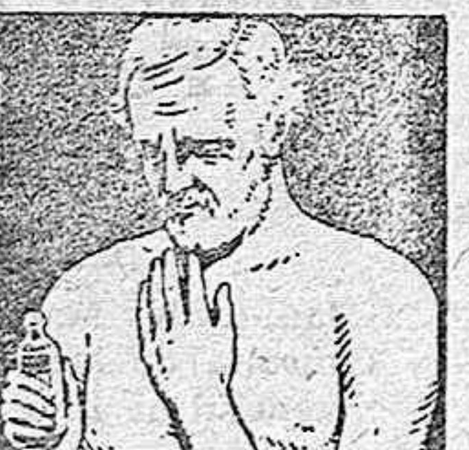
NO ES PRECISO FROTAR NI VENDAR