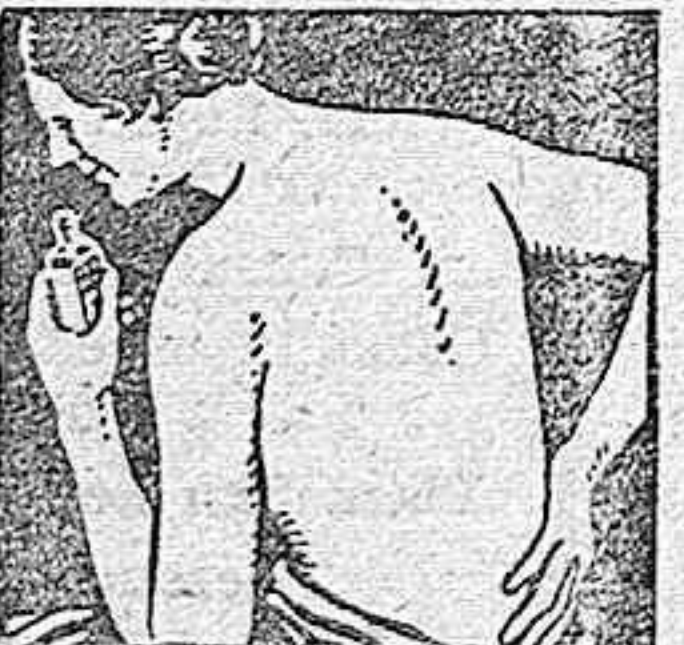
NO MANCHA NI IRRITA NUNCA