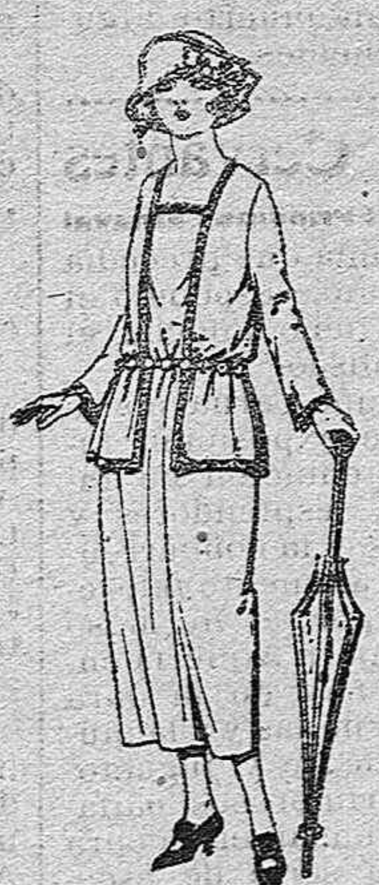
Vestidos de gabardina, sarga inglesa, etc., en negro, azul y color, adornos cir ta seda de ptas. 63 a 90