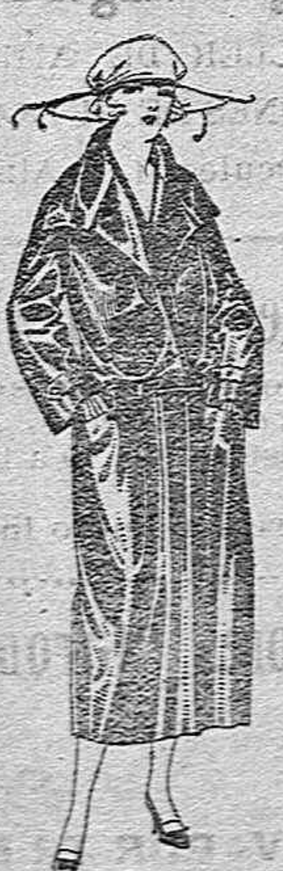
Abrigos de seda impermeables, en negro azul y color de ptas. 180 a 225