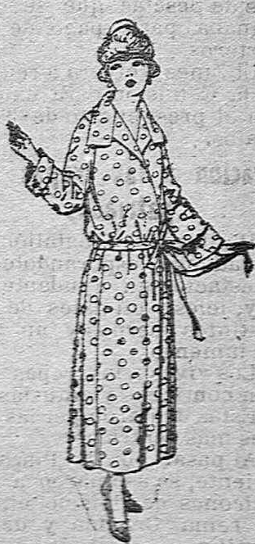
Ratas de perca, voile listado, etc. de ptas. 16 a 28

Boas, Camisería, Géneros de punto, Corbatería, Zapatería, Paraguas, Bastones, y Artículos de Viaje