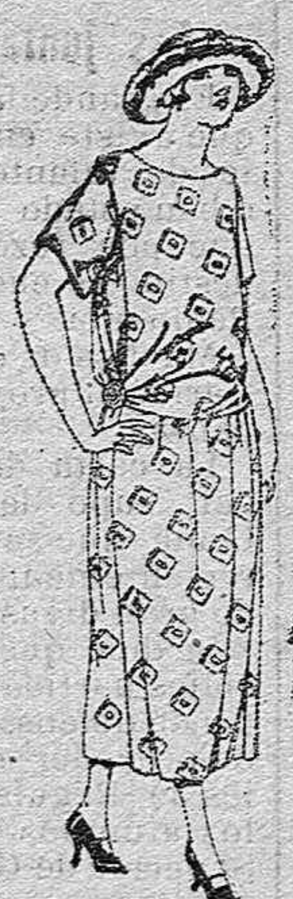
Vestidos de foulard de algodón, dibujos fantasia. de ptas. 35 a 50