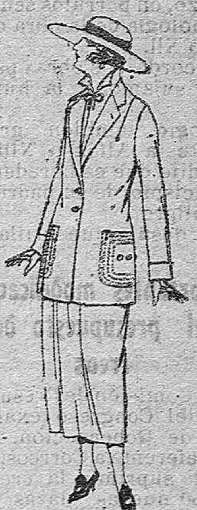
Trajes sastre, de popeline, gabardina, etc., adorno púrpura seda, chaqueta forrada de seda; en negro, marrón y colores moda de ptas. 110 a 140