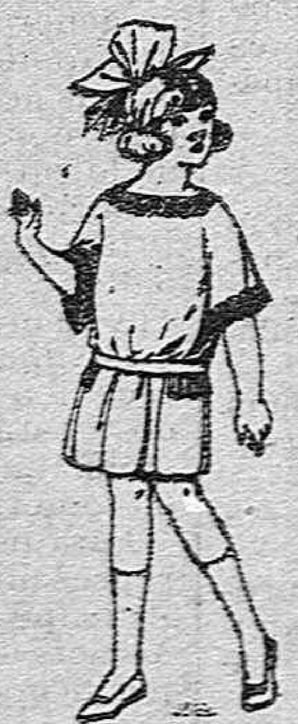
Vestidos de sarga inglesa, popelin, etc., en azul y colores moda para niñas de 4 a 9 años de ptas. 25 a 35

ROPAS COMPLETAMENTE PARA CABALLERO, SEÑORA NIÑO Y NIÑA