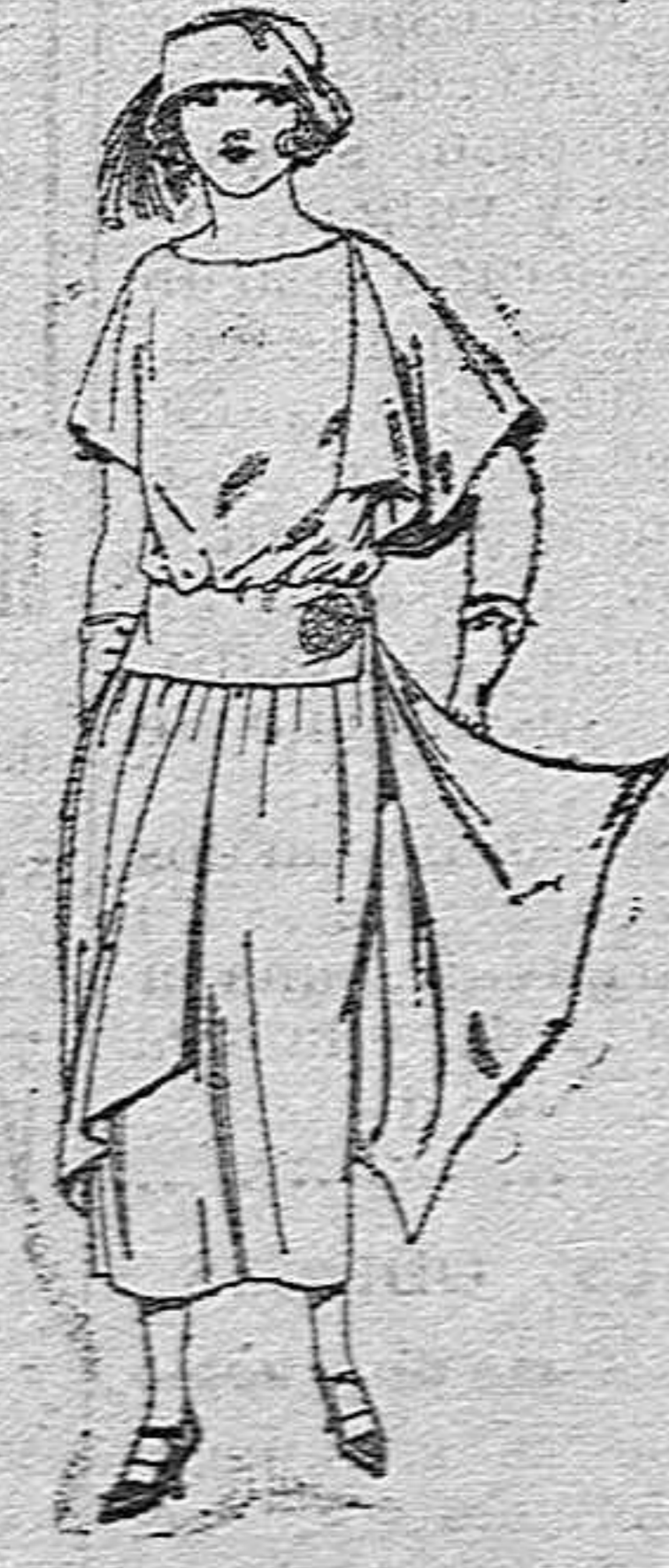
Vestidos de crepon de China, en negro, azul y colores moda, adornos hebillas metal de pta. 135 a 190