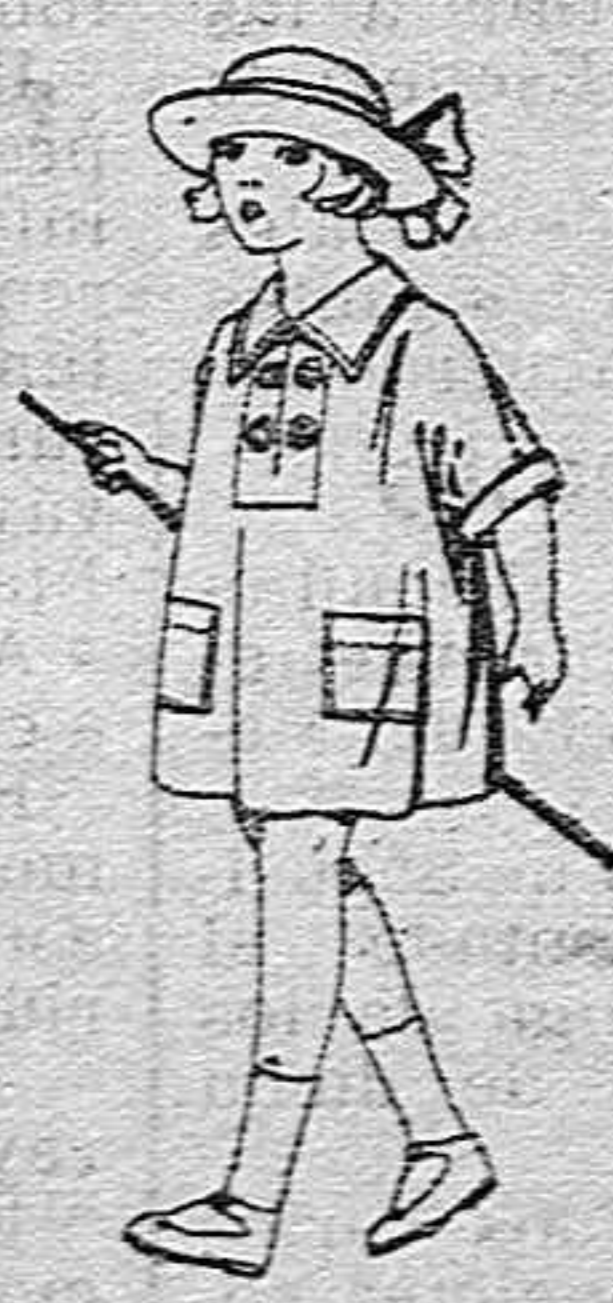
Vestidos de batista blanca, adornos bordados, para niñas de 3 a 6 años. de ptas. 6 a 8

ROPAS COMPLETAMENTE PARA CABALLERO, SEÑORA NIÑO Y NIÑA