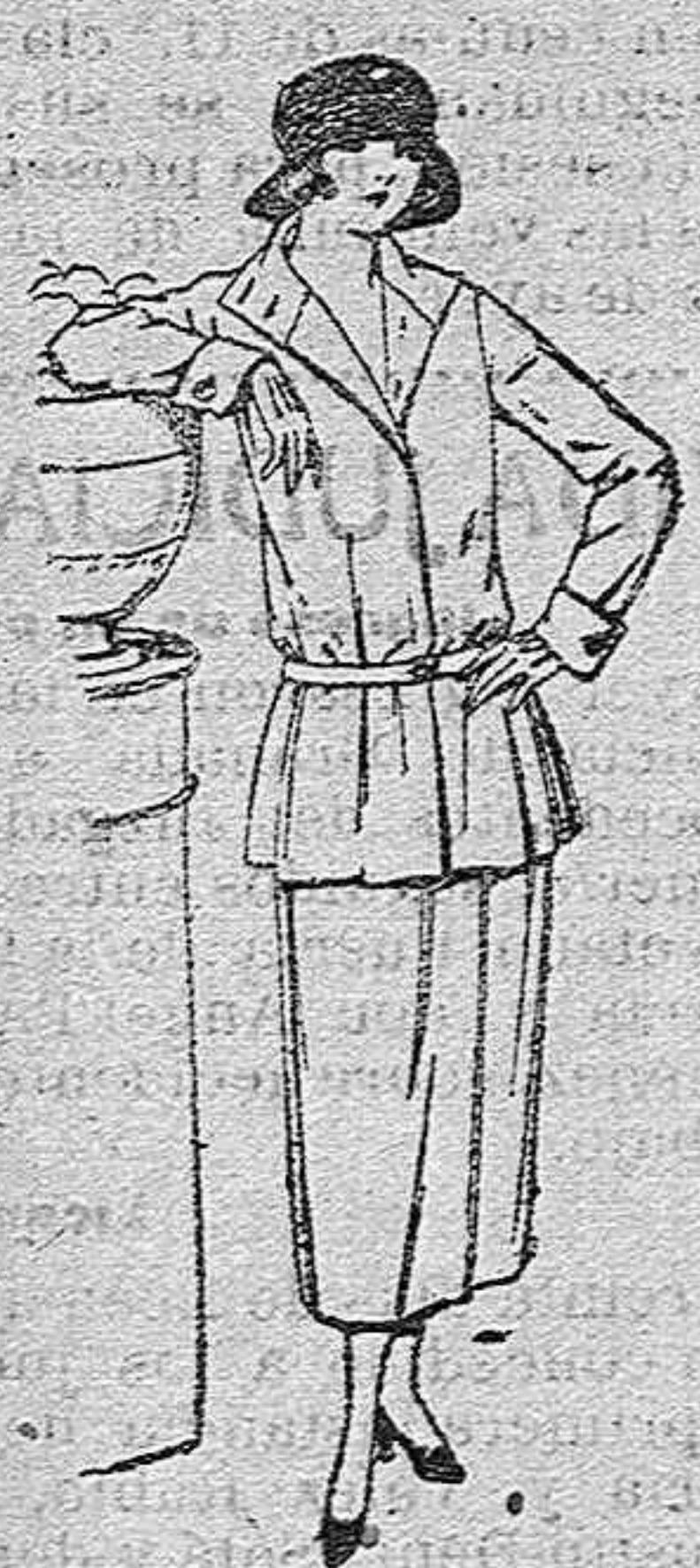
Trajes sastre, de estambre, gabardina, etc., chaqueta forrada de seda, en negro, marino y colores de moda. de ptas. 115 a 145

SUCURSALES: Madrid, Barcelona, Alicante, Bilbao Cádiz, Cartagena, Gijón, Granada, Málaga, Palma de Mallorca, Santander, Sevilla, Valencia, Valladolid Zaragoza.