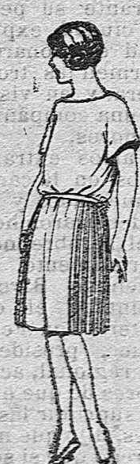
Vestidos de sarga inglesa, gabardina, etc., en azul y color, adornado de pespunte seda. de ptas 55 a 70