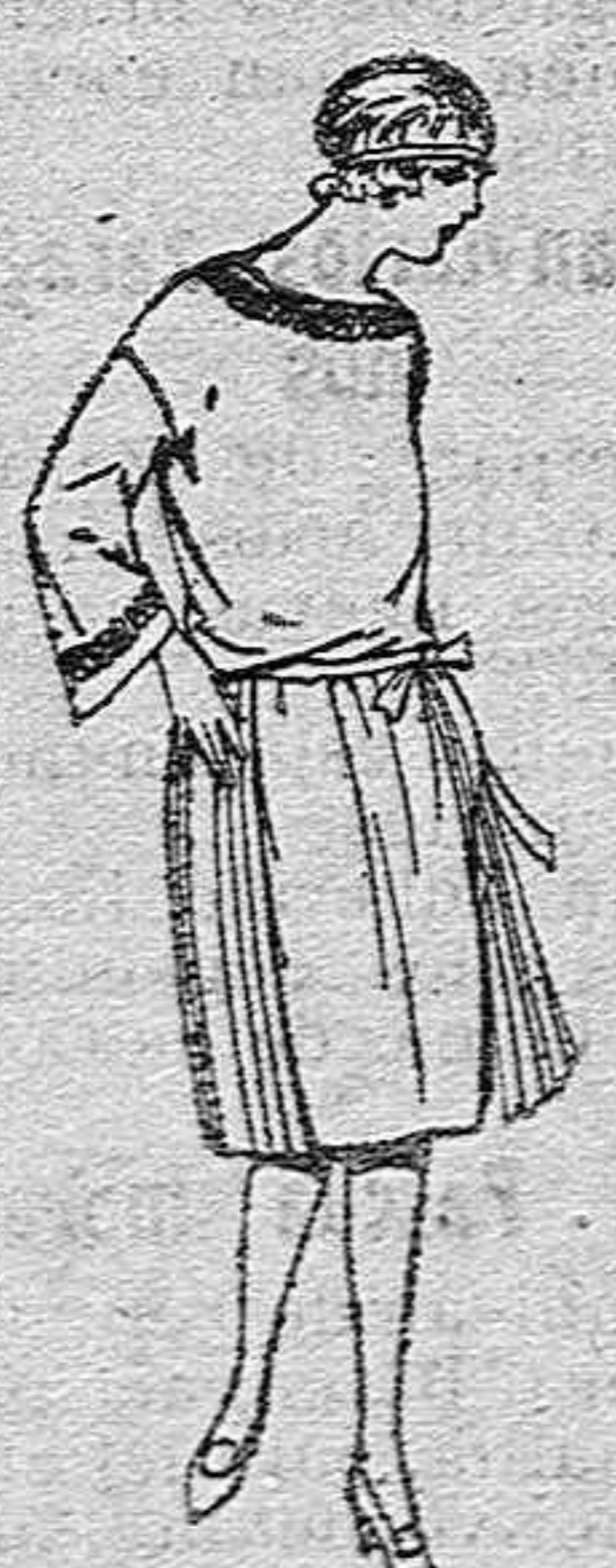
Vestidos de popeline, sarga inglesa, etc. en azul y color, adornos bordados, para jovencitas de 13 a 15 años. de ptas. 60 a 78