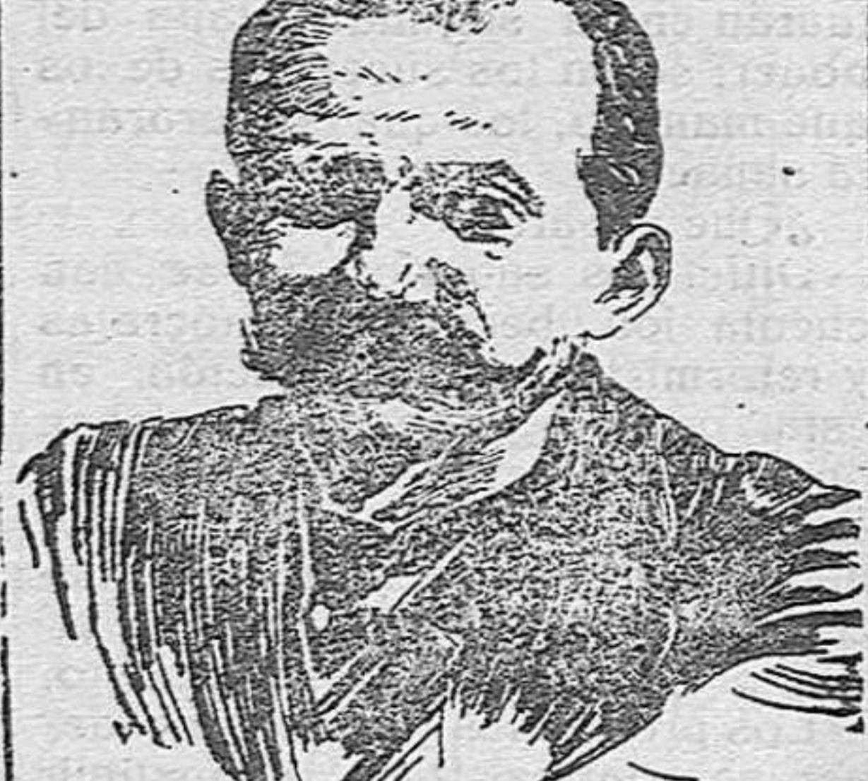
Presidente del Consejo de Ministros, conde de Romanones.