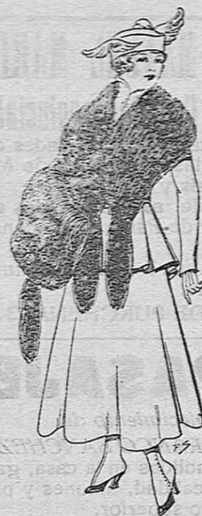
Juego de pieles imitación perfecta al renard negro. De pesetas 40 a 45.