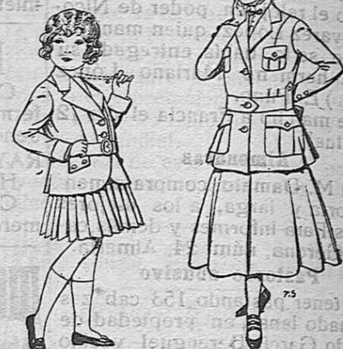
Trajes de lanilla para niñas de 4 a 12 años. De pesetas 20 a 35