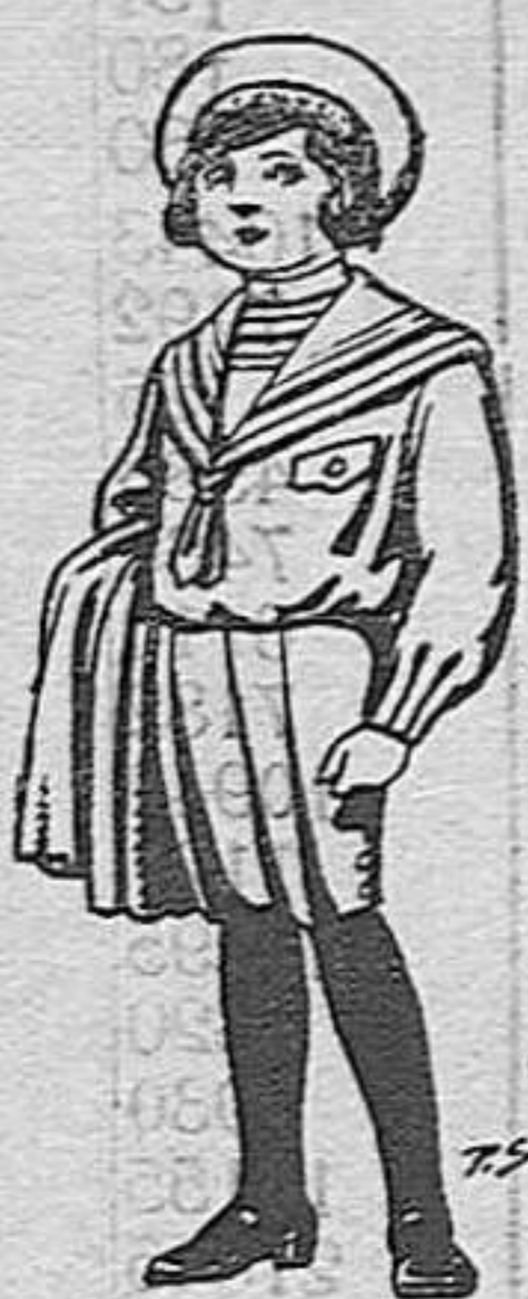
Trajes de jerga negra o azul para niños de 4 a 9 años. De pesetas 5 a 10.