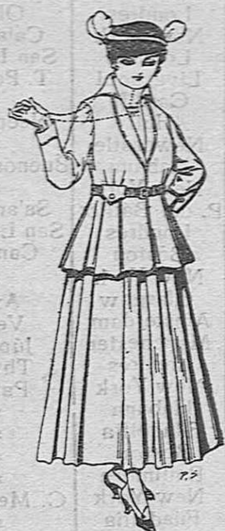
Trajes de lana negra, azul y de color, para señora. A pesetas 85.