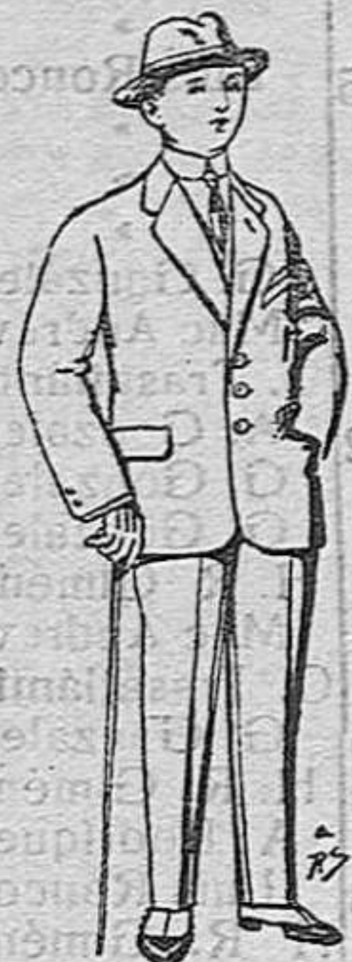
Trajes de patén, vicuña o jerga para niños de 10 a 16 años. De pesetas 14 a 50