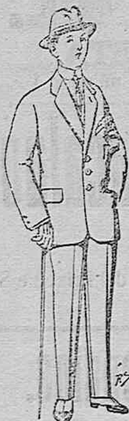
Trajes de patén, vicuña o jerga para niños de 10 a 16 años. De pesetas 14 a 50