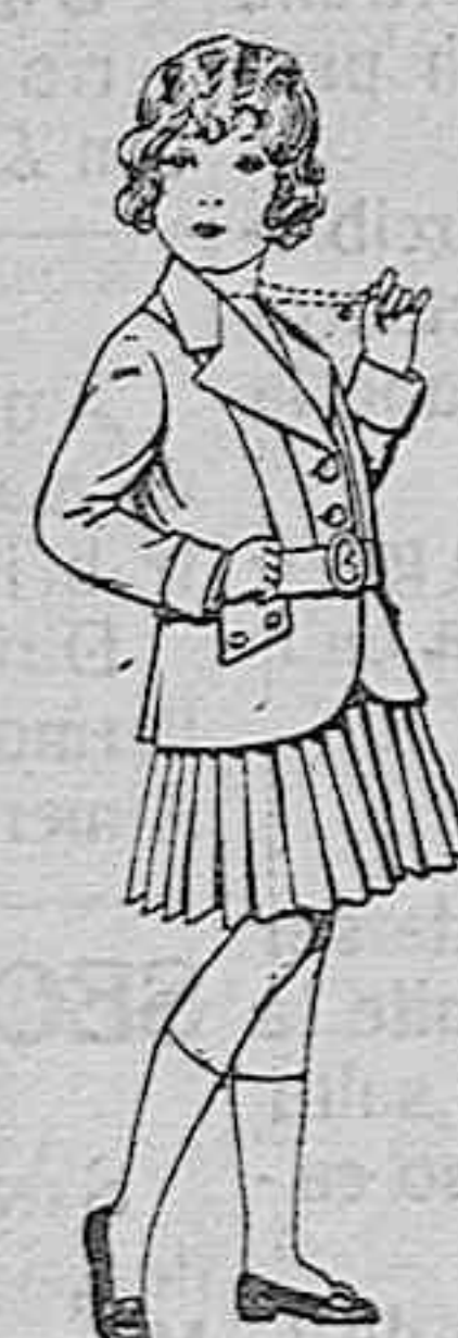
Trajes de lenilla para niñas de 4 a 12 años. De pesetas 20 a 35