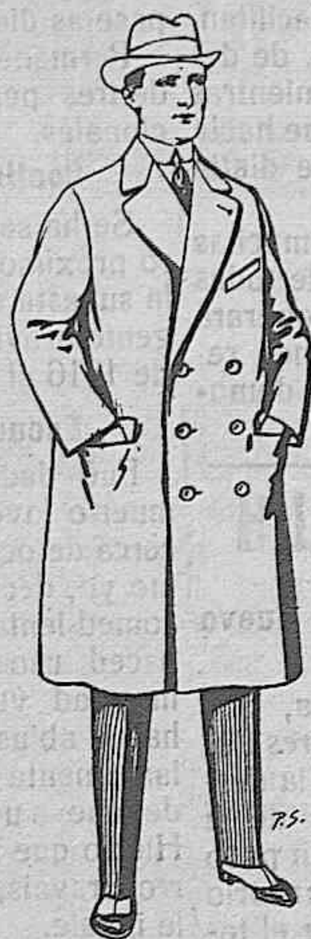
Gabanes de patén cheviot etc. De pesetas 55 a 105.