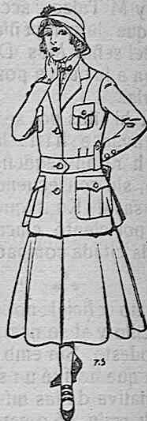
Trajes de lana para jovencitas de 13 a 16 años. De pesetas 40 a 45.