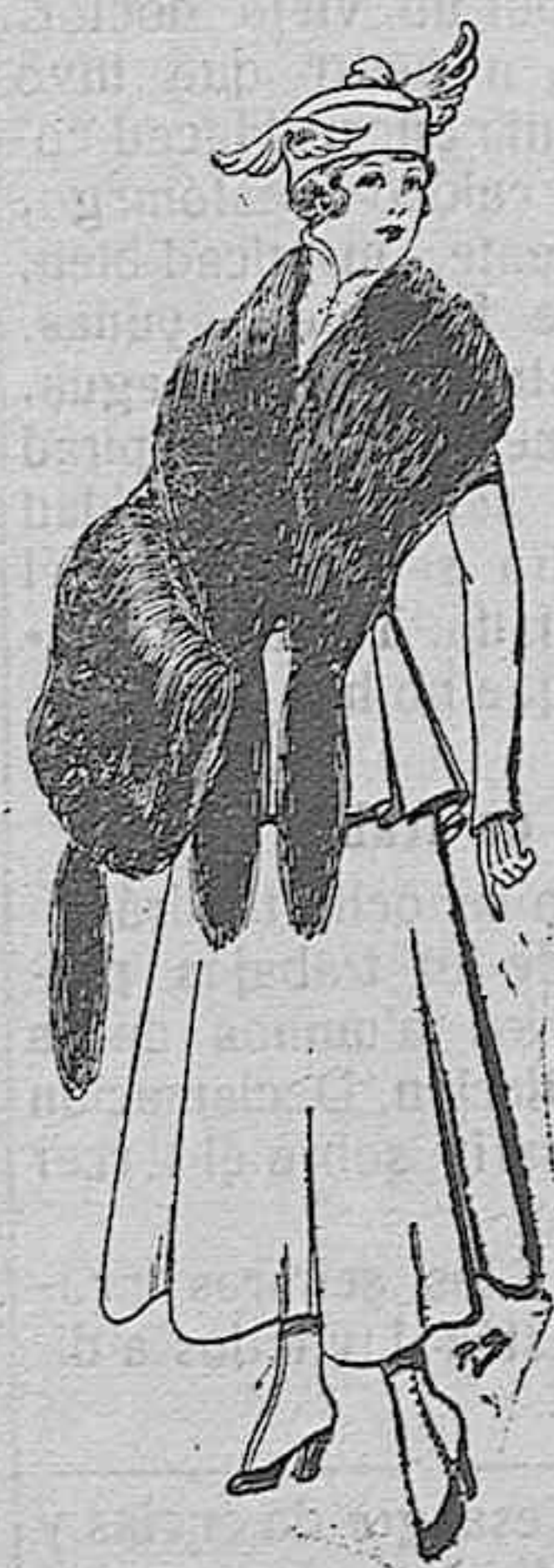
Juego de pieles imitación perfecta al renard negro. De pesetas 40 a 45.