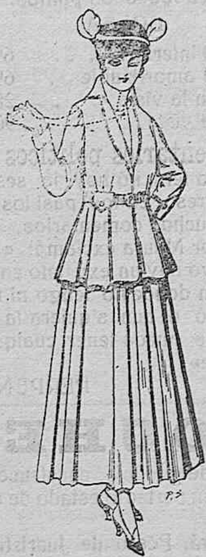
Trajes de lana negra, azul y de color, para señora. A pesetas 85.