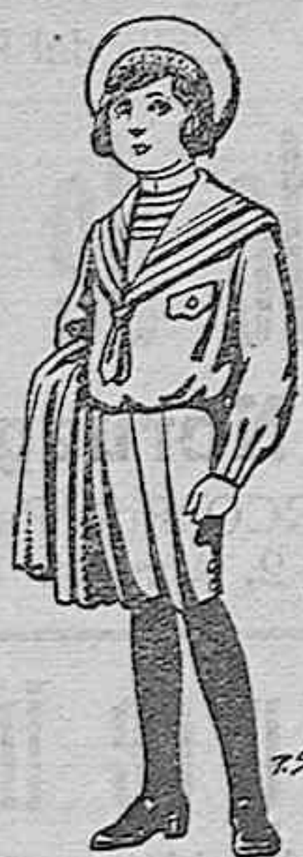
Trajes de jerga negra o azul para niños de 4 a 9 años. De pesetas 5 a 10.