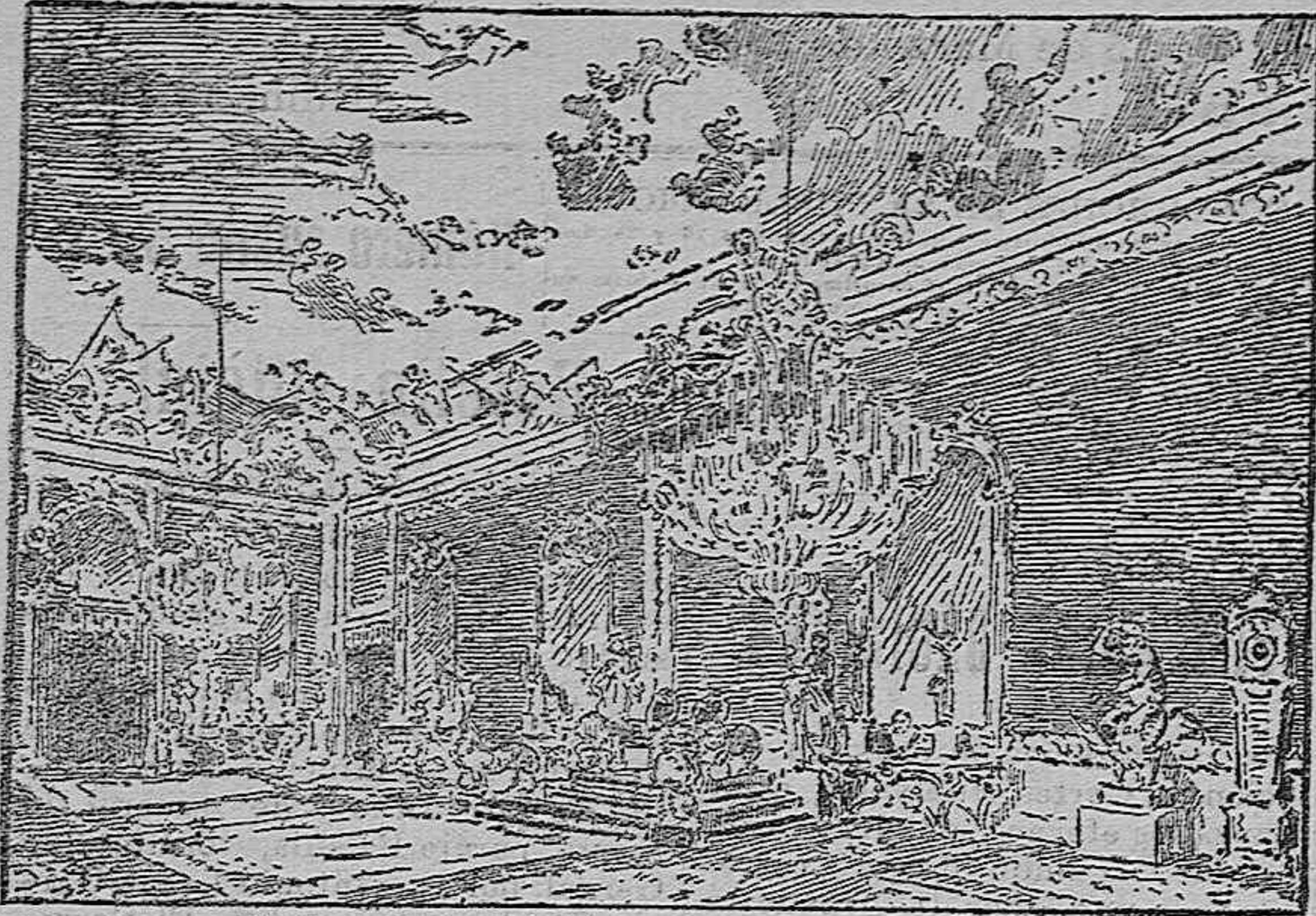
PALACIO REAL.—Salón del Trono.