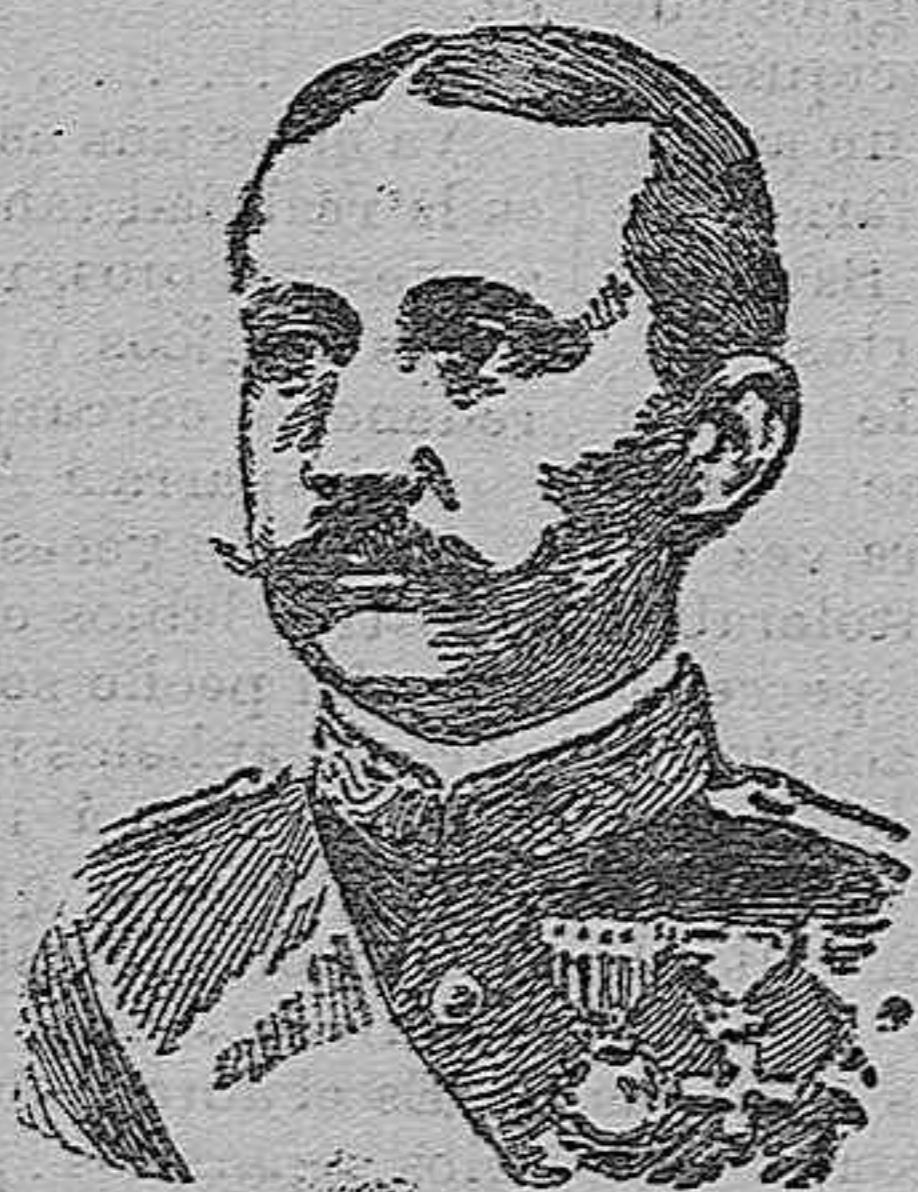
El príncipe de Asturias, D. Carlos de Borbón.

Nunca los habitantes de aquel territorio habían tenido un jefe tan afectuoso para ellos y que más universales simpatías mereciera. En calidad de teniente coronel del ejército inglés, el príncipe pidió y obtuvo permiso para formar parte de la expedición enviada contra los achantis. Apenas había desembarcado en la costa africana, cuando le atacó las terribles fiebres infecciosas causa de su muerte.