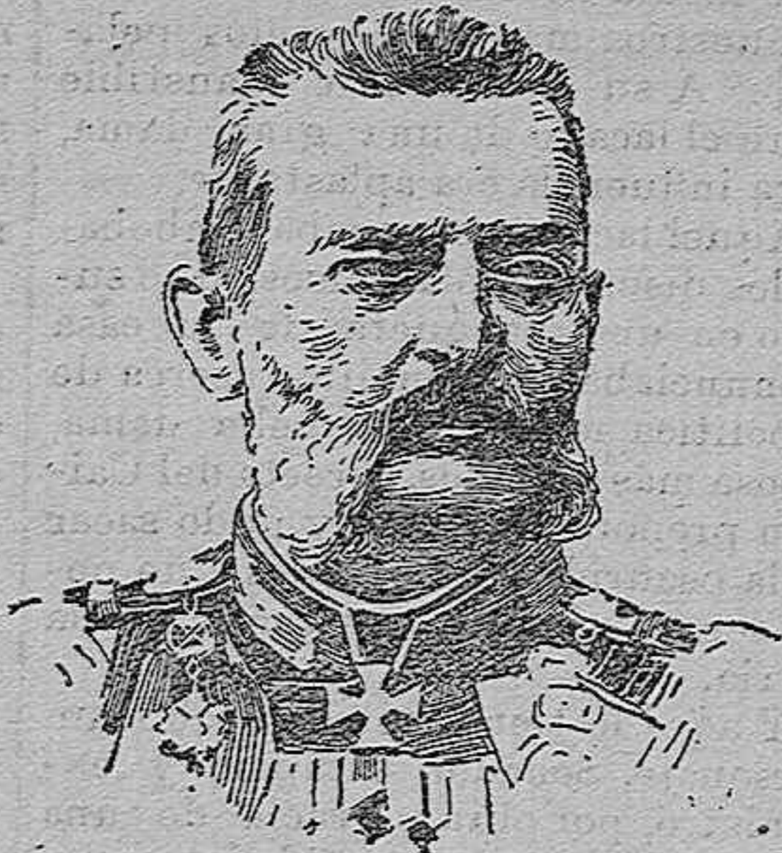
Gran duque Wladimiro, representante de Nicolás II en la boda del Rey.