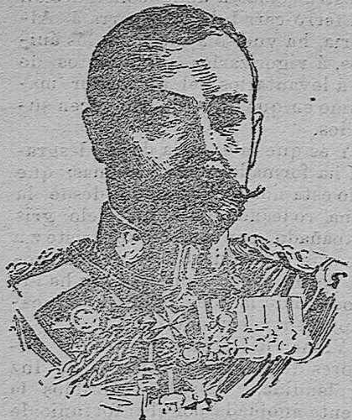
Príncipe de Gales, representante de Inglaterra en la boda de S. M. el Rey.

El polígono del Real Aéreo Club, durante los preparativos para la elevación de los globos que se ha verificado en Madrid.