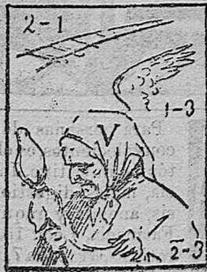
La solución mañana.