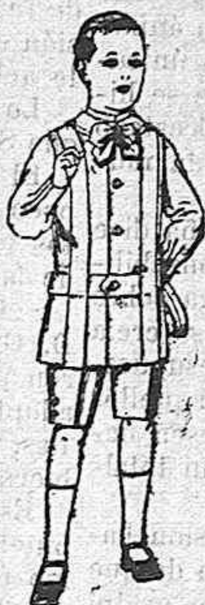
Trajes de lanilla, melton, etc. para niños de 4 á 7 años De ptas. 16 á 33.