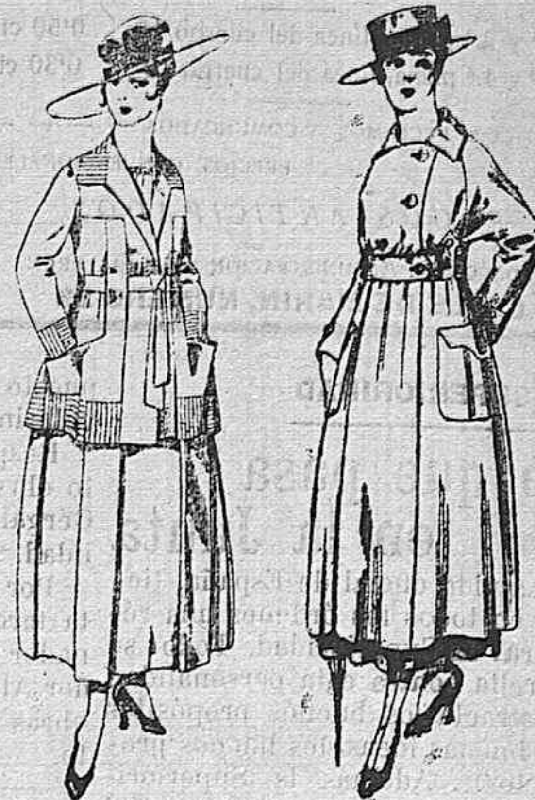
Trajes de lanilla negro, azul, y color, bordado, á pesetas 90. Vestido de estambre negro, azul y colores bordado De peseta 64 á 75