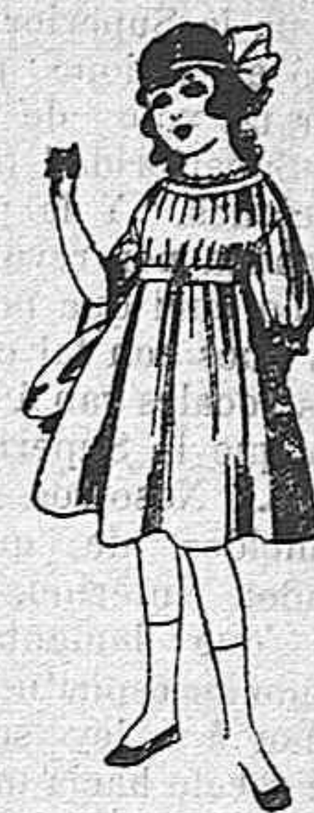
Vestidos de lana, azul, para niñas de 4 á 9 años De pesetas 22 á 25 Los mismos en voile. De pesetas 10 á 17