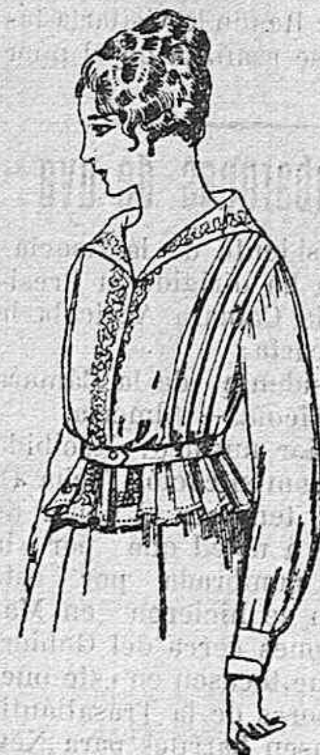
Blusa de voile blanco, bordados blancos, rosa ó azul A ptas. 9