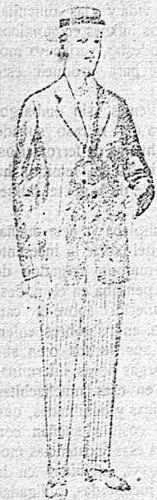
Trajes de lanilla, vicuña, etc., para jovencitos de 10 á 16 años. De pesetas 10 á 56