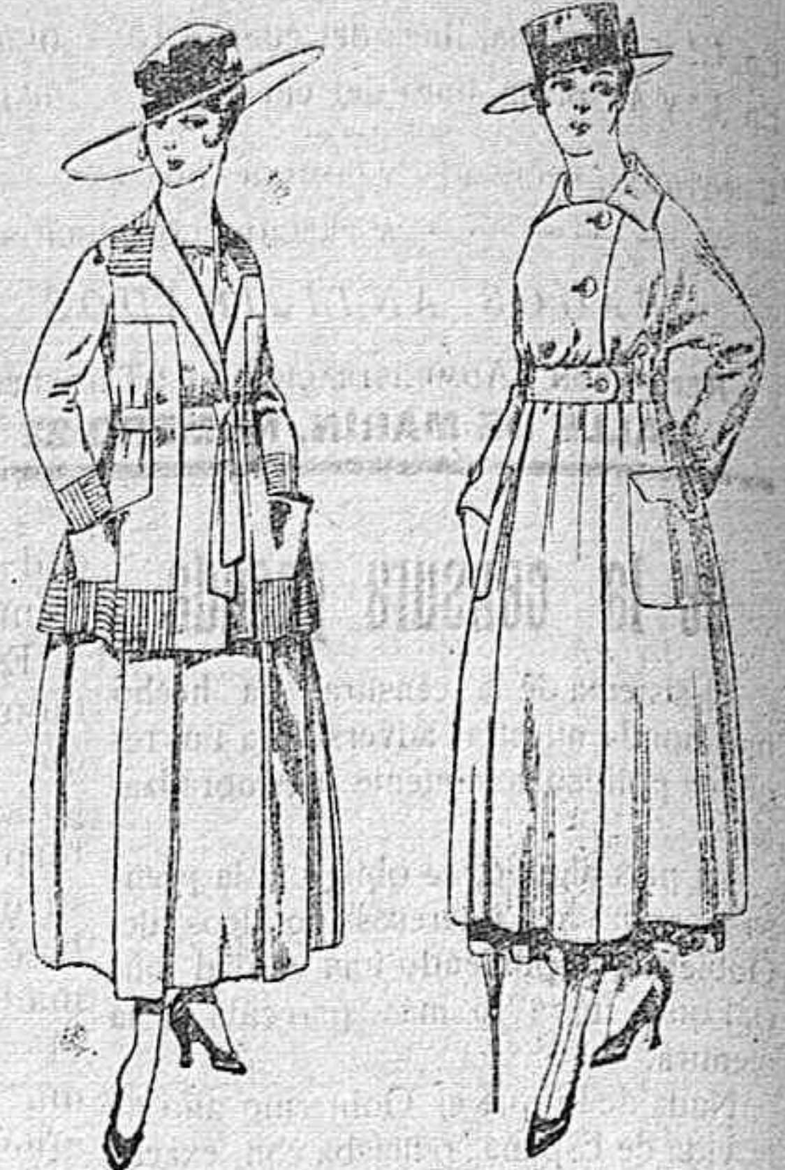
Trajes de lanilla negro, azul, y color, bordado, á pesetas 90.