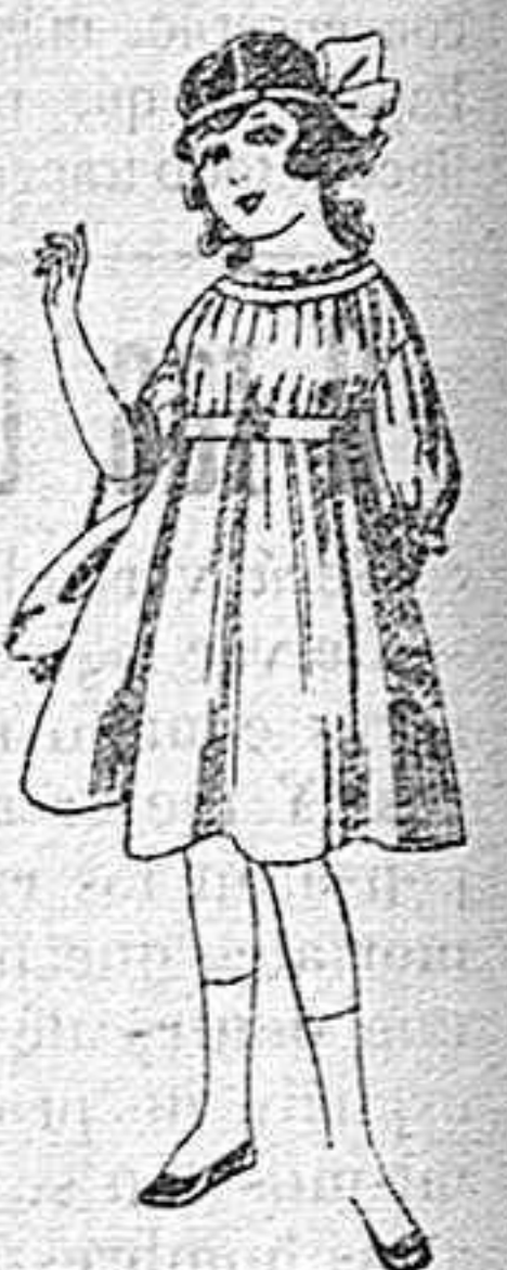
Vestidos de lana, azul, para niñas de 4 á 9 años De pesetas 22 á 25 Los mismos en voile. De pesetas 10 á 17