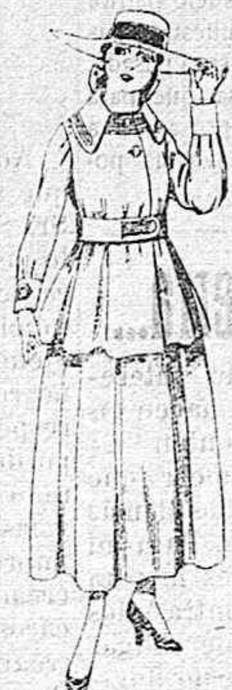
Trajes de lanilla negra, azul y color, para jovencitas de 13 á 16 años.