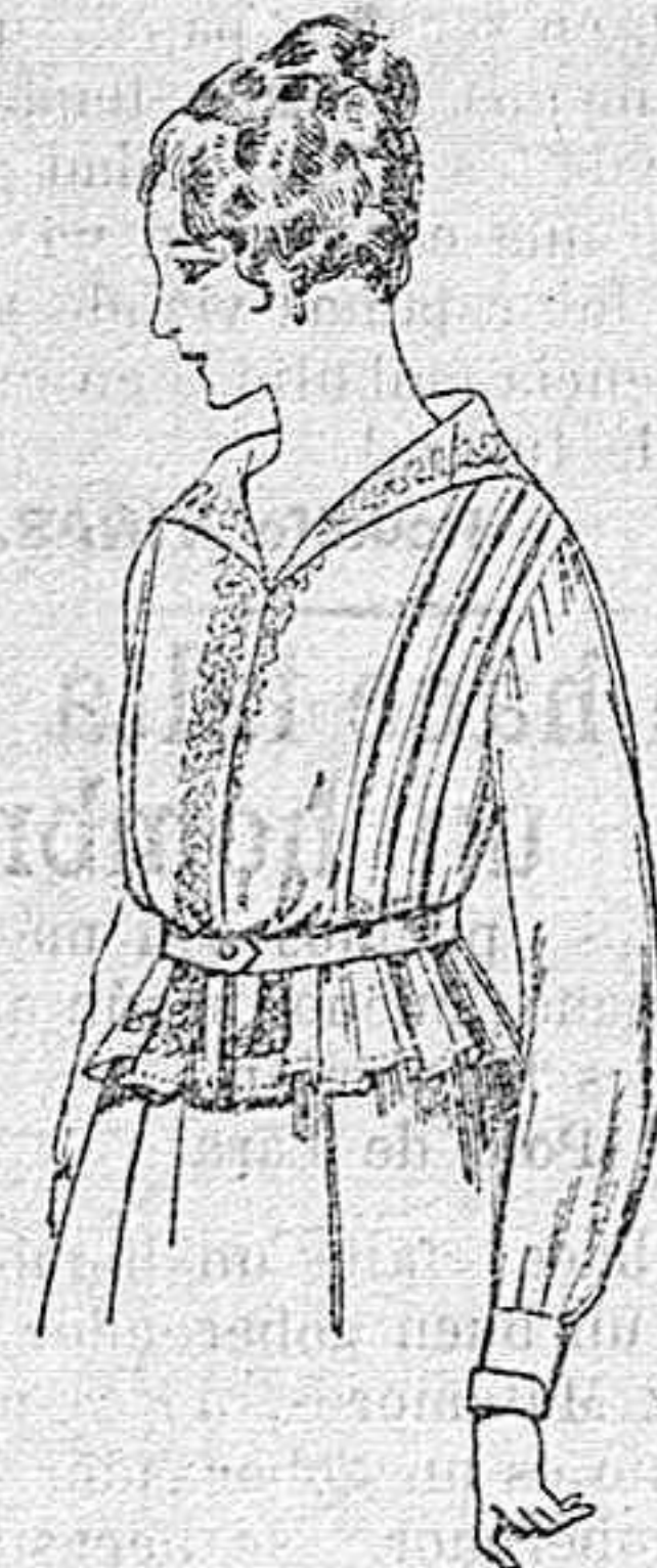
Blusa de voile blanco, bordados blancos, rosa ó azul A ptas. 9