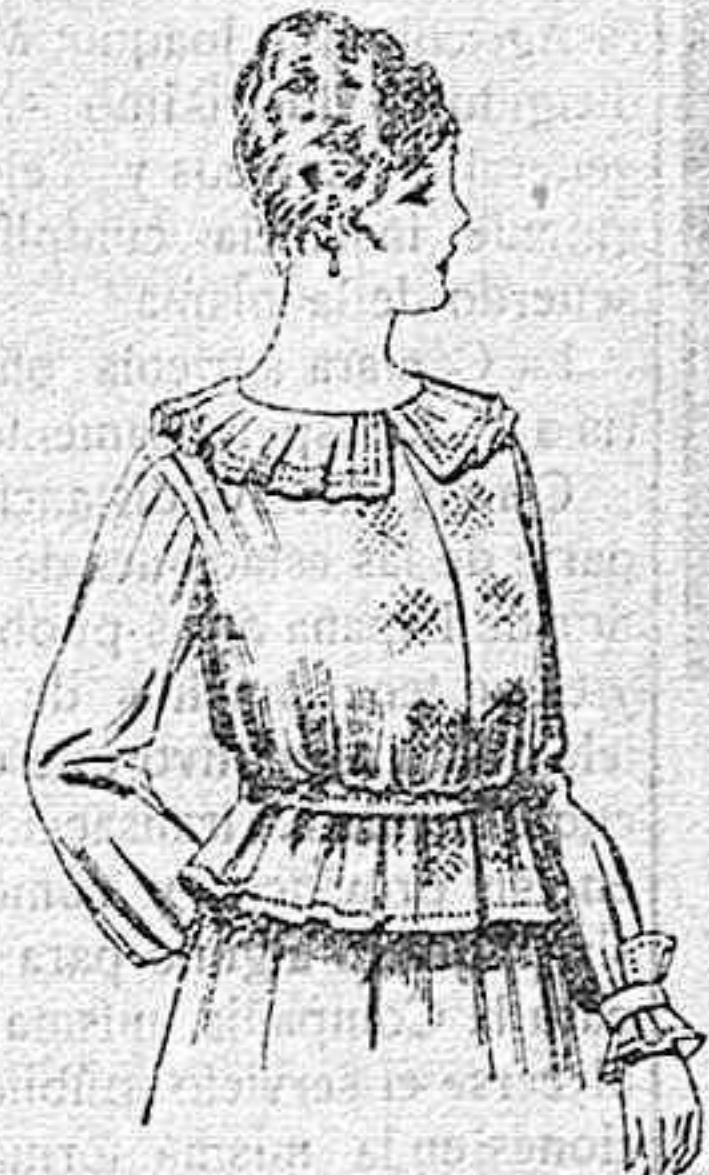
Blusa de crespón ó seda, en negro, azul y color. A ptas. 33.