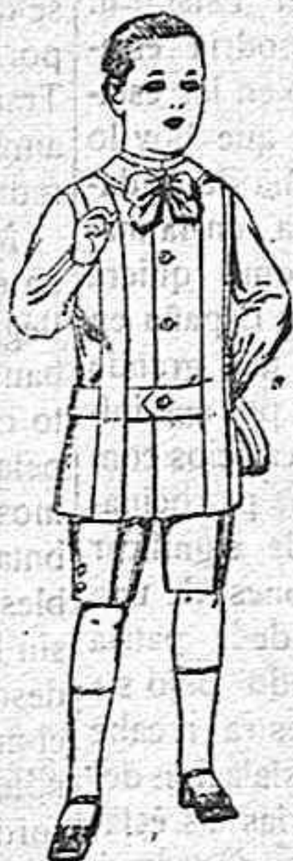
Trajes de lanilla, melton, etc. para niños de 4 á 7 años De ptas. 16 á 33.