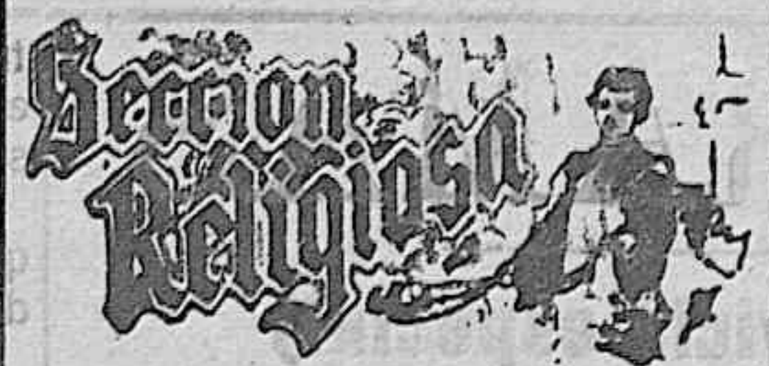
SANTOS PAPA HOY. — Stos. Ra-

Bacalao a la húngara. —Cubrir el fondo de un plato que resista al fuego, con una buena capa de manteca de vaca ó de cerdo, dos cucharadas de vino blanco, perejil picado, pimienta, zumo de limón, y patatas cocidas, cortadas en pedacitos. Colocar sobre este lecho, unos cuantos trozos de bacalao cocido en agua, y sin espinas, espolvoreándolos con queso y pan rallados. Poner el plato al horno ó entre dos lumbres, y servirlos en cuanto la salsa se haya reducido a la mitad