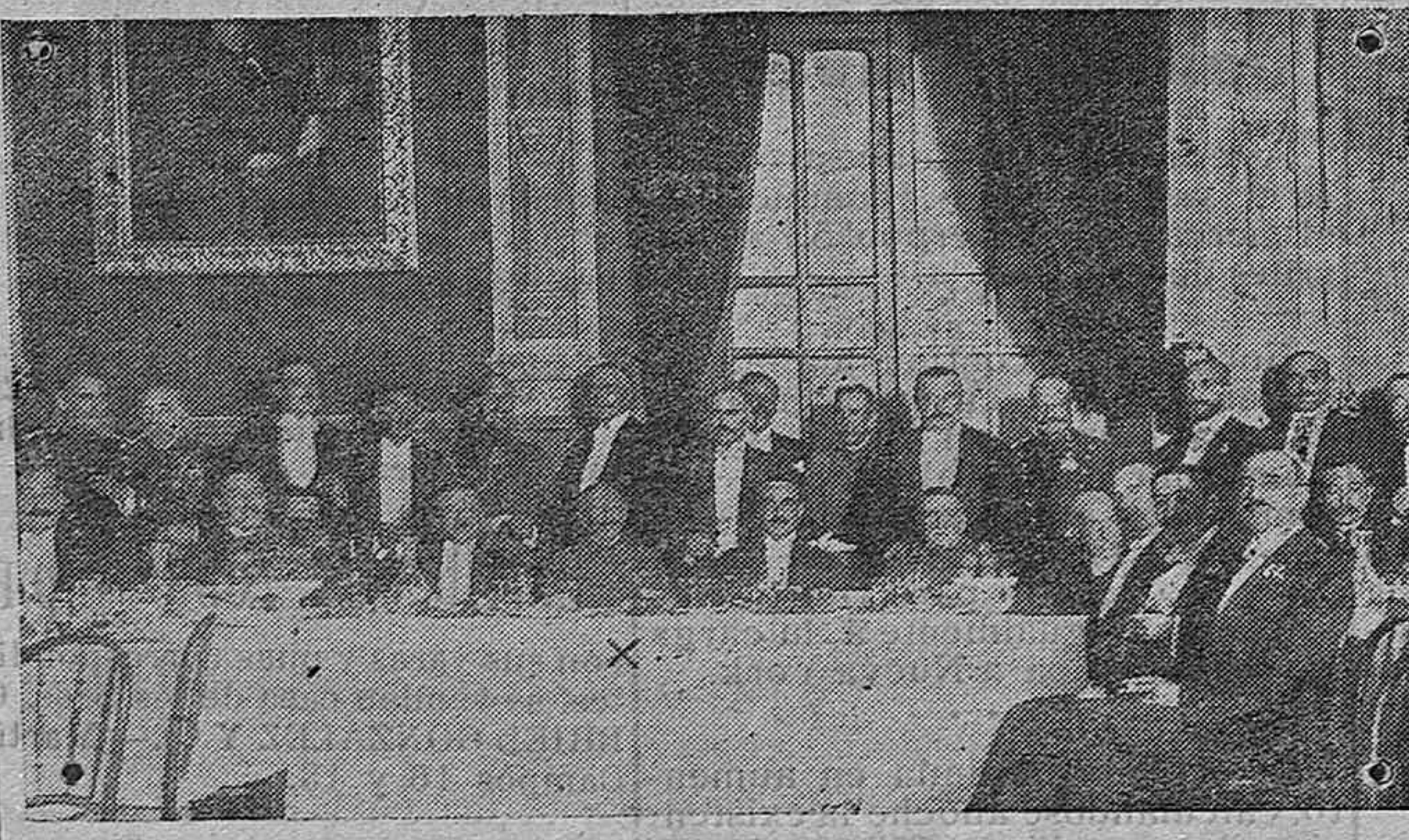
Banquete en el Ayuntamiento, en honor del Capitán General de la región, Sr. Ximénez de Sandoval.

cionados; y que recabe de los Gobernadores civiles la mayor rapidez en la tramitación de los expedientes de expropiación de los terrenos necesarios al efecto. 4.º Que se preceptúe a las compañías de ferrocarriles que en el plazo de un mes estudien y propongan a las divisiones correspondientes, autorizando a estas para que los aprueben, apartaderos en todas las líneas cuando la distancia entre estaciones sea superior a 12 kilómetros. 5.º Que se excite el celo de dichas empresas para aumentar su material de tracción y móvil, a cuyo efecto podrán recibir del Gobierno la debida gestión diplomática sin encontrarse dificultades para su importación. 6.º Que se oficie a los gobernadores civiles para que con la mayor urgencia remitan una relación de los establecimientos fabriles e industriales que radiquen en la provincia de su mando, con el dato de consumo aproximado de carbón que para sus necesidades precisen y. 7.º Que las divisiones de ferrocarriles cuiden del más exacto cumplimiento de las disposiciones que anteceden e informen a este Ministerio sobre la conveniencia de suspender su aplicación cuando la normalidad del tráfico lo aconseje.