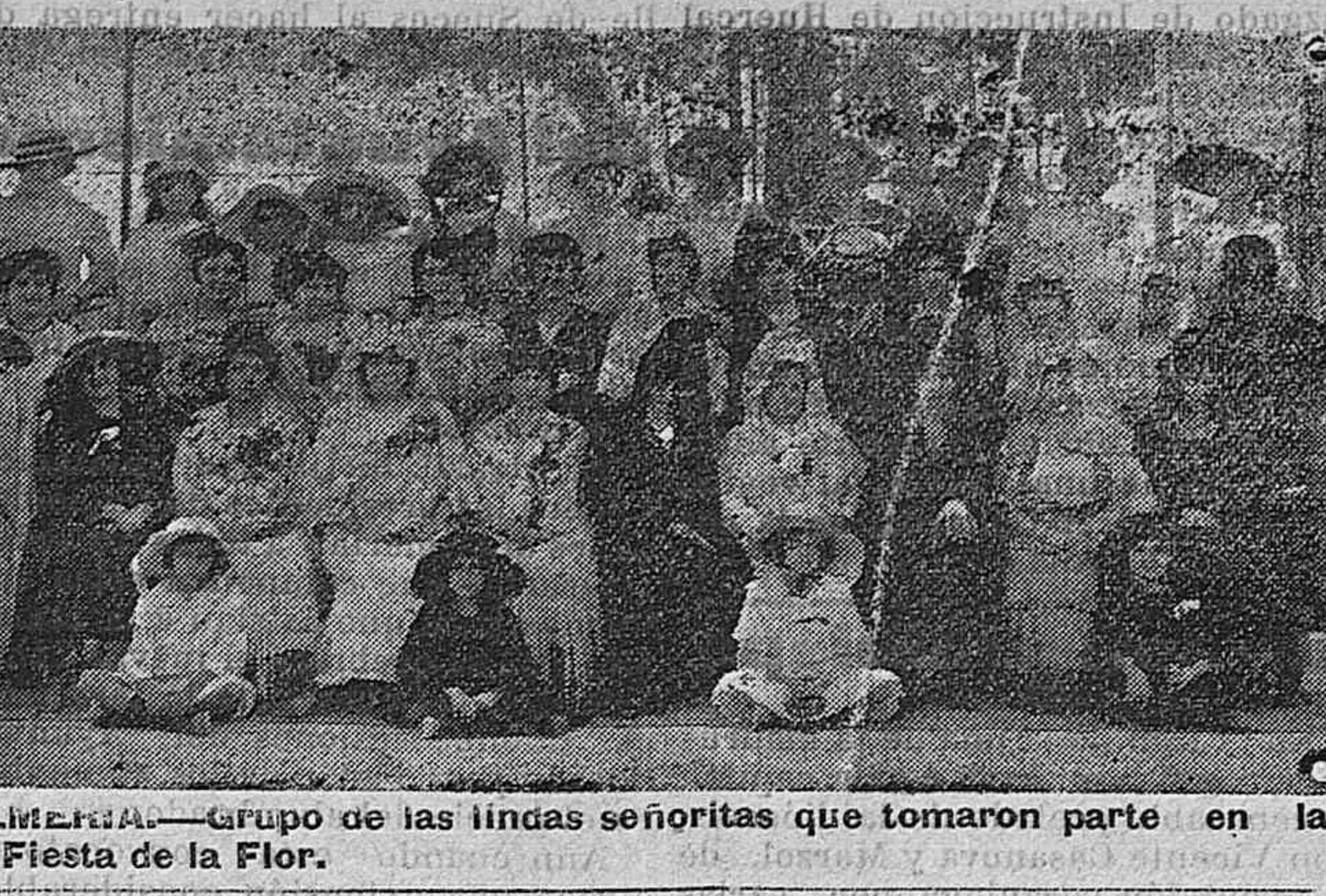
ALMERIA.—Grupo de las lindas señoritas que tomaron parte en la Fiesta de la Flor.