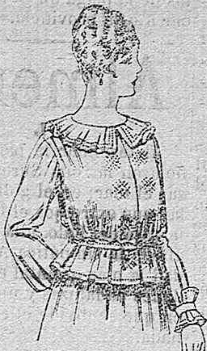
Blusa de crespón ó seda, en negro, azul y color. A ptas. 33.