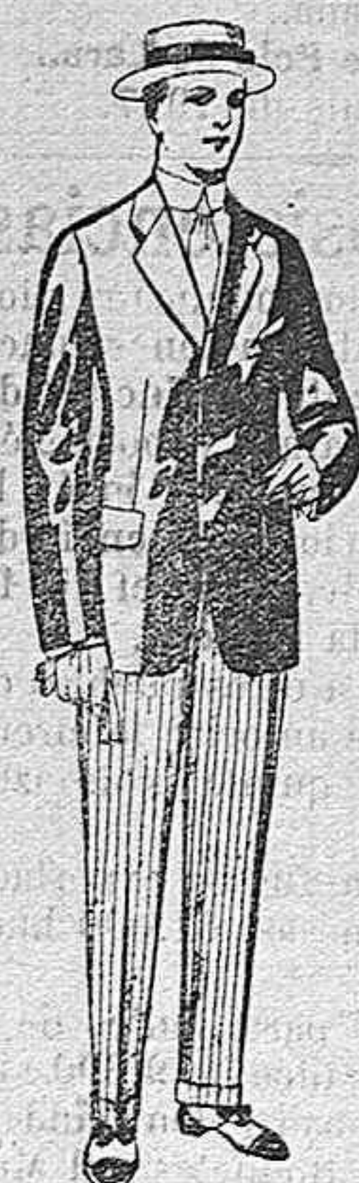
Trajes de lanilla, vicuña, etc., para jovencitos de 10 á 16 años. De pesetas 10 á 56