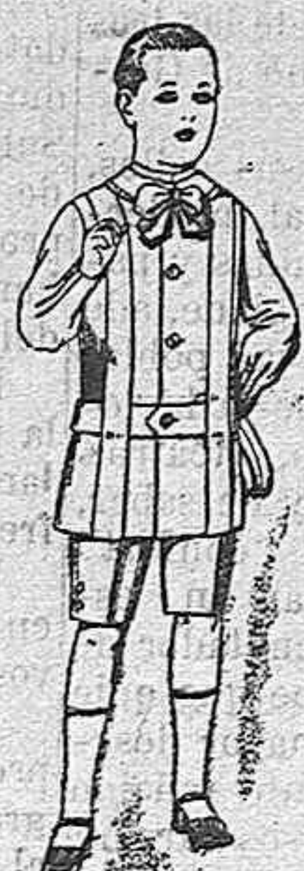
Trajes de lanilla, melton, etc. para niños de 4 á 7 años. De ptas. 16 á 33.