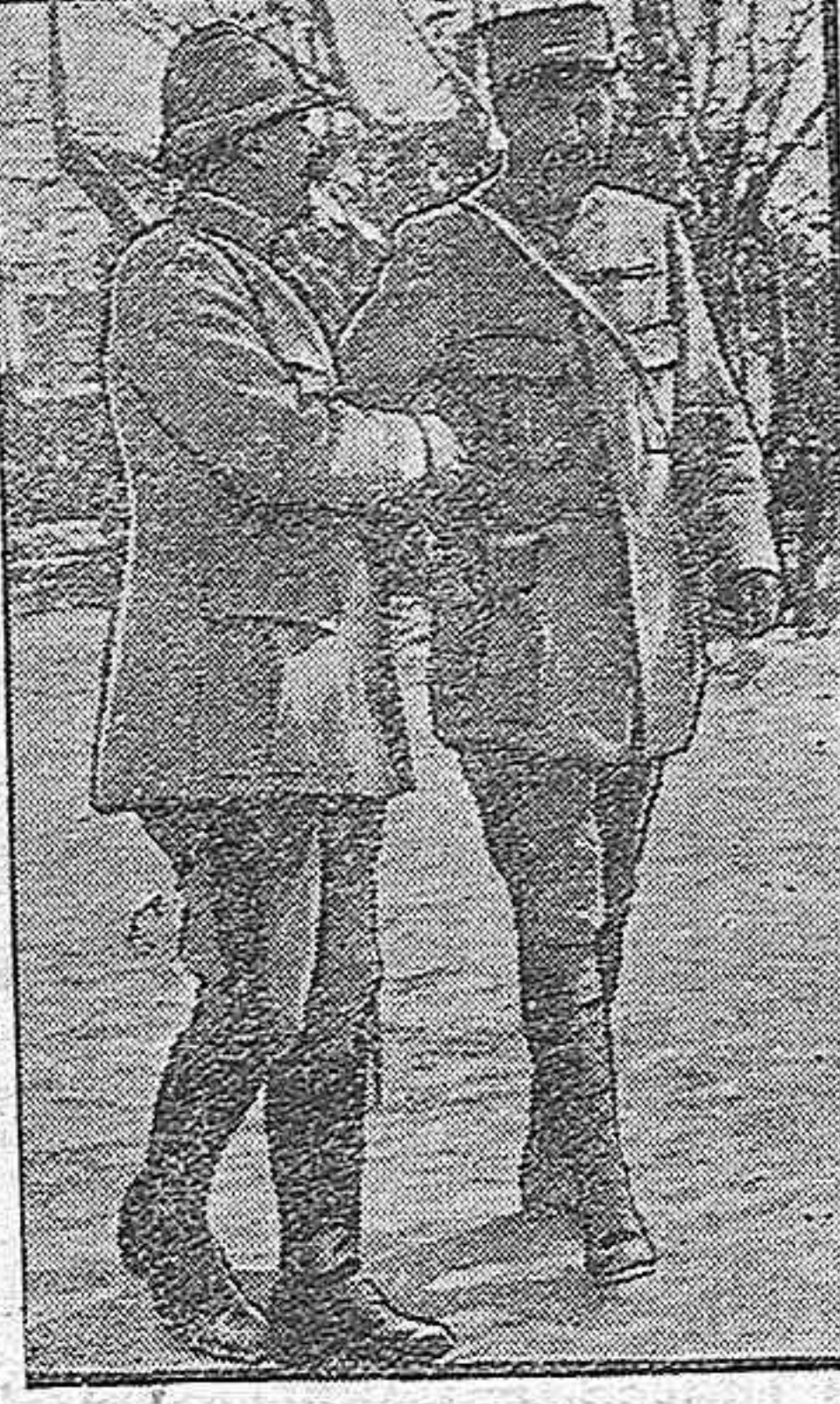
Los generales Duchane y Herschaner