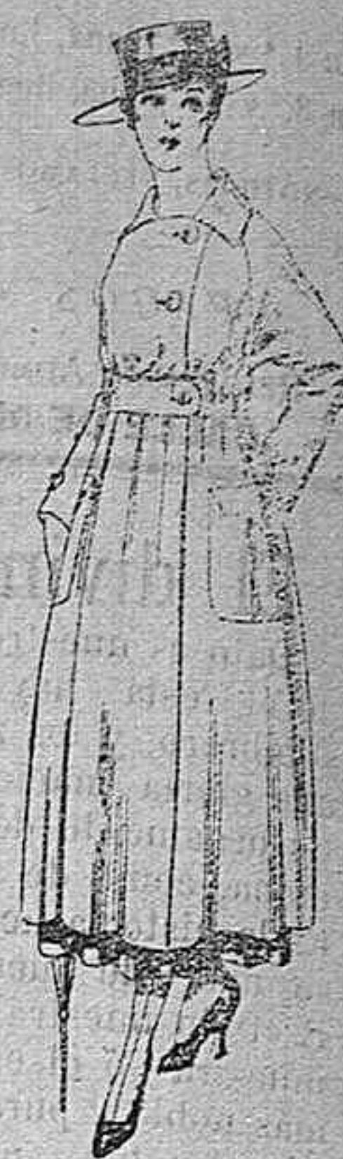
Vestido de estambre negro, azul y colores bordado. De peseta 64 á 75