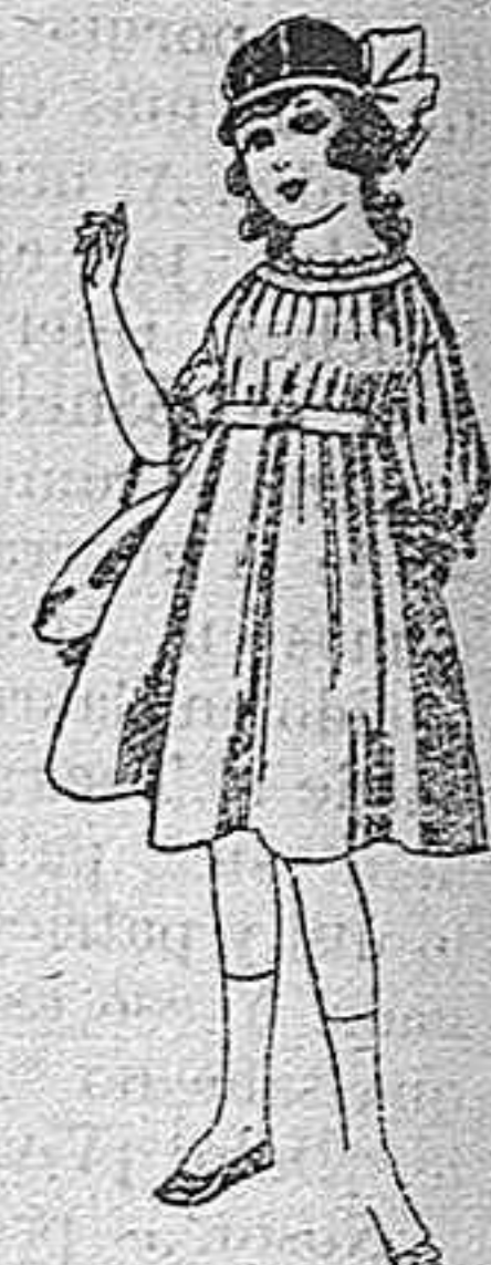
Vestidos de lana, azul, para niñas de 4 á 9 años. De pesetas 22 á 25. Los mismos en voile. De pesetas 10 á 17