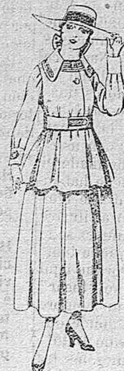
Trajes de lanilla negra, azul y color, para jovencitas de 13 á 16 años.