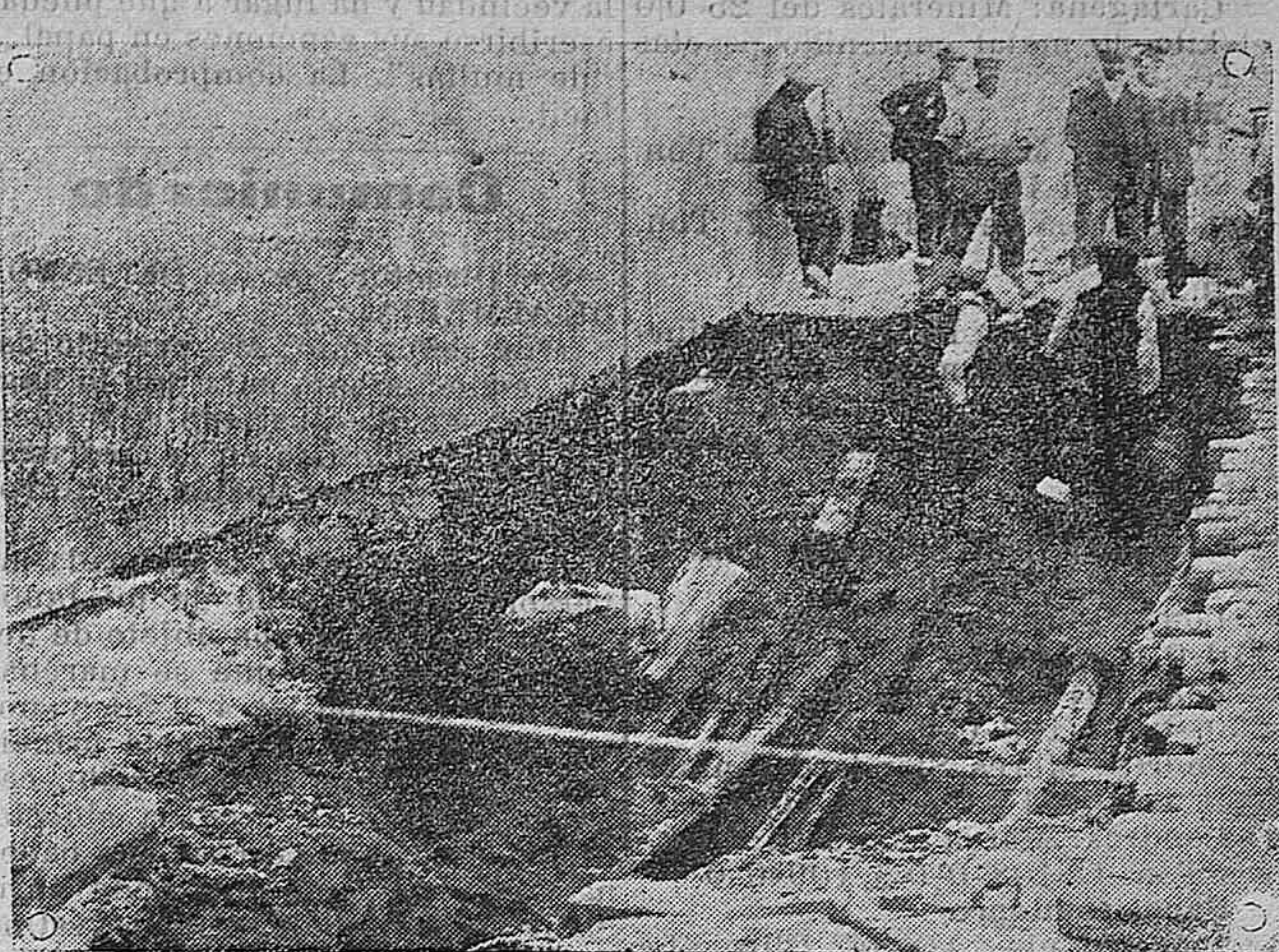
Madrid.—Hundimiento recientemente ocurrido en el Postigo de San Martín.—(Fot. Cervera).

EL DEFENSOR DE ALMERIA hállase de venta en Granada, en "La Prensa", acera del Casino.