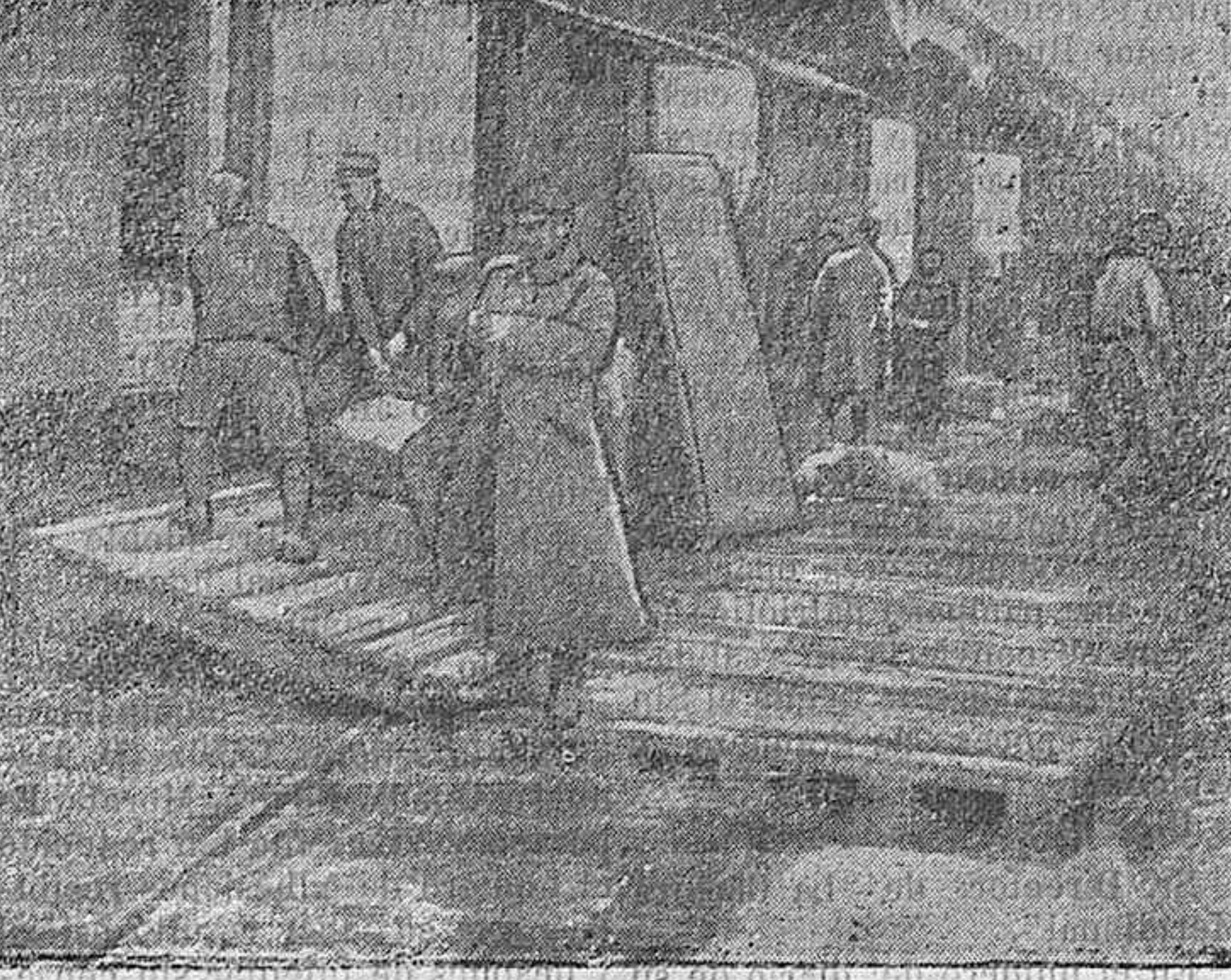
Fot. Información. Prisioneros alemanes descargando un vagón