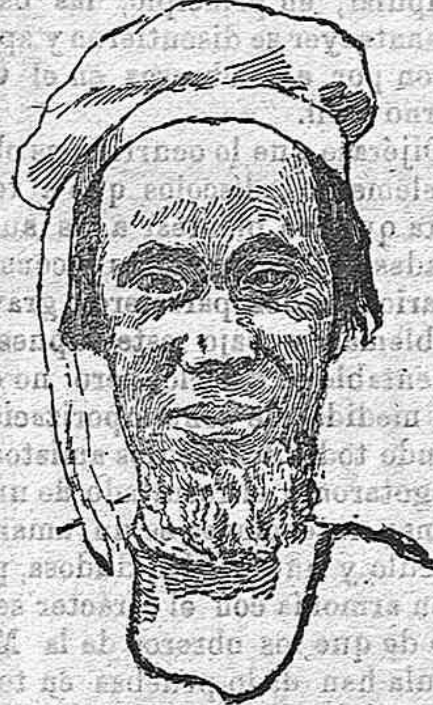
El Morabito Azul.