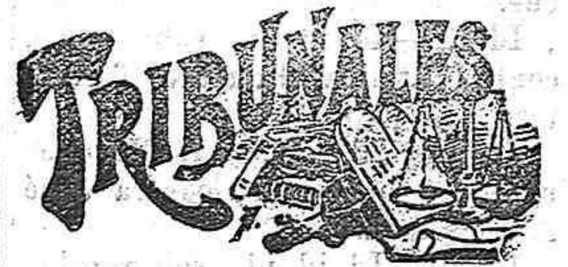
Alarde de causas.

Se hallan de venta en todas las farmacias al precio de cuatro pesetas la caja ó veintuna pesetas las seis cajas.