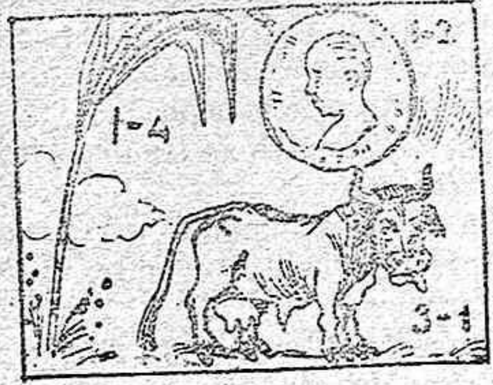
(La solución mañana).