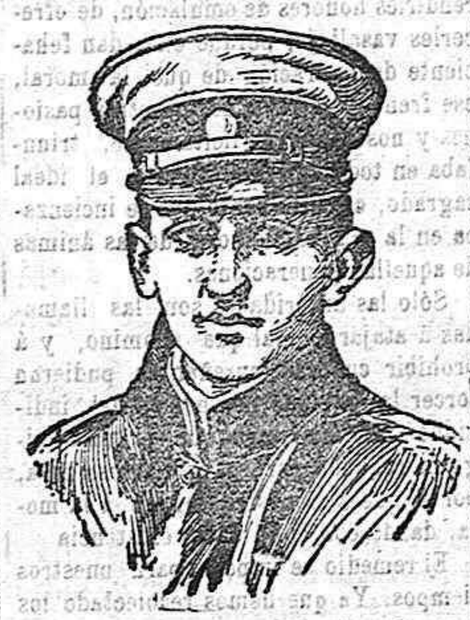
El príncipe Jorge de Serbia.

Alejado de la Corte el príncipe Jorge y declarado heredero de la corona su hermano Alejandro, el rey Pedro creyó en un largo período de tranquilidad y de ventura, pero su mala estrella no lo ha querido así.