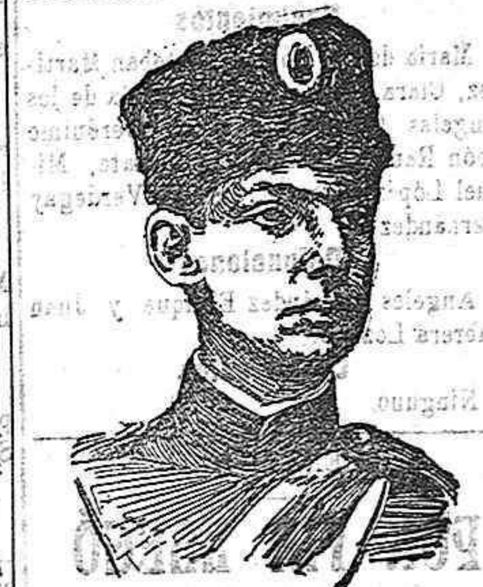
El príncipe Alejandro de Serbia.

Según sus partidarios, muy abundantes en las filas del ejército y del nacionalismo, en caso de que muera su hermano Alejandro, el príncipe Jorge volvería a ser el heredero del trono porque nadie podría disputarle la corona. Efectivamente, él renunció sus derechos al trono, pero fué a favor de su hermano, luego fallecido éste sin sucesión; él y nada más que él, puede ser el heredero.