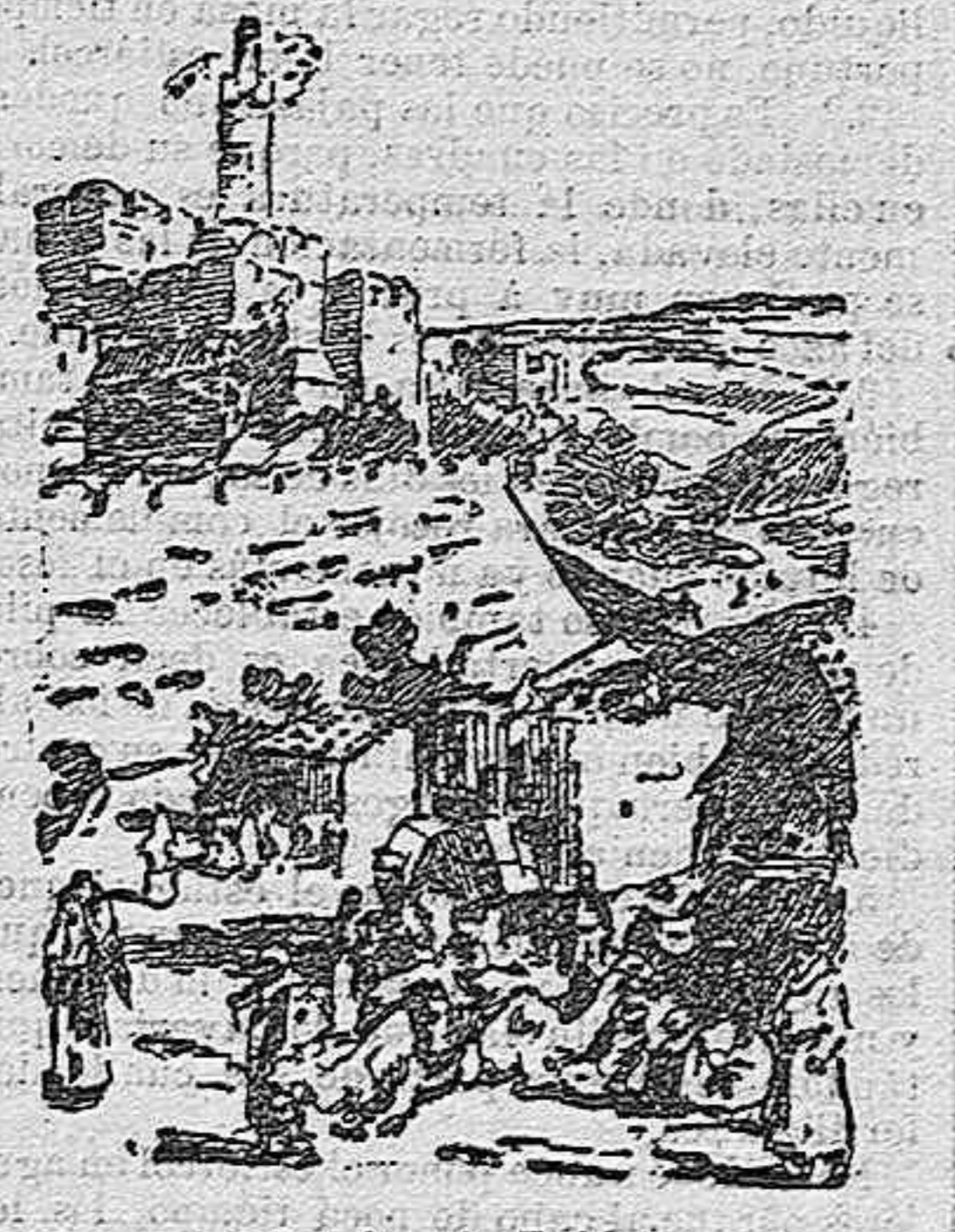
Camino de Belén

En el camino de Jerusalén a la cima de la Cristiandad, llano y polvoriento, unas veces, montuoso y quebrado, otras, y siempre árido, salvo en las cercanías de Belén, mil monumentos y lugares nos hablan de infinitas tradiciones y de hechos registrados en las Sagradas Escrituras, tales como la fortaleza de Sión, cantada en los Salmos; los pozos de Jacob,