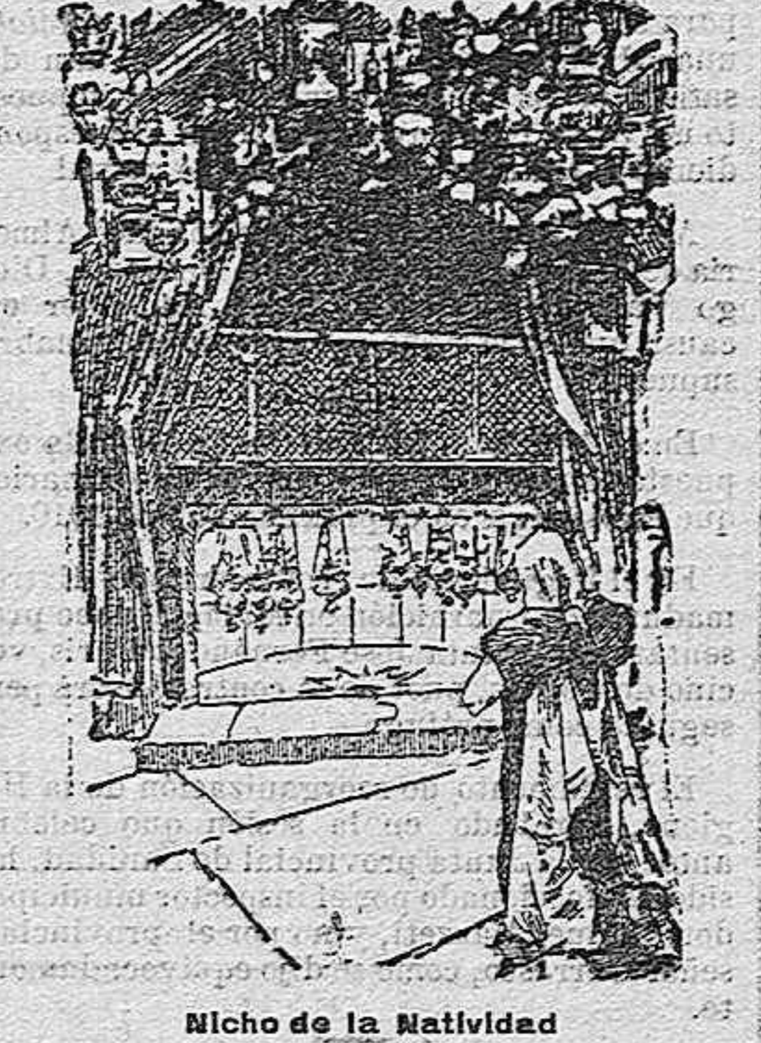
Nicho de la Natividad

A la derecha del coro hay otra escalera que también conduce a la gruta. Desde el exterior de este santuario, se divisa Bet-Saur, la Aldea de los Pastores, a quienes apareció el ángel anunciando la venida del Redentor, y no lejos de ella se hallan las ruinas del monasterio levantado sobre el lugar en que se verificó la aparición y la gruta que en él existe.