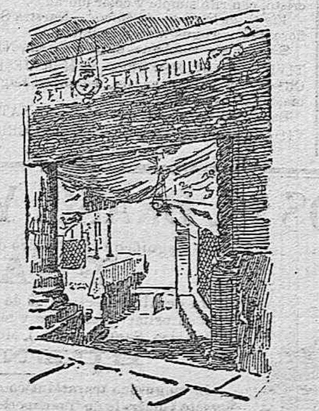
El Nicho del Pesebre

donde éste fué abandonado; el siniestro valle de Gehena, en el que el dios Moloch devoraba niños vivos; el monte del Mal Consejo, en una de cuyas cimas existía la quinta de Caifás donde se decidió la muerte de Jesucristo; el Campo de la Sangre, comprado con el dinero de la traición de Judas para cementerio de extranjeros; el pozo de los Reyes Magos y otros mil lugares, porque en todo este camino,