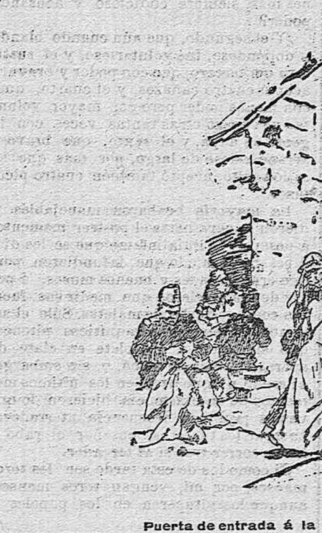
Puerta de entrada a la Basílica de la Natividad

ticas de él el brillante verdor de las viñas de que se obtiene el más exquisito vino que se produce en Oriente. Al sur, como cabalgando sobre extraña loma, se descubre Betlehem, una conglomeración de casas de arquitectura oriental, blancas y nenas, reñegidas otras por la acción del tiempo, y todas coronadas por la tradicional azotea, y en el centro, a levantar la cadena de oro y amatistas de los montes Moab, a cuyos pies corre el Jordán y el Mar Muerto. Penetrando en la ciudad por la parte de Jerusalén, nos encontramos en una calle estrecha y tortuosa, que corta a Belén en casi toda su longitud. A su final, esta vía enlaza con una plaza oblonga que a su vez, desemboca en una esplanada, que es el antiguo atrio de la basílica que la emperatriz Santa Elena mandó construir en el siglo IV en los lugares del Nacimiento, que dos siglos antes profanó el emperador Adriano haciendo en ellos un bosque dedicado a Adonis y a Venus. Próxima a la explanada se infanta un parterre con tumbas blancas, cerrando