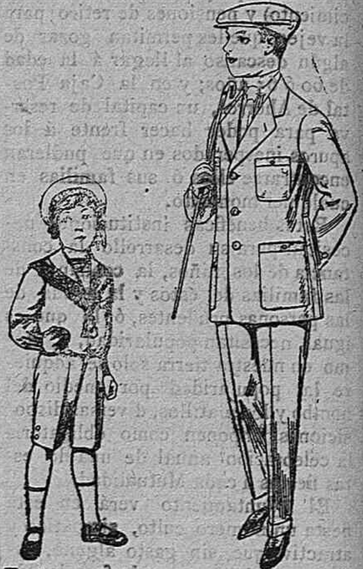
Trajes marinera de vicuña azul, para niños de 4 á 9 años. Pt. 6 á 26 Trajes modelo Sport de dril listado para jovencitos de 10 á 16 años. De pesetas 11 á 17