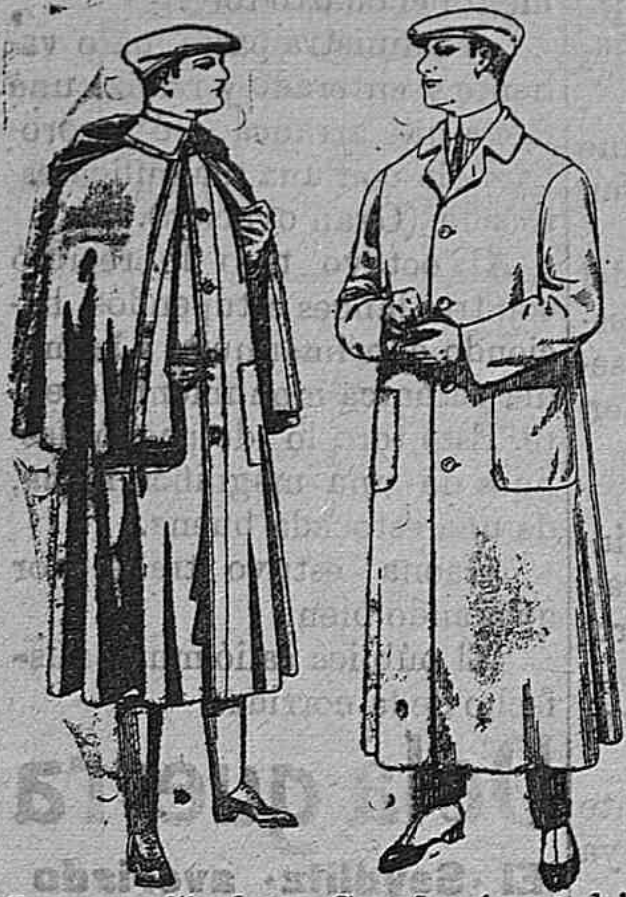
Impermeables forma Guardapolvos de dril mackferland en negro y azul De pesetas 55 á 100 De pesetas 6 á 11

Gran exposición de artículos para la temporada