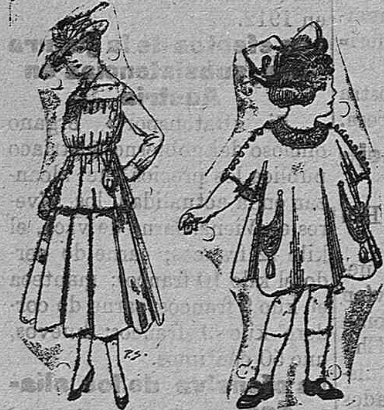
Trajes de lanilla Vestidos de lanilla para para jovencitas de niñas de 4 á 9 años 13 á 19. Pt. 50 á 55 De pesetas 30 á 38