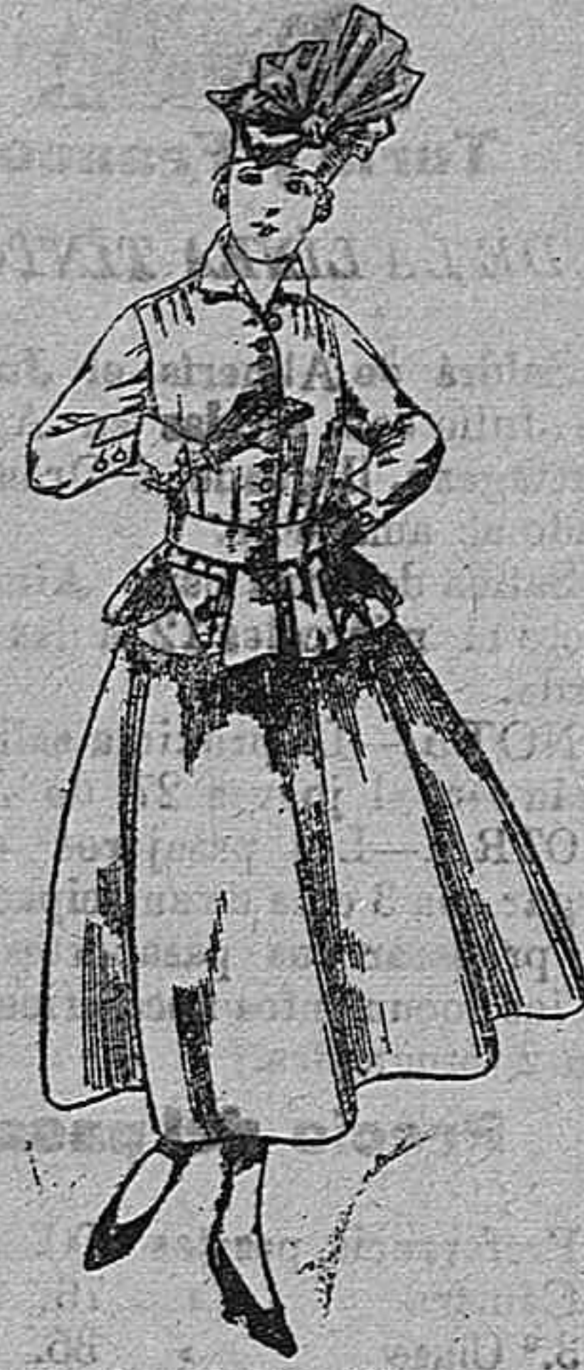
Trajes de lanilla negra, azul y color A pesetas 70