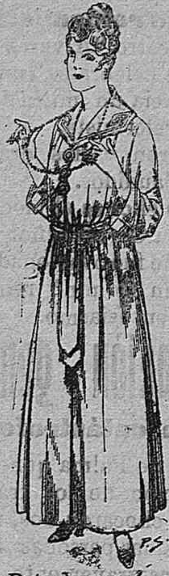
Bata de crepón color, cuello bordado De pesetas 6 á 11