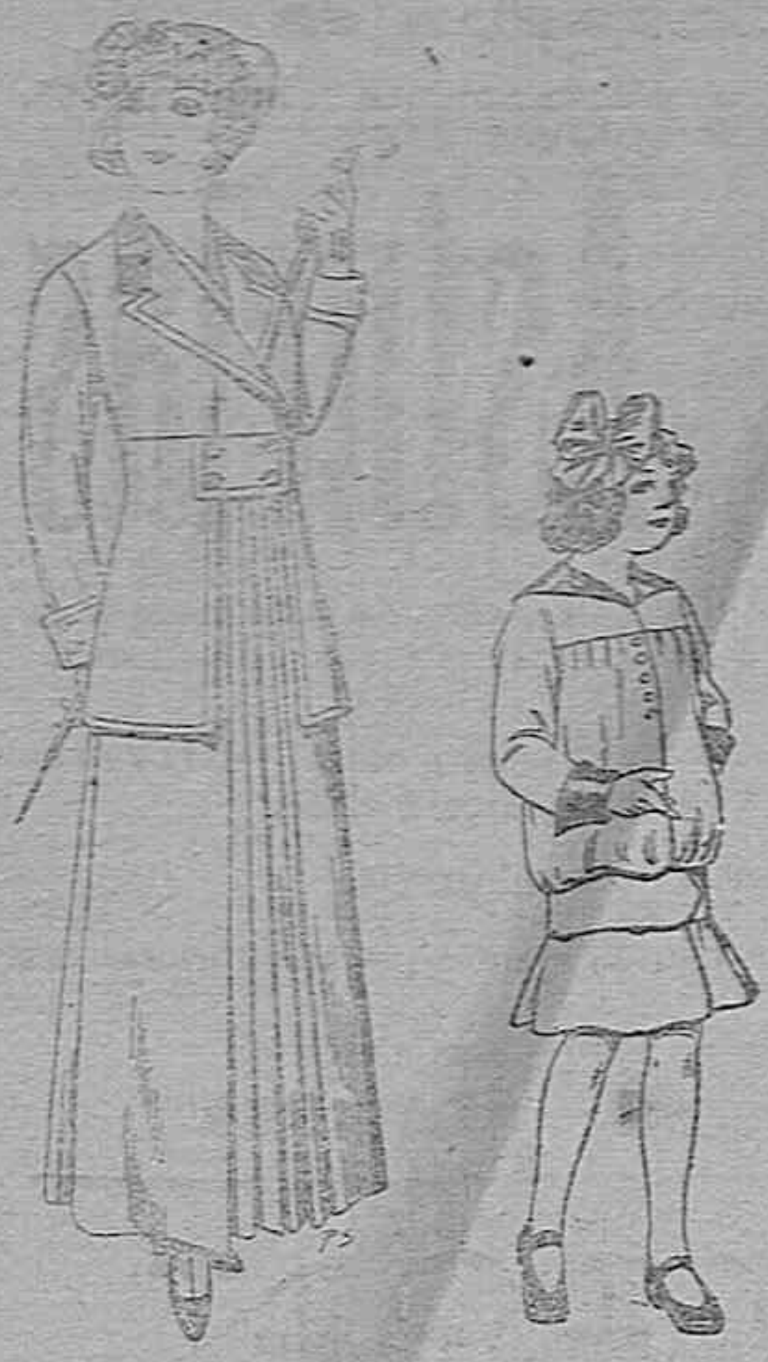
Trajes de lana ne- gra azul y color pa- ra señora. A pta. 70 Vestidos de la- nilla para ni- ños de 4 a 22 años. De pese- tas 12 a 20

Madrid.-Barcelona.-Alicante.-Al- mería.-Bilbao.-Cádiz.-Cartagena. Gijón.-Granada.-Málaga.-Palma de Mallorca.-Santander.-Sevilla. Valencia.-Valladolid.-Zaragoza.