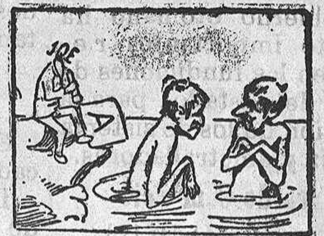
La solución mañana.