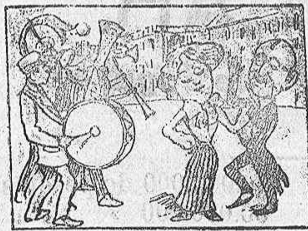
La solución mañana.