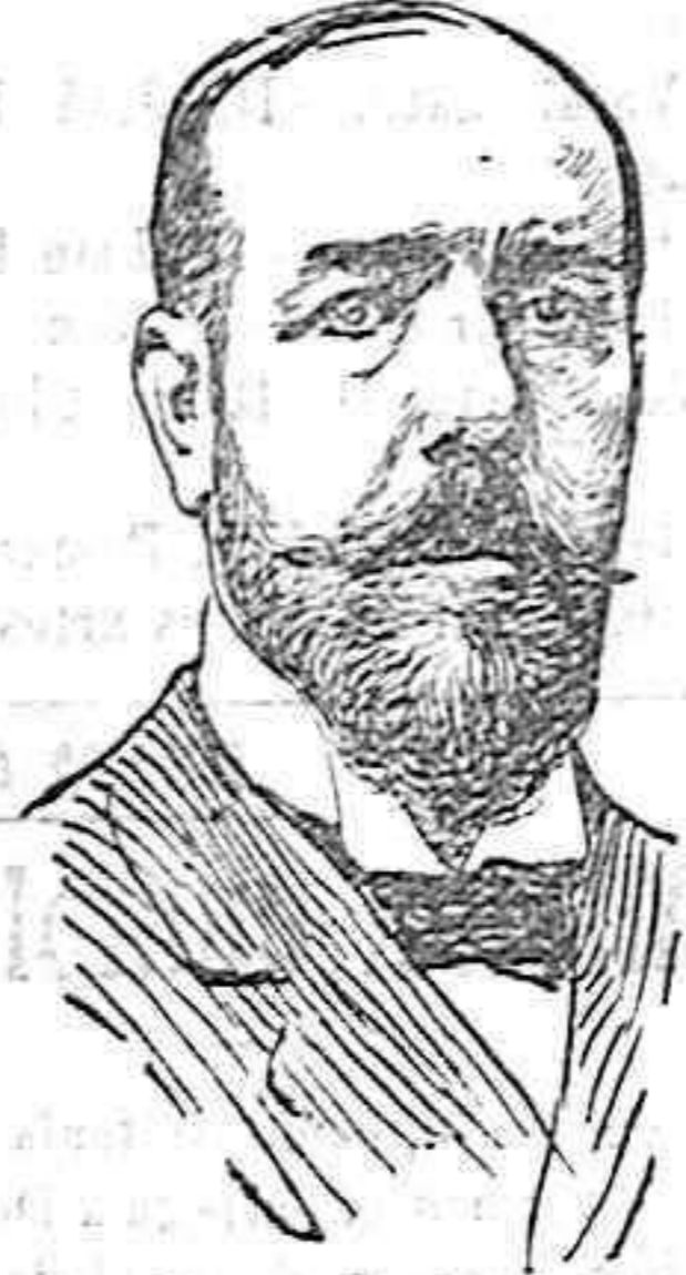
Don Cirso Rodríguez, nuevo Gobernador del Banco de España