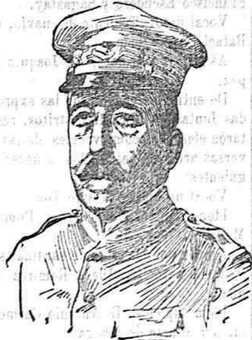
El general Covar, nuevo Subsecretario de Guerra.