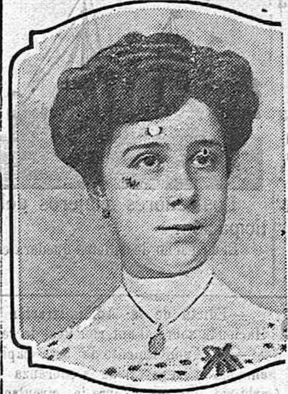
STA. CATALINA BARAONA.

A las personas que están pálidas y débiles y que al parecer carecen de sangre, no hay más que decirles una cosa: «Su palidez y su debilidad proviene de que no tiene usted bastante sangre y no estará usted bien hasta que tenga suficiente sangre: entonces, sólo entonces, poseerá usted buen olor, se sentirá usted fuerte, tendrá apetito y sacará provecho del sustento.» ¿Qué haremos para tener sangre? nos direis. A esto os contestaremos: si habeis oido hablar de algún medicamento que dé sangre, que dé fuerzas más rápidamente que lo hacen las Píldoras Pink, tomado al momento. Pero si no es así, escuchadnos y para formar vuestra opinión, leed lo siguiente: