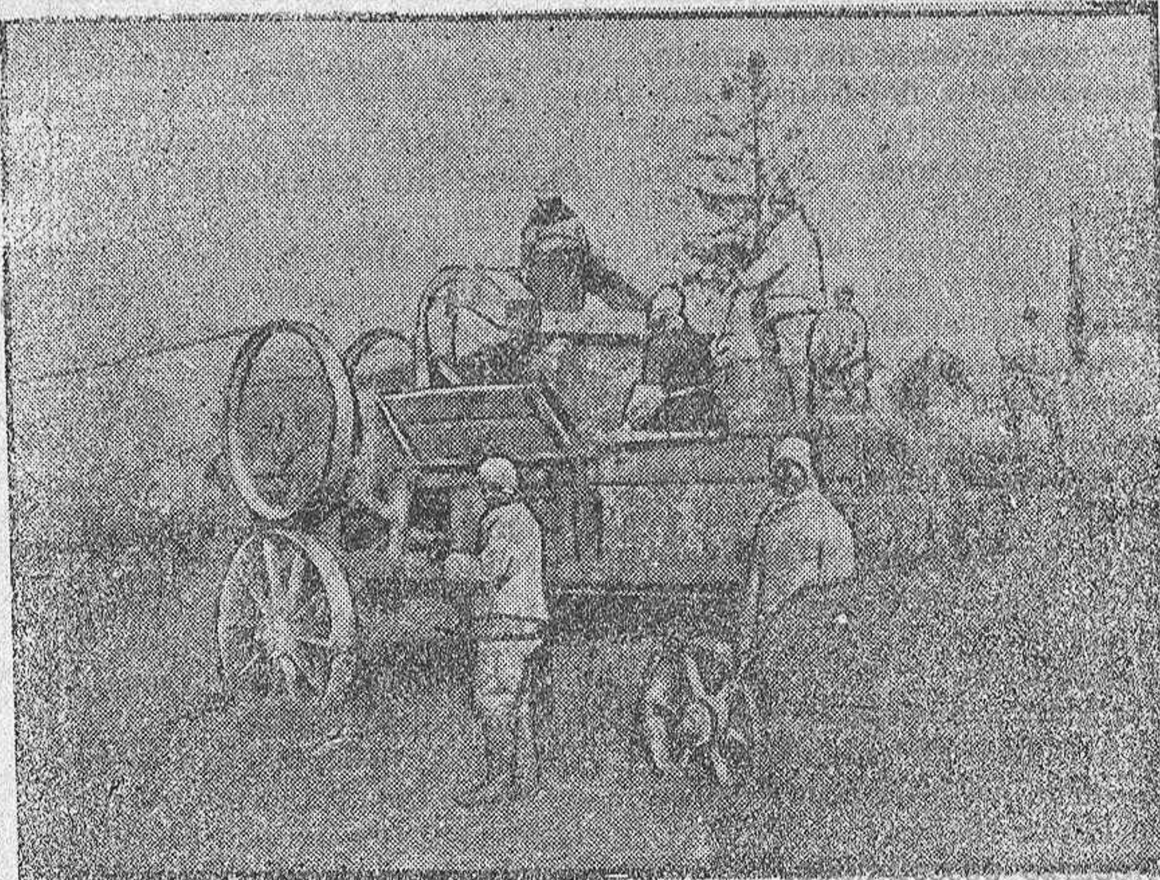
En la segunda línea francesa.—Soldados trillando