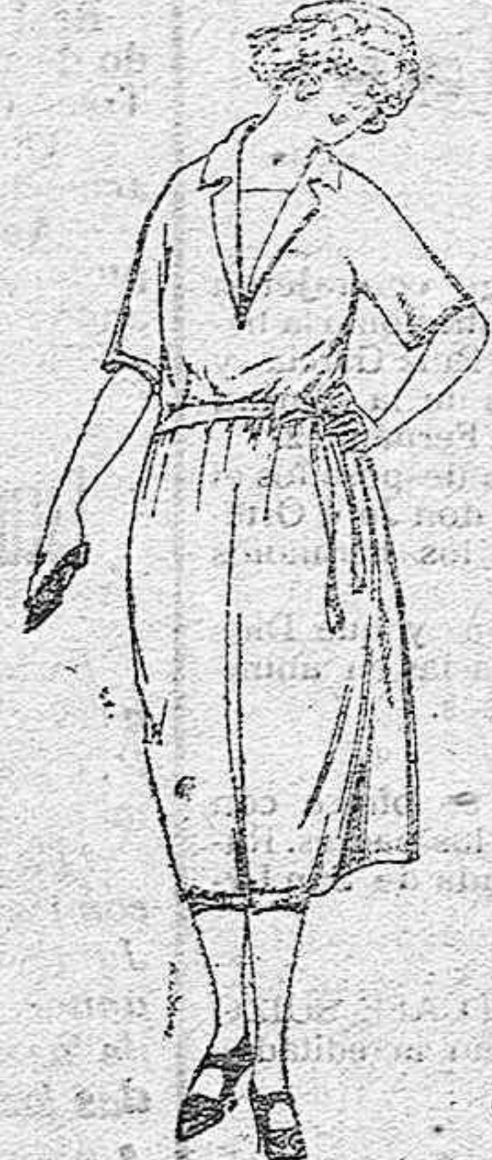
Vestidos de punto de seda, en negro, azul y color de ptas. 180 a 230.