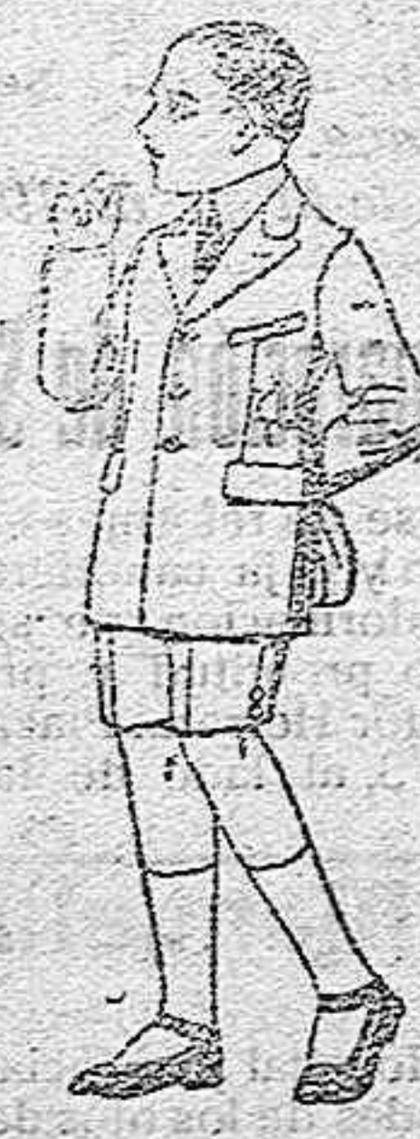
Trajes modelo «Sport», de lanilla, estambre, melton etc., para niños de 7 a 12 años de 28 ptas. a 50. Trajes delantal de dril crudo o kaki, para niños de 3 a 7 años ptas. 9 a 15