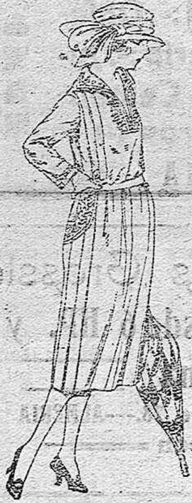
Vestidos de gabardina, sarga inglesa, etc., en negro, azul y color, adornos bordados, ptas. 110 a 130.