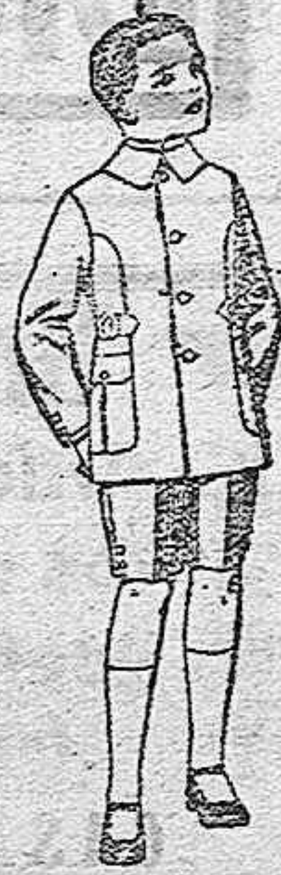
Trajes modelo «Sport», de lanilla, estambre, melton, etc., para niños de 4 a 9 años, de ptas. 30 a 48. Trajes de dril liso o listado de ptas. 9 a 18.