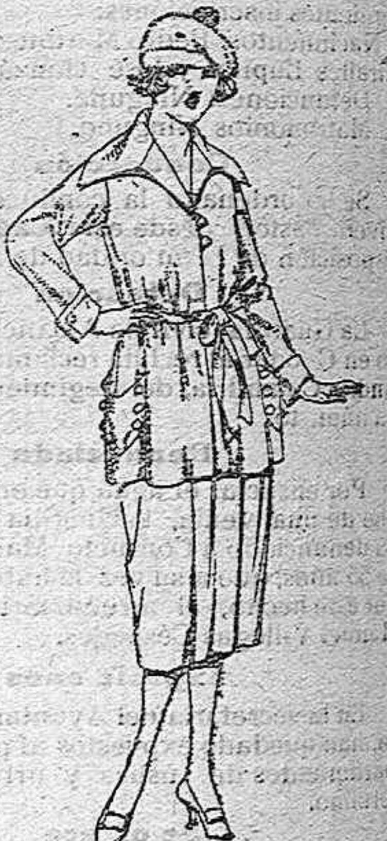
Paletots de tricot de seda, en negro azul y color, de ptas. 55 a 198