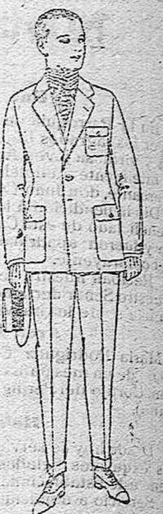
Trajes de dril crudo, kaki o listado, de pesetas 22'50 a 60. El mismo modelo en estambre «fresco» de ptas. 50 a 140.