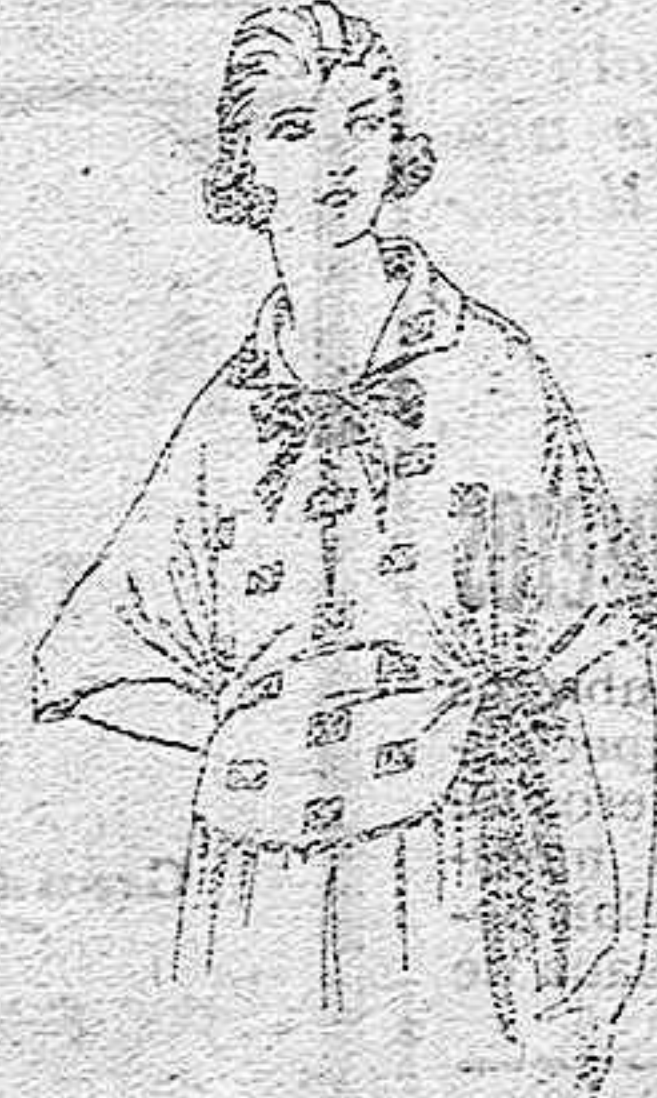
Blusas de crepón de seda, voile y etamin estampado de ptas. 4 a 25.