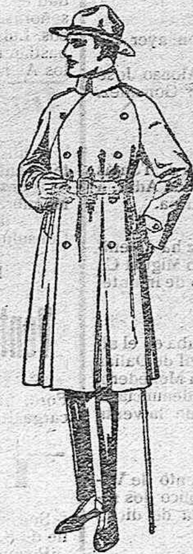
Gabanes impermeabilizados con cinturón «American trench coat» de ptas. 200 a 350.