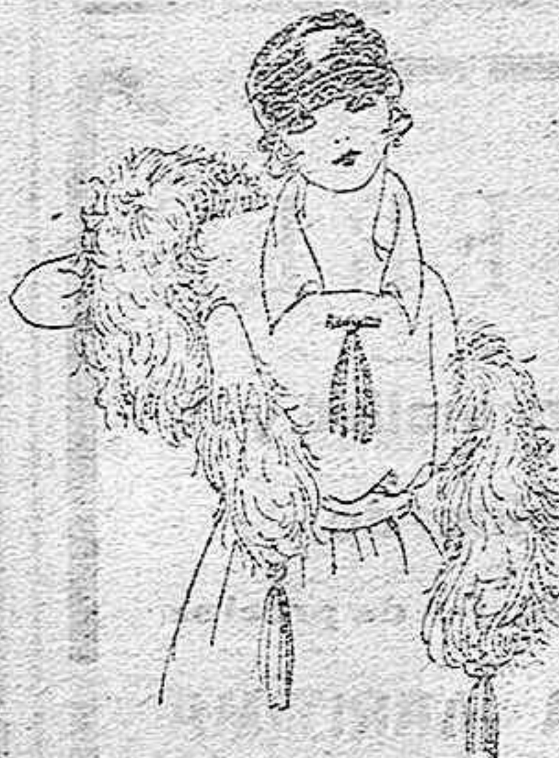
Boas de plumas avestruz, gran variedad en colores y tamaños, de ptas. 15 a 125. Gran surtido en capelinas de marabú, de ptas. 30 a 70.