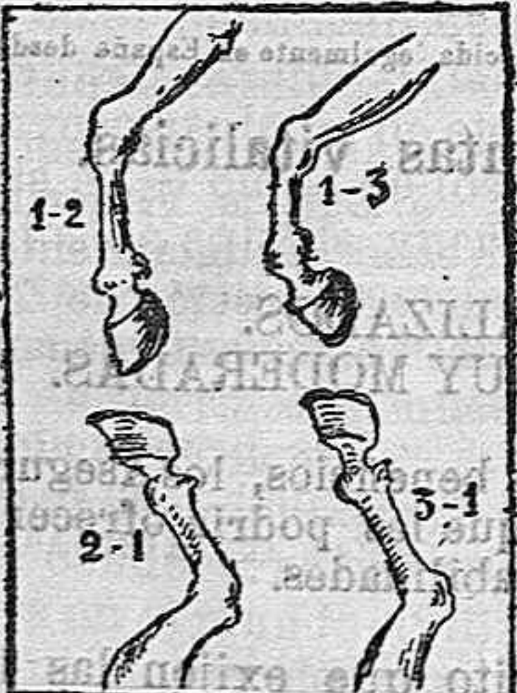
(La solución mañana).