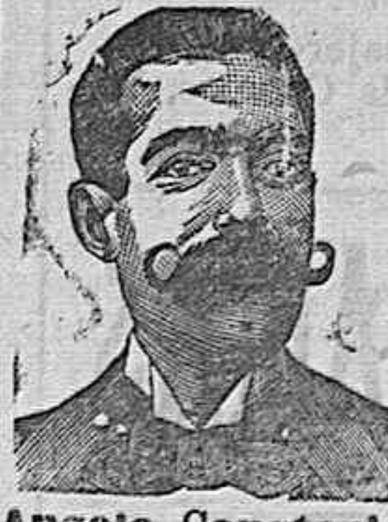
Angio Costanzi Diputación 435.—Barra

Unicos agentes en España: J. URIACH Y C.—BARCELONA.