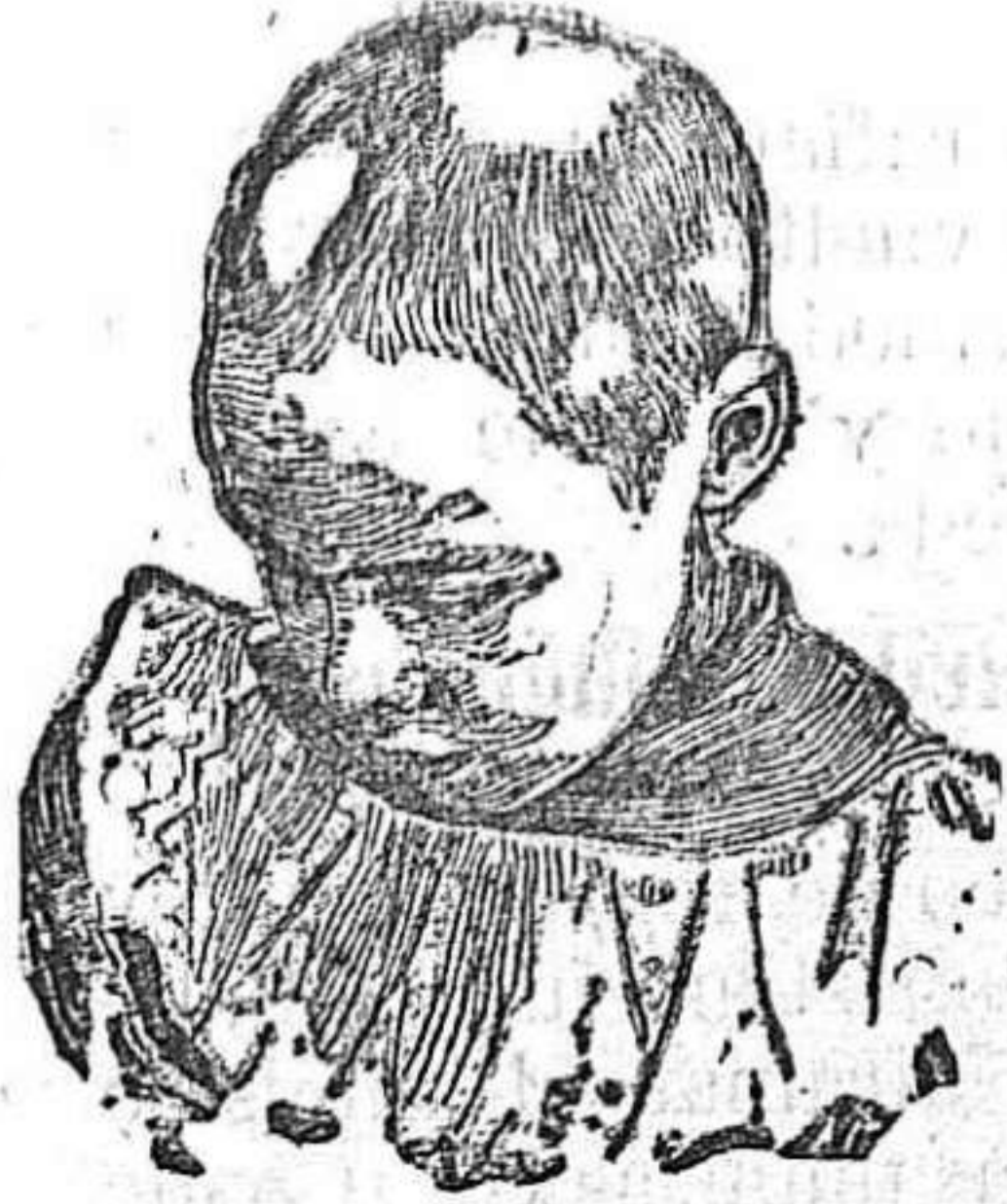
Antes de usar el Capilhol.