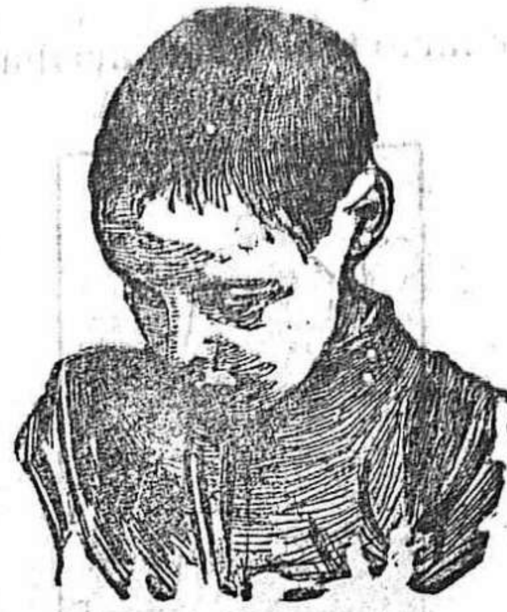
Después de usar el Capilho

Serrín de corcho. Duelas de roble. Madera de pino. Arcos catalanes. Sulfato de cobre. Sulfato de hierro. Sulfatadoras. Azufre sublimado y molido Alambre para parrales. PRECIOS ECONOMICOS. Thomas Morrison y Cia. Ld. Calle Pescadores 1.