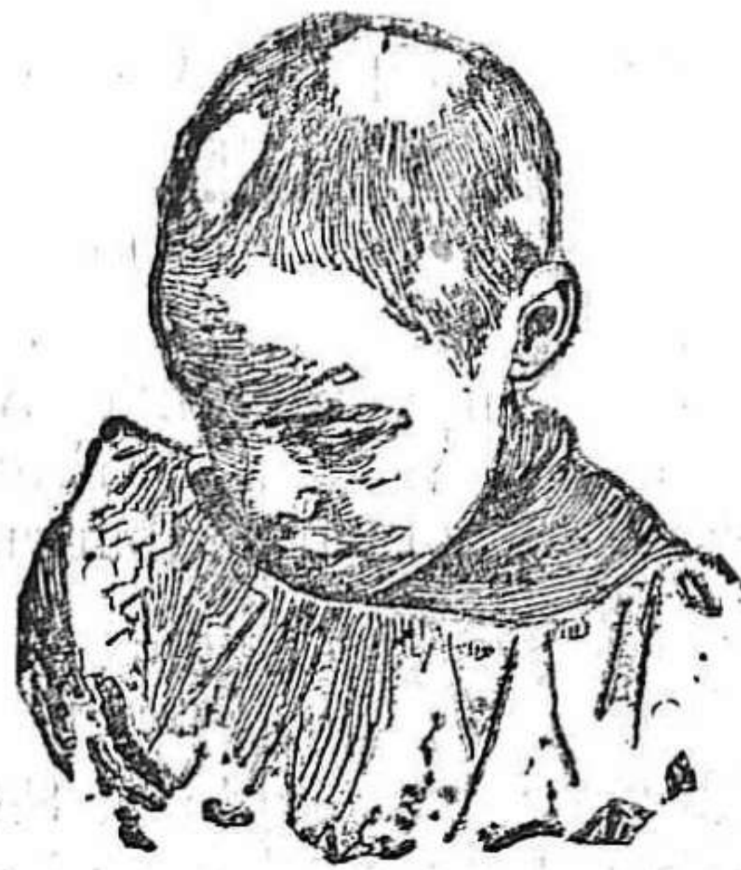
Antes de usar el Capilhol.