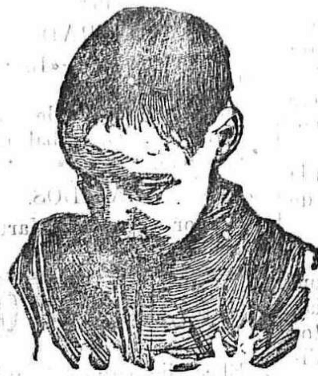
Después de usar el Capilhol