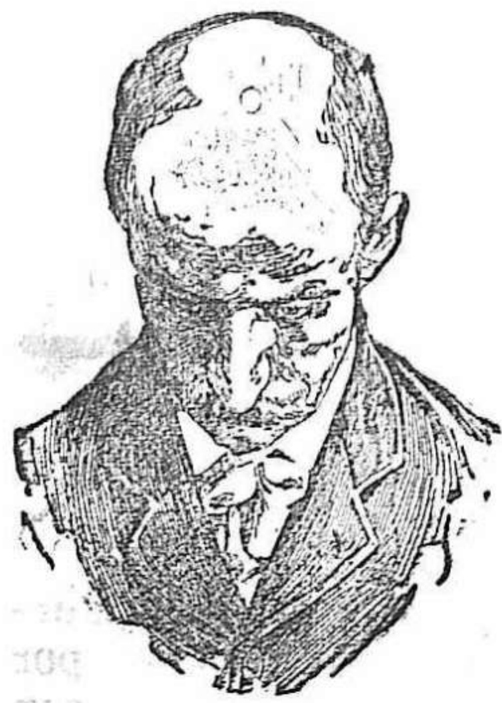
Antes de usar el Capilhol.