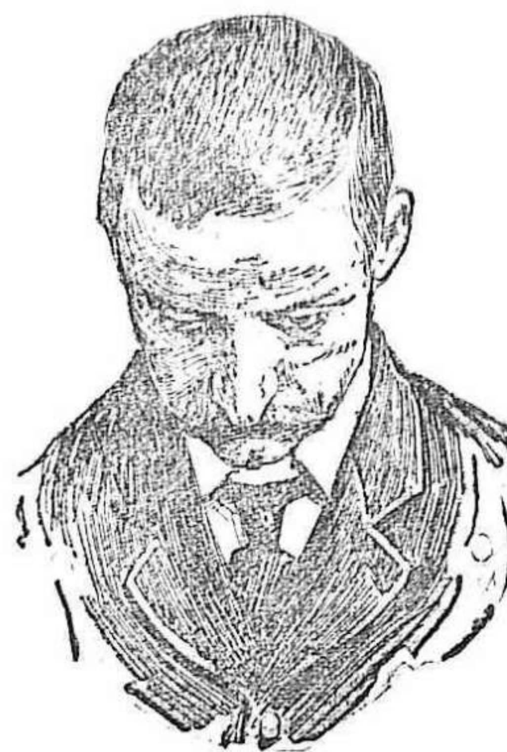
Después de usar el Capilhol