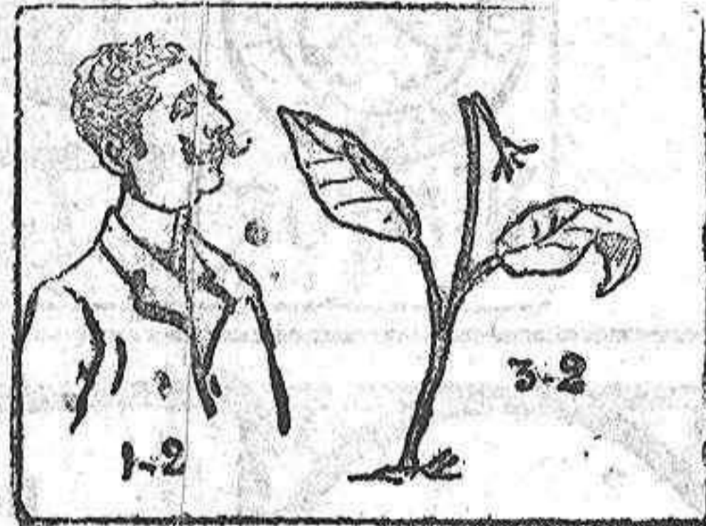
La solución mañana.