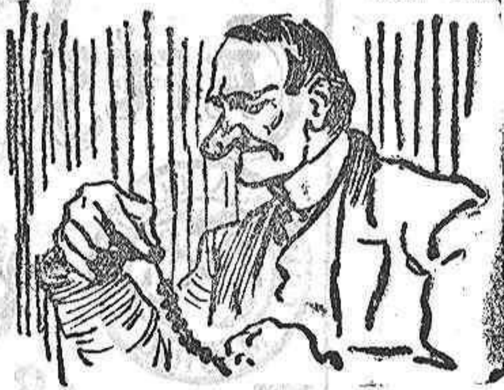
La solucion mañana.