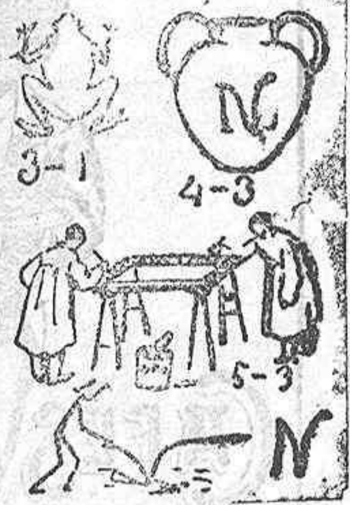
La solución mañana.