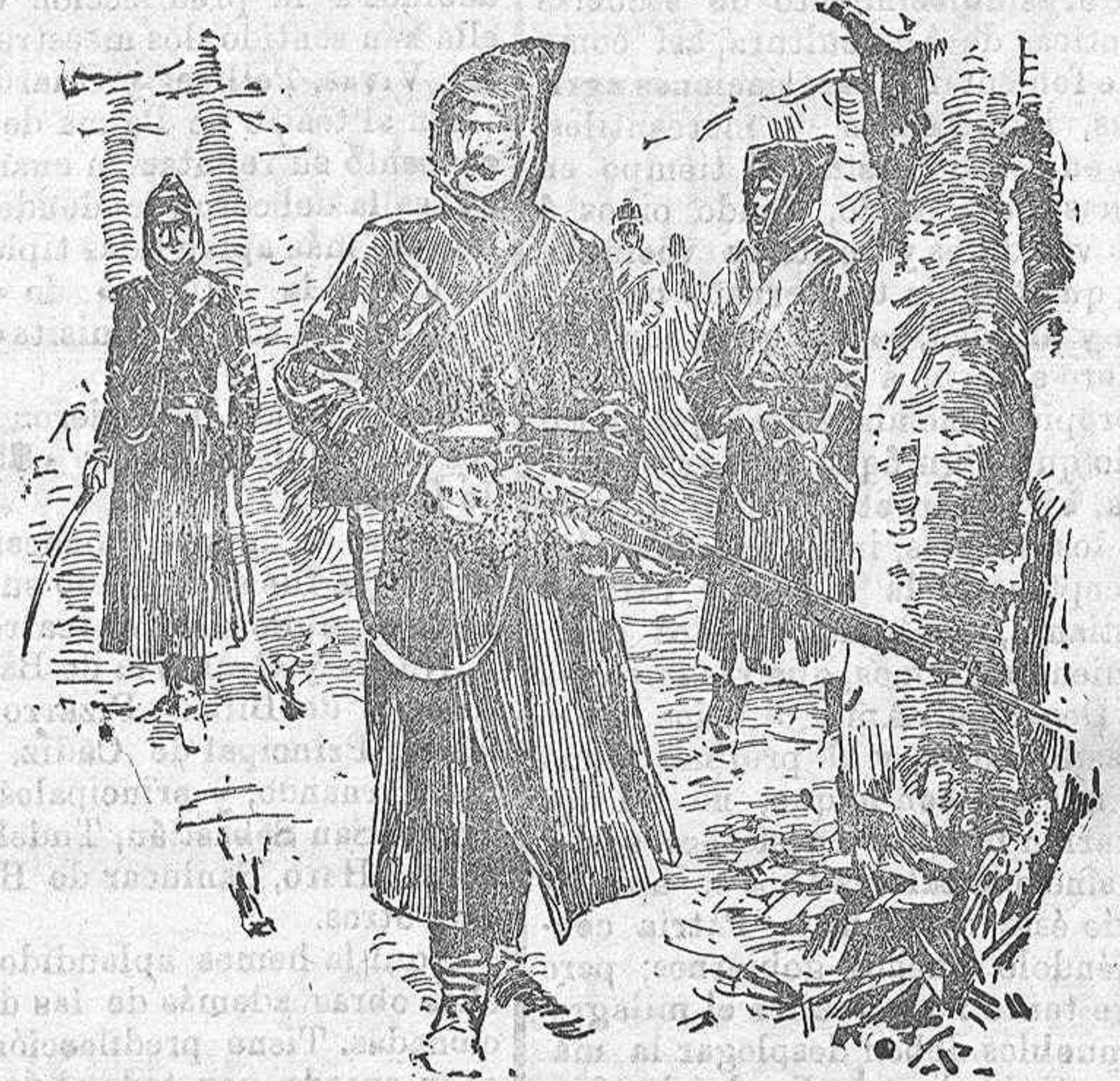
Exploradores rusos á orillas del Yalu.

cion, dirigiéndolas al Sr. Alcalde-Presidente y entregándolas al señor Secretario, que él expedirá de cada una de ellas el correspondiente recibo.