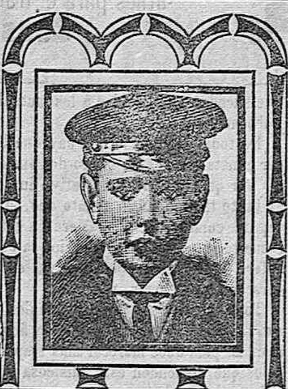
Barcelona, 11 Abril 1908. CALLE CONDE AVALLO NO. 42.

«Perdí el apéndice y me hallaba tan débil que ni podía estudiar ni jugar y finalmente me vi obligado á abandonar toda clase de ocupación. Era necesario acudir á algún tónico energético para combatir la anemia que se había arraigado en mi persona y darne las fuerzas necesarias para fortalecer mi constitución debilitada. Comencé á tomar la