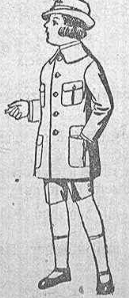
Trajes de patén modelo «Sport», para niños de 4 a 9 años. de ptas. 15 a 33