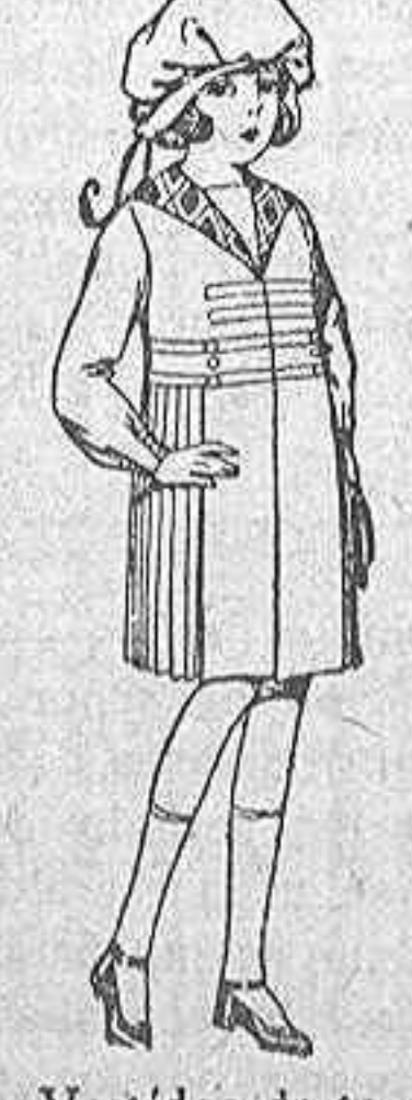
Vestidos de tannilla, adornos lana a cuadros, para niños de 4 a 9 años. de ptas 24 a 32