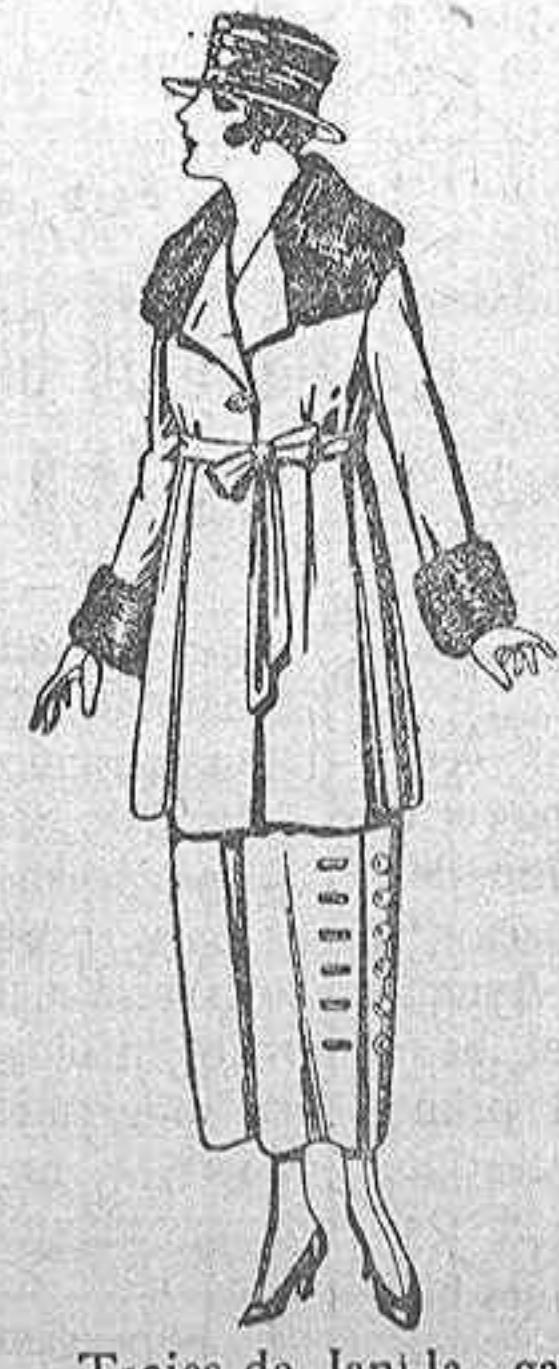
Trajes de lana, gaborina etc. azul y color, cuello y bocamangas piel. de ptas, 110 a 140. Los mismo, en punto de lana. de ptas. 150 a 180