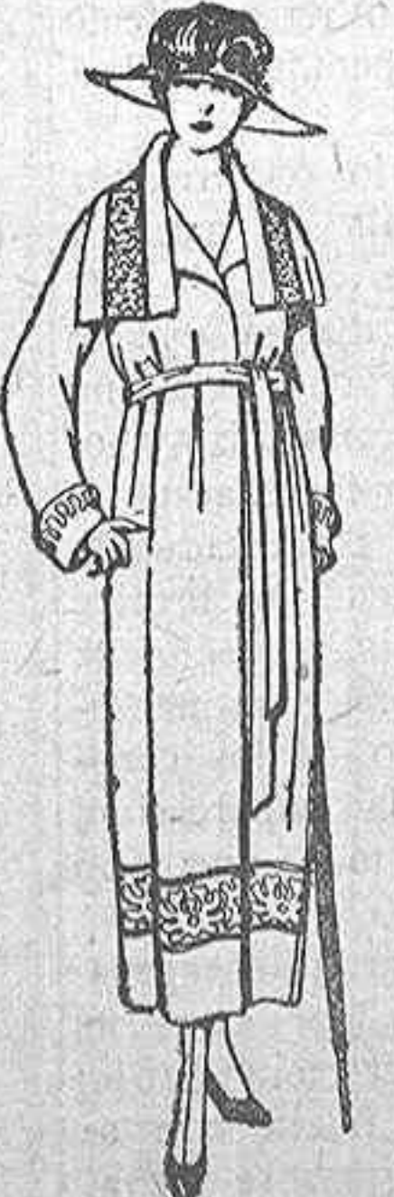
Abrigos de punto de lana, en azul y color adornos bordados. de ptas. 135 a 180.