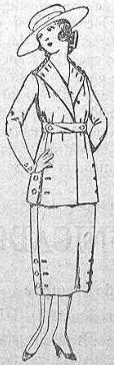
Trajes estambres o arga ligera, en azul o color, para juveniles. de 12 a 15 años. de ptas. 55 a 65