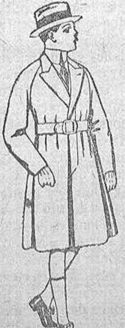
Gabanes de patén, para niños de 4 a 9 años. de ptas. 16 a 50.