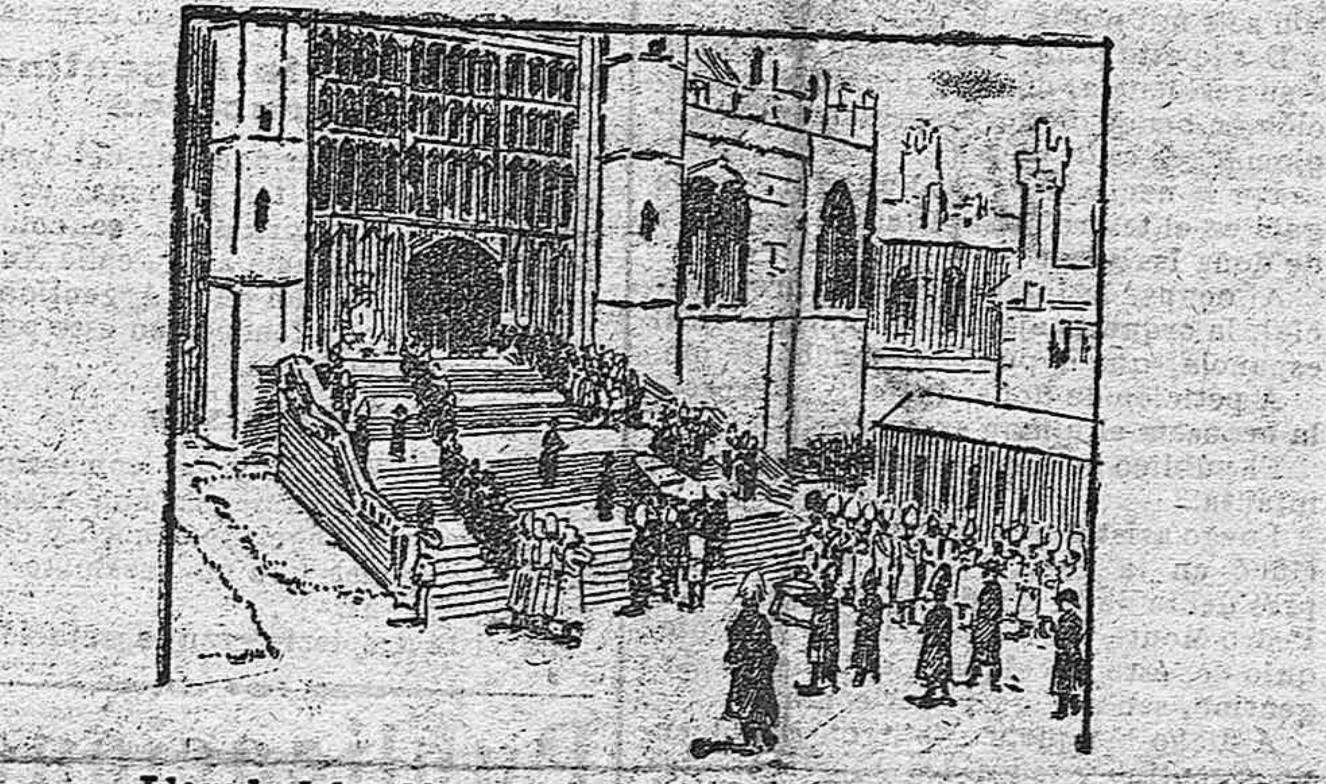
Llegada del cadáver a la capilla del castillo de Windsor