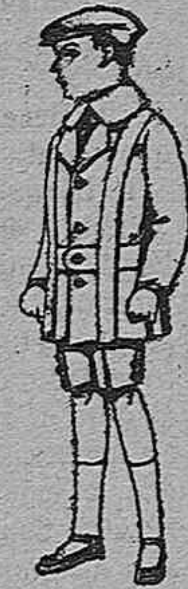
Trajes de patén para niños de 4 a 9 años. De pts. 12 a 33.