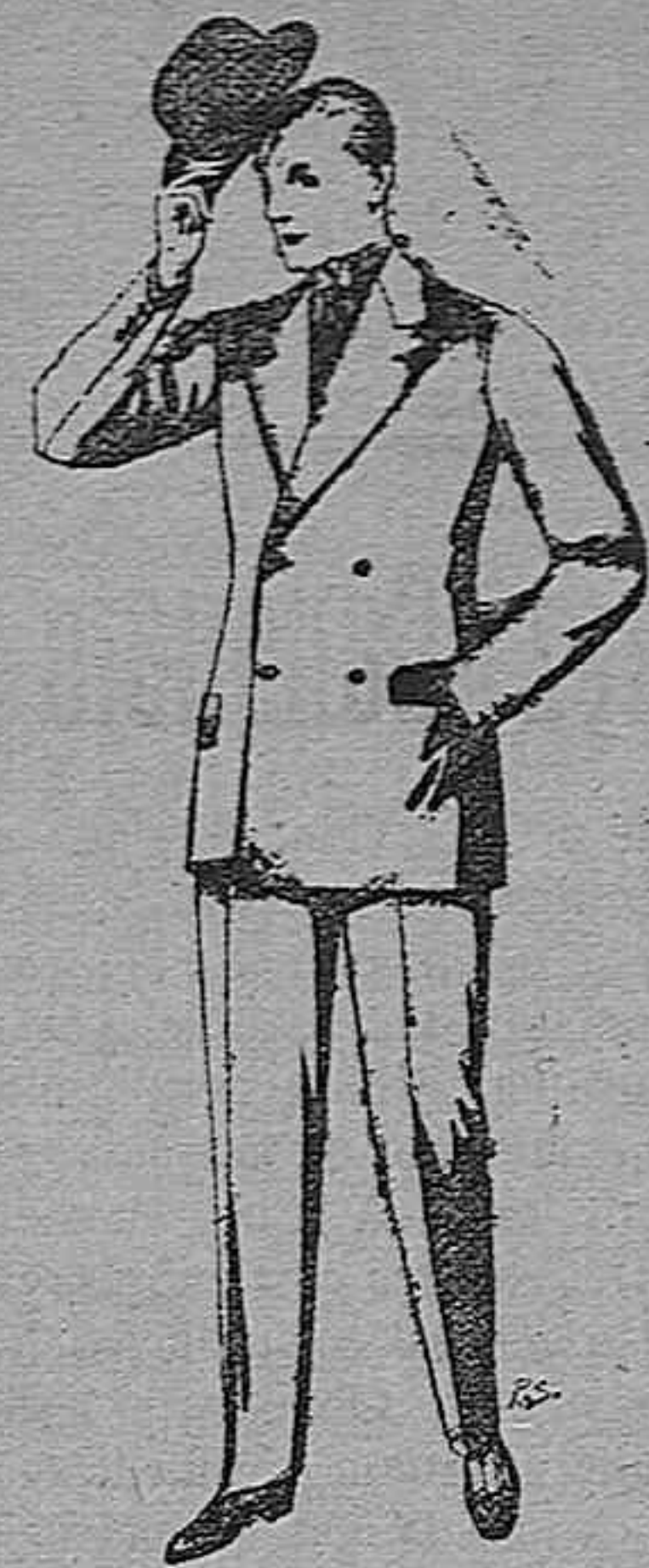
Trajes de cheviot, patén, etc. De pesetas 27 a 80. Trajes de vicuña o jerga. De pesetas 30 a 85. Los mismos, a medida. De pesetas 65 a 130.