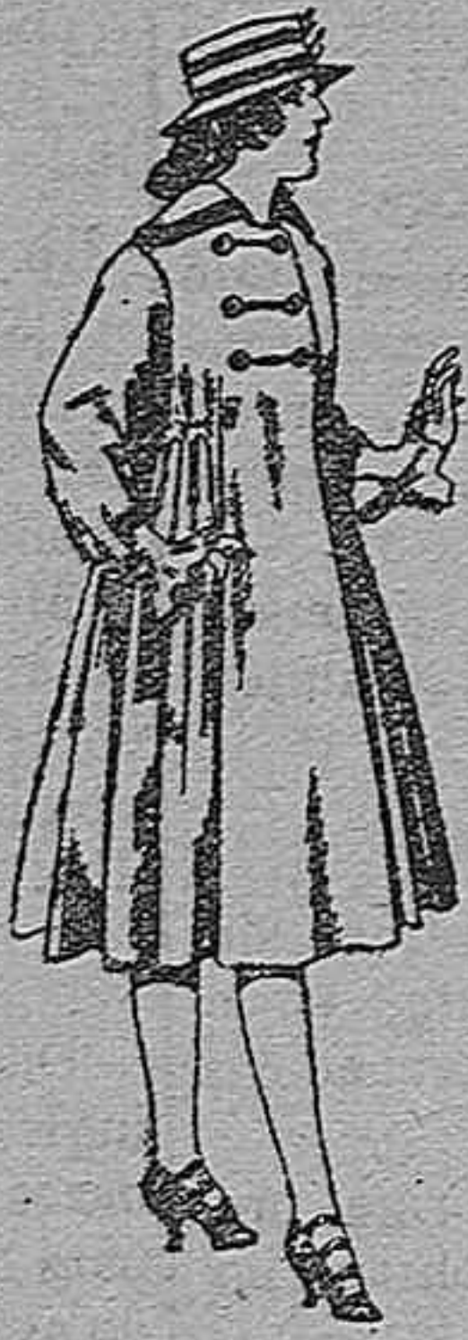
Abrigos de patén para jovencitas de 11 a 15 años. De pts. 35 a 50.