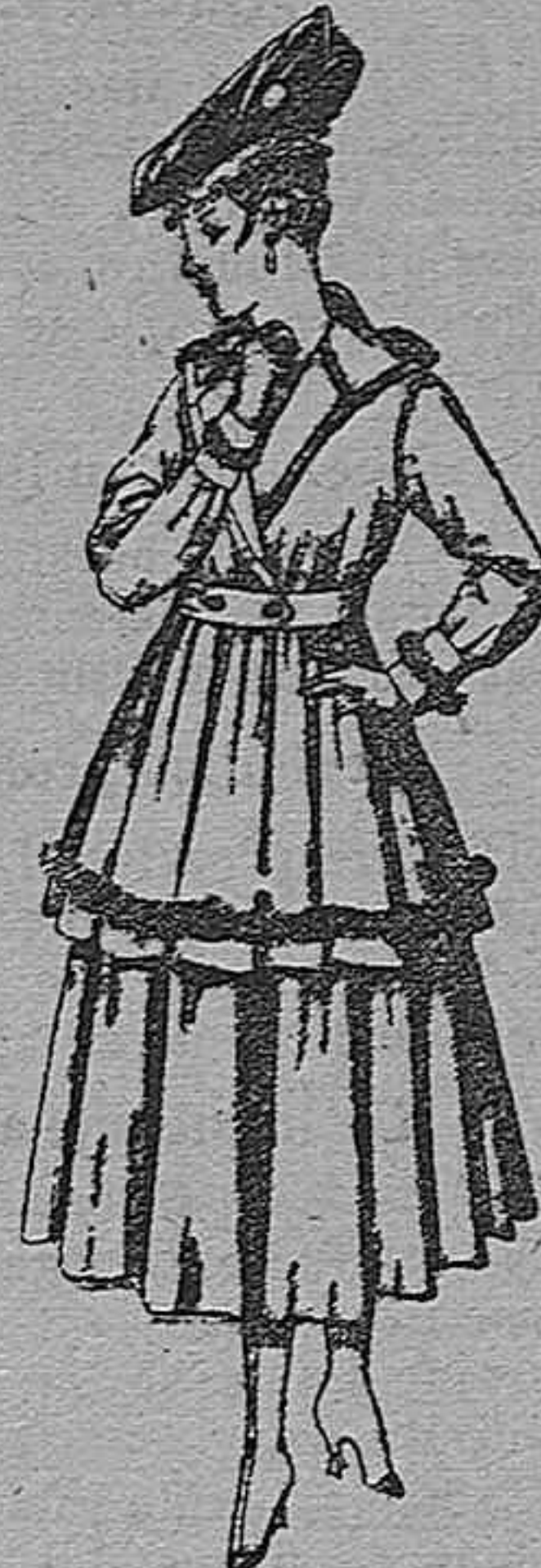
Gabanes de patén o cheviot, con cinturón. De pesetas 50 a 110. Los mismos a medida. De pts. 65 a 145.