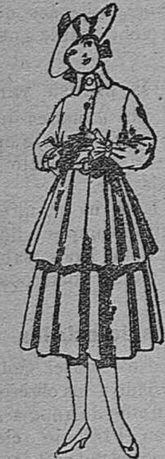
Trajes de lina, para jovencitas de 12 a 15 años. De pts. 45 a 55.