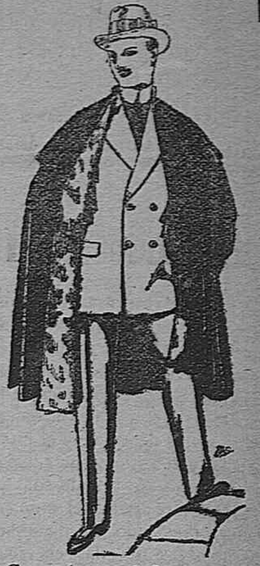
Capas (enteras) de paños de Béjar y Terrasa, embozos de peluche, terciopelo, astrakán a escocés. De pesetas 35 a 115.