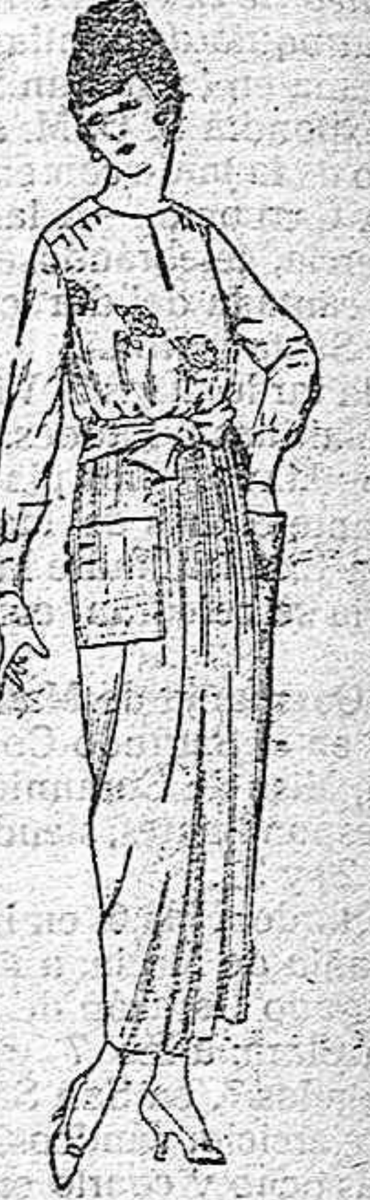
Busas de crepón, voile, etc., en negro, azul y color, adornos bordados. de ptas. 17 a 22. Falda de anillo, estambre, gabardina, etc., en negro, azul y color. de ptas. 28 a 36.