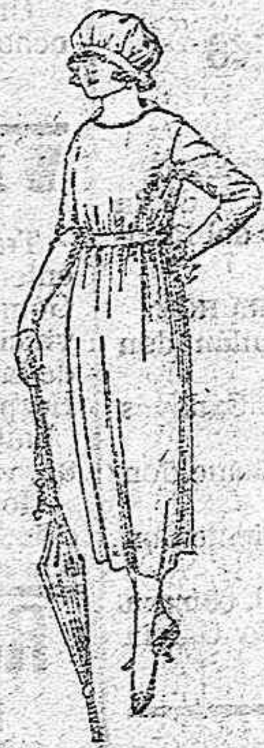
Vestidos de estambre, anillo, etc., en azul y colores, adornos bordados. de ptas. 57 a 63.