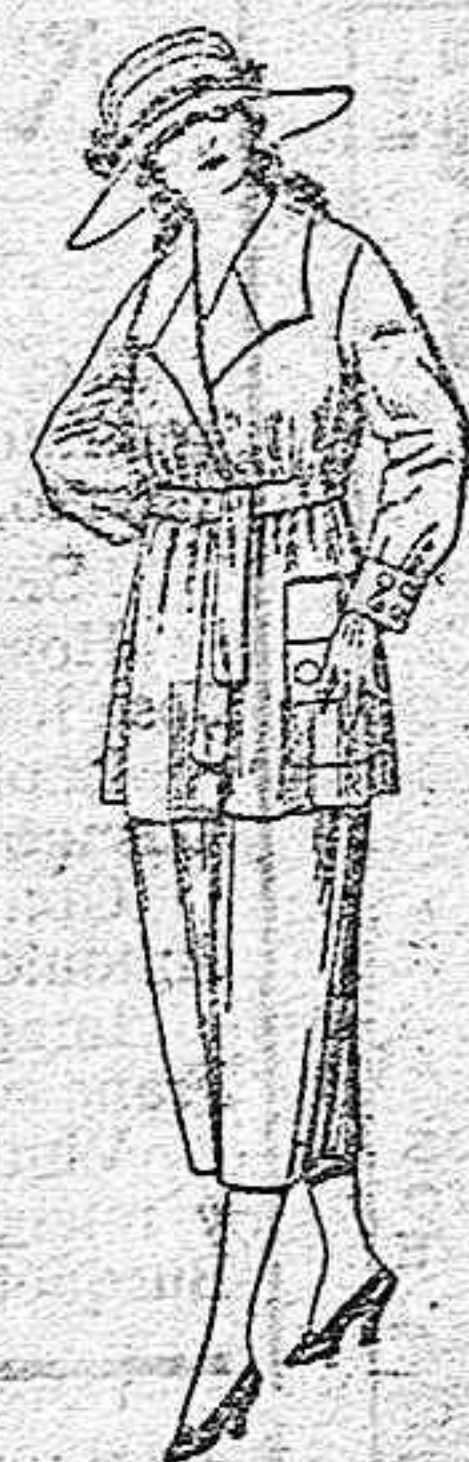
Trajes de estambre gabardina, en azul y colores. de ptas. 63 a 78.