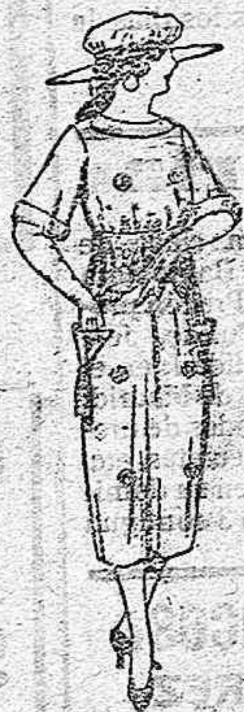
Vestidos de sarga inglesa, estambre etc., en azul y colores, adornos bordados. de ptas. 59 a 62.