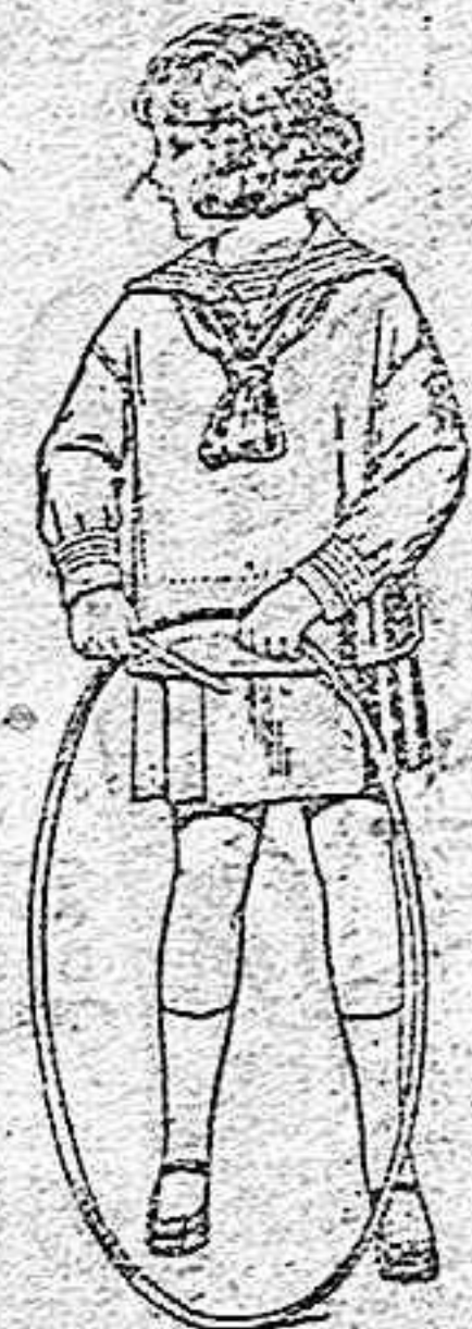
Trajes modelo "Mona-Lisa" de estambre o sarga azul, para niños de 4 a 9 años. de ptas. 30 a 42.