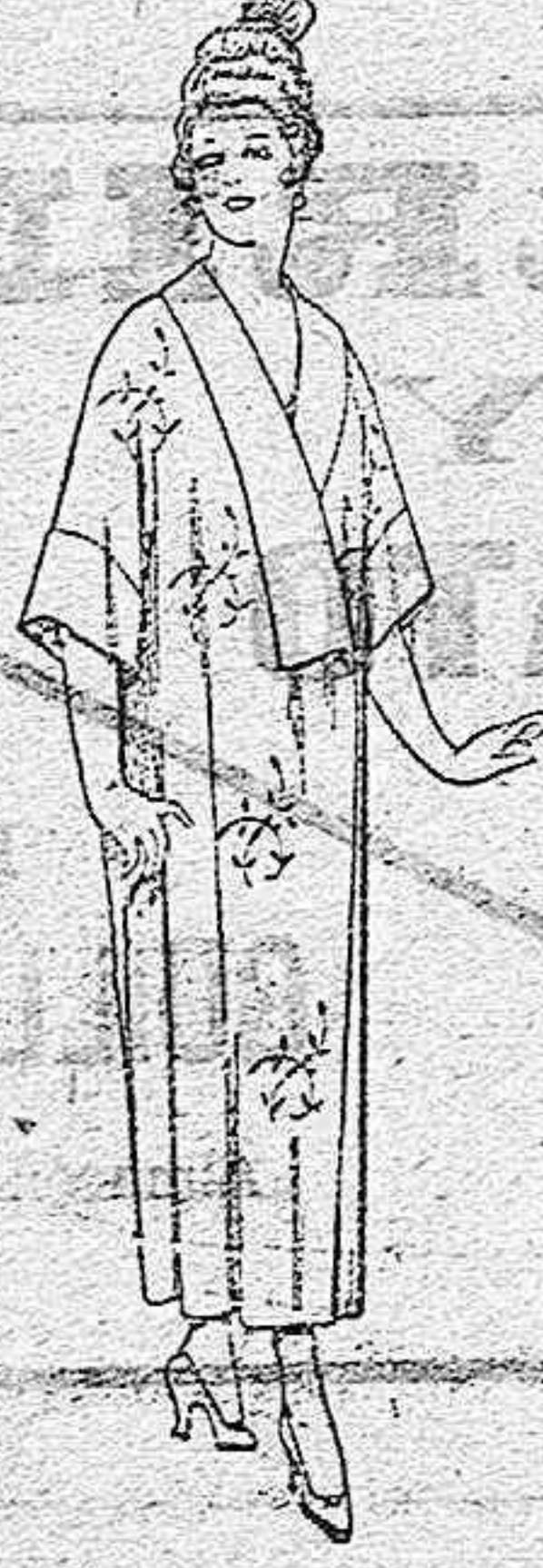
Batas de esterilla Matting, adornos bordados. de ptas. 45 a 58.