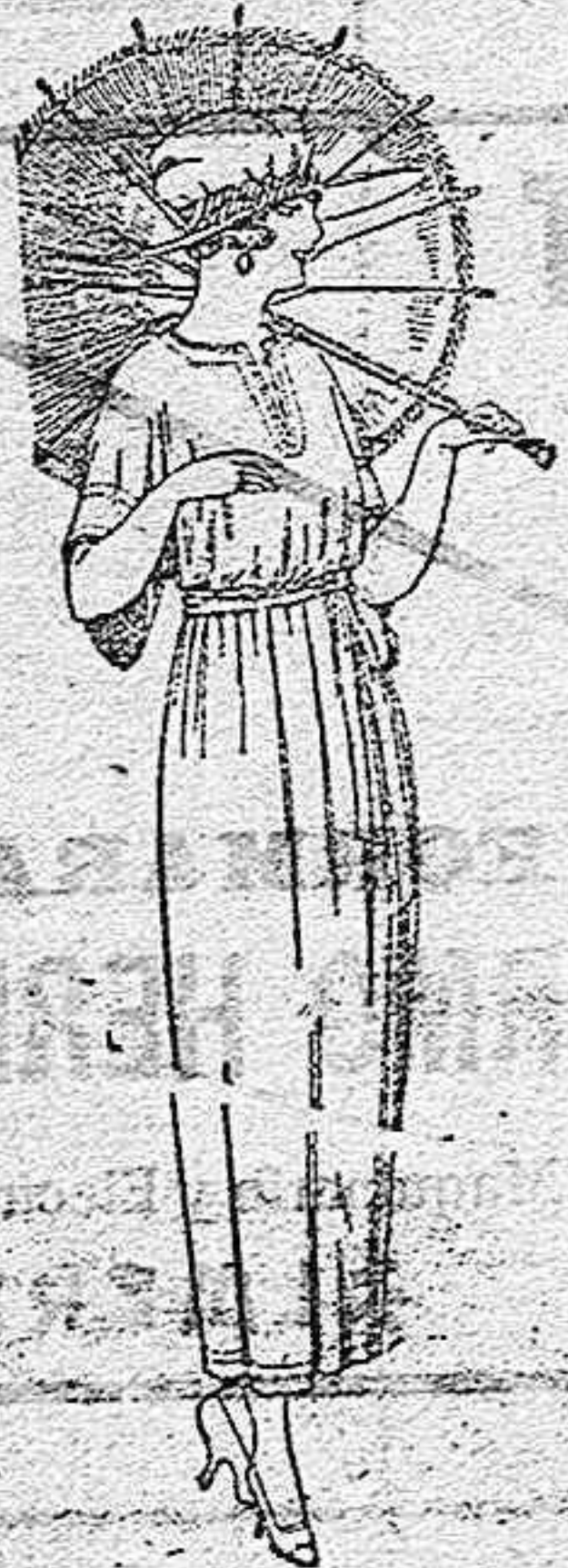
Vestidos de voile e blanco, adornos bordados. de ptas. 45 a 60.