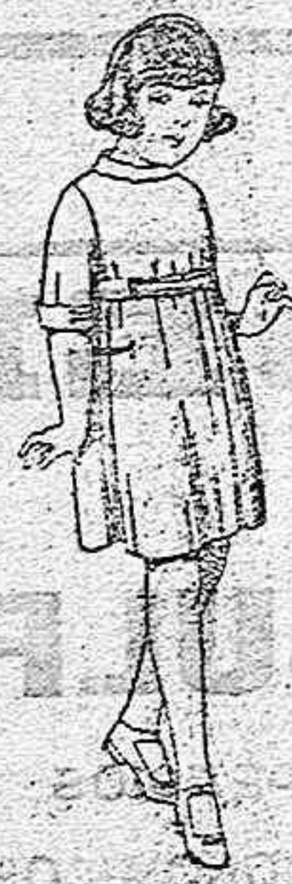
Vestidos de sarga inglesa azul, adornos sarga blanca, para niños de 4 a 9 años. de ptas. 36 a 40.