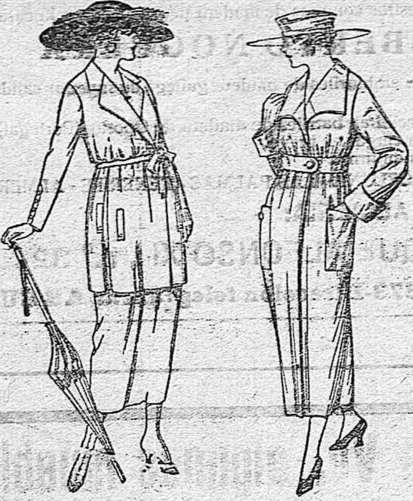
Trajes de estambre, anillo, etc., en negro, azul y color. de ptas. 120 a 135.

Sucursales: Madrid, Barcelona, Alicante, Bilbao, Cádiz, Cartagena, Gijón, Granada, Málaga, Palma de Mallorca, Santander, Sevilla, Valencia, Valladolid, Zaragoza.