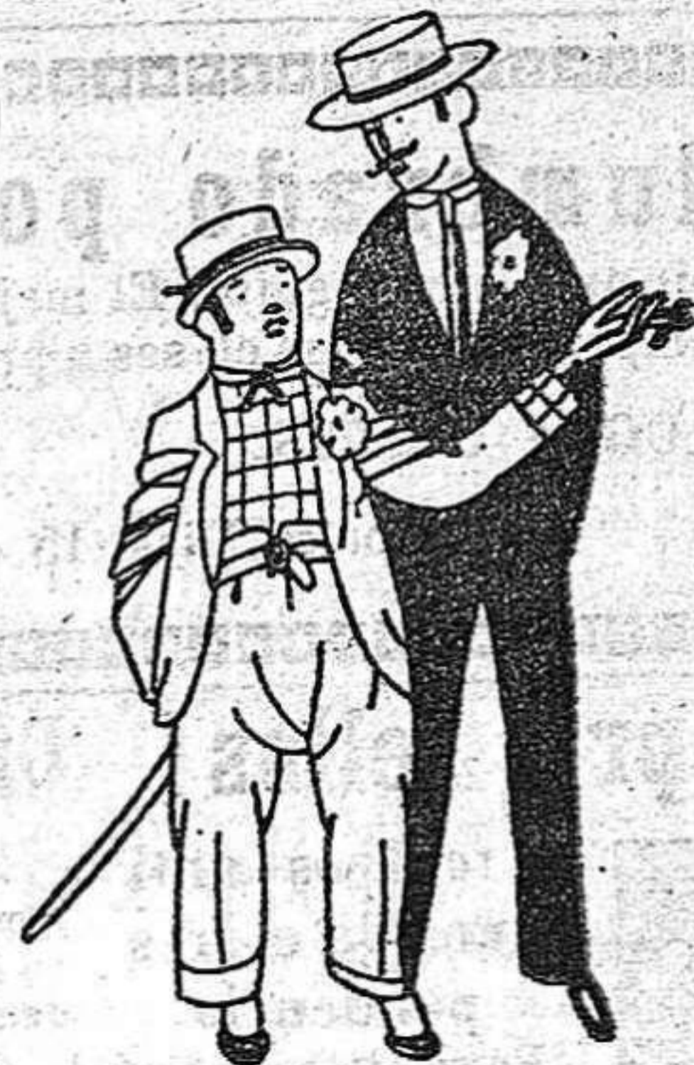
—¿Que porqué se fuma tanto el INDIO ROSA? Se explica por que es el mejor papel de fumar que se fabrica.